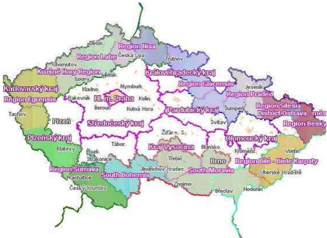
Mapa umístění jednotlivých Euroregionů v České republice