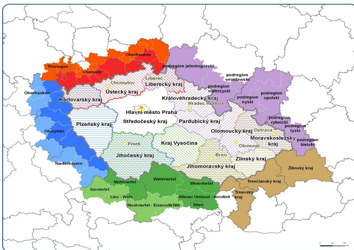
Obrázek 1: Územní vymezení přeshraniční spolupráce v letech 2007-2013

Zdroj: Centrum pro regionální rozvoj České republiky. Evropská územní spolupráce 2007 – 2013