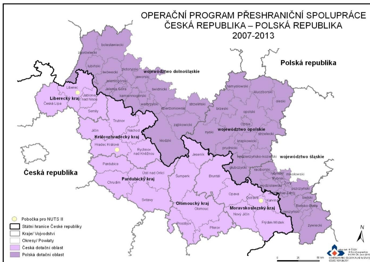
Obrázek 3: Operační program Přeshraniční spolupráce Česká republika – Polsko 2007-2013

Zdroj: Centrum pro regionální rozvoj ČR, Přeshraniční spolupráce ČR – Polsko