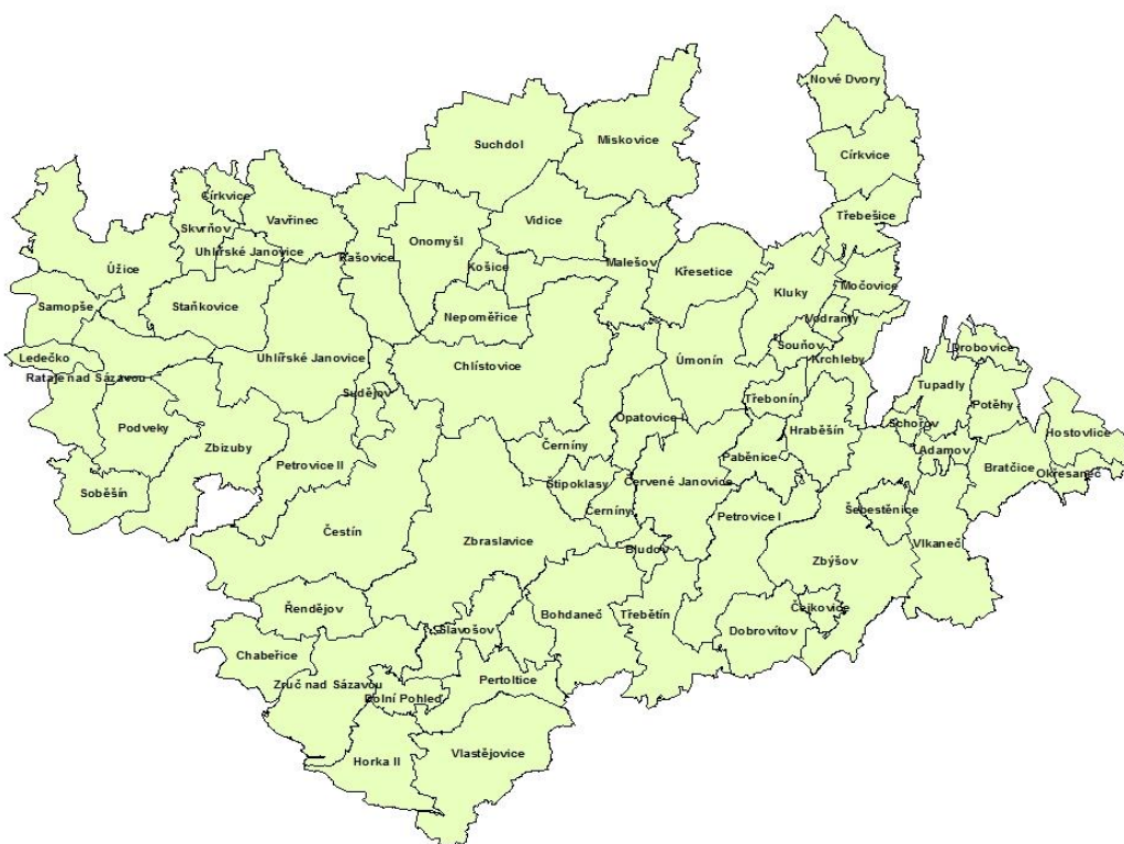
Obr. č. 2.: Mapa obcí MAS Lípa pro venkov (Cenia, 2013):

Jak již bylo zmíněno, MAS Lípa pro venkov sdružuje v současnosti 73 obcí. Největší obcí z hlediska rozlohy jsou Zbraslavice s celkovou výměrou 3 809 ha, nejmenší Schořov s 142 ha. Nejvíce obyvatel má Zruč nad Sázavou 5 092 a nejméně Bludov 27 obyvatel. Podrobnější přehled uveden v příloze.