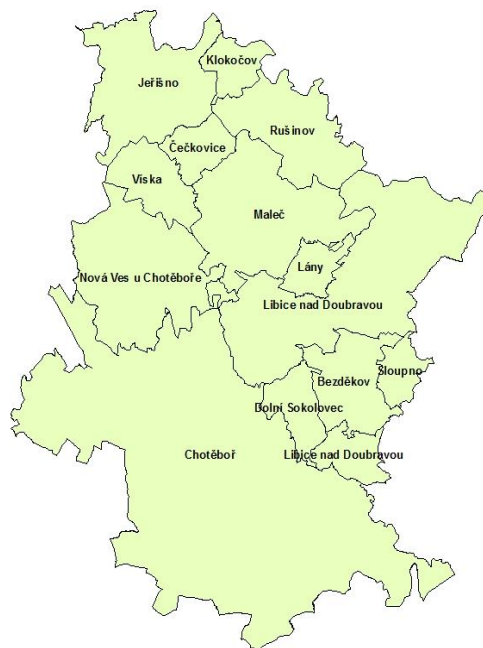
Obr. č. 4.: Mapa obcí MAS Podhůří Železných hor (Cenia, 2013):

MAS Podhůří Železných hor zahrnuje 13 obcí. Největší z nich je Chotěboř s rozlohou 5 406ha a 9 906 obyvateli. Nejmenší obcí je se 186ha a 45 obyvateli obec Sloupno. Úplný přehled obcí uveden v příloze.