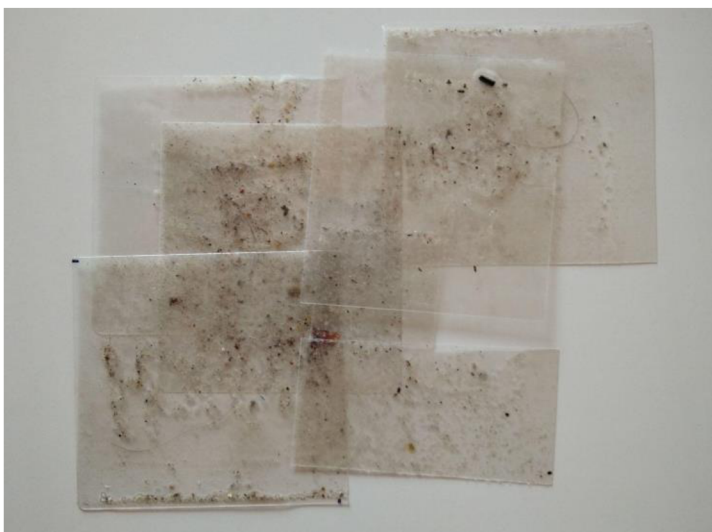
Princip vrstvení s laminovaným prachem