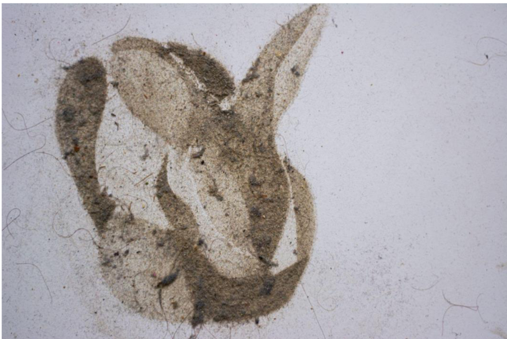
Dust bunny malba prachem na papíře, 2022, 30×30 cm