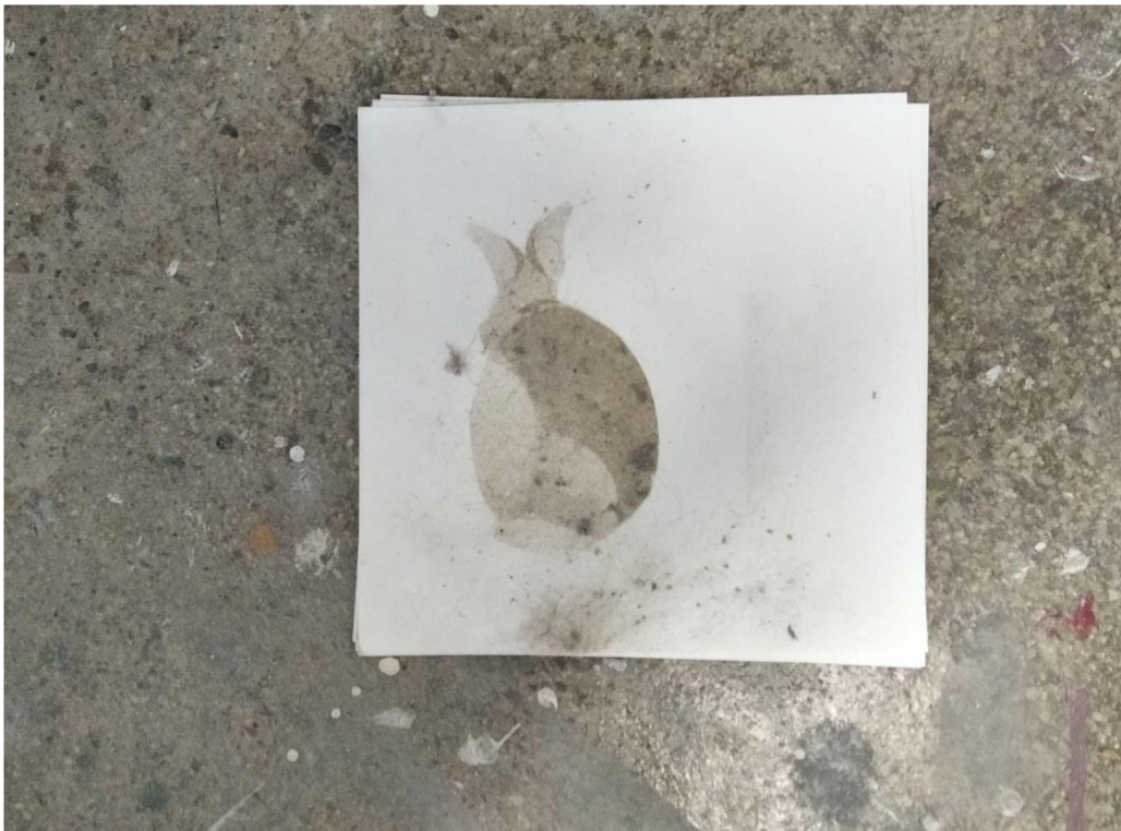
Dust bunny malba prachem na papíře, 2022, 30×30 cm