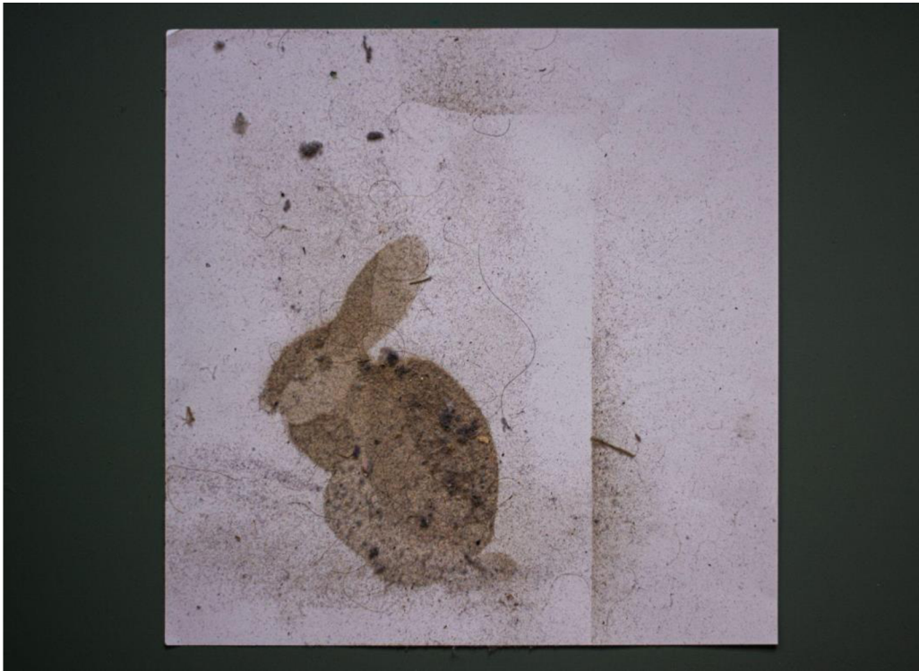
Dust bunny malba prachem na papíře, 2022, 30×30 cm