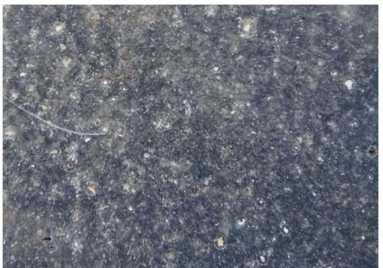
Zalaminovaný prach – detail