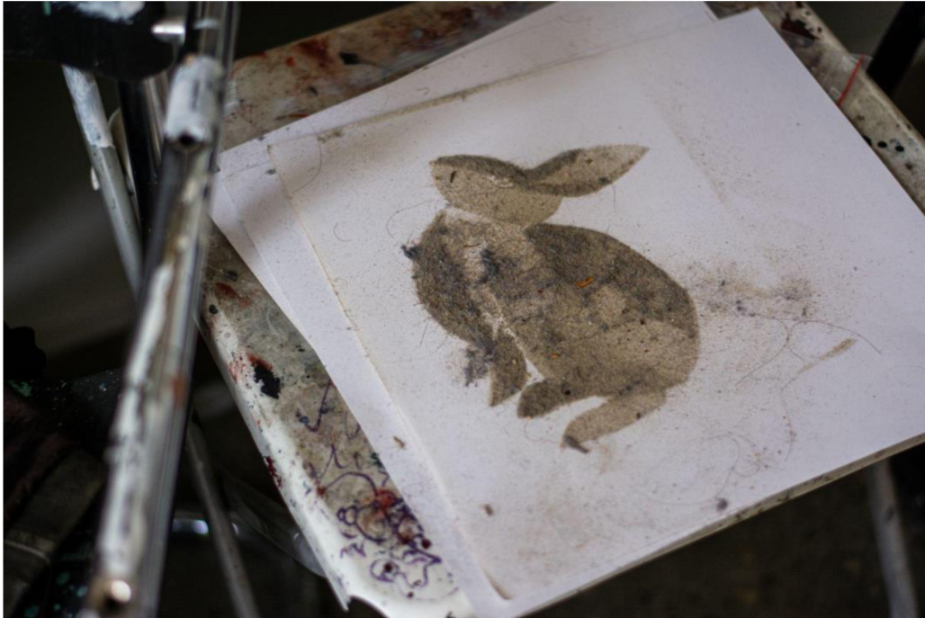
Dust bunny malba prachem na papíře, 2022, 30×30 cm