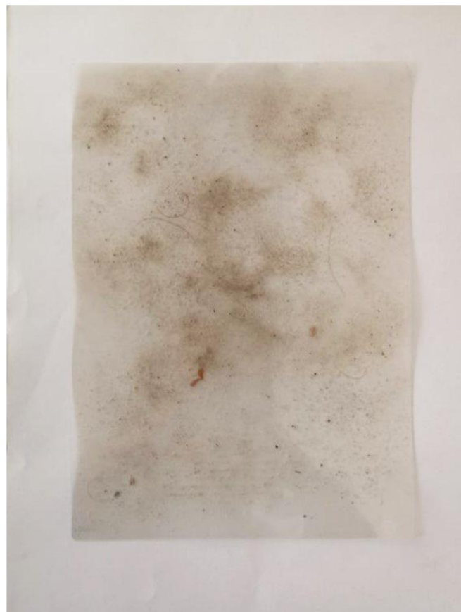
Zalaminovaný prach laminace, 2022, 29×21 cm