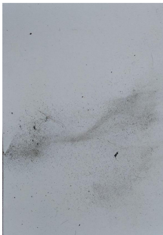
Smetání prachu (výběr) Prach na papíře, 2022, 31×22 cm