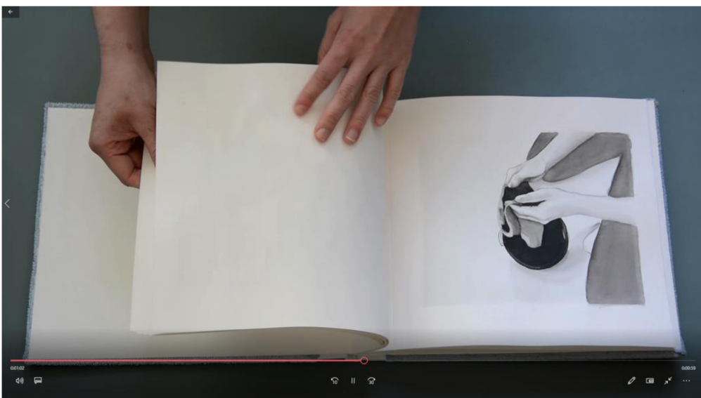
Výřez z videí autorských knih "Jak sbírám prach"