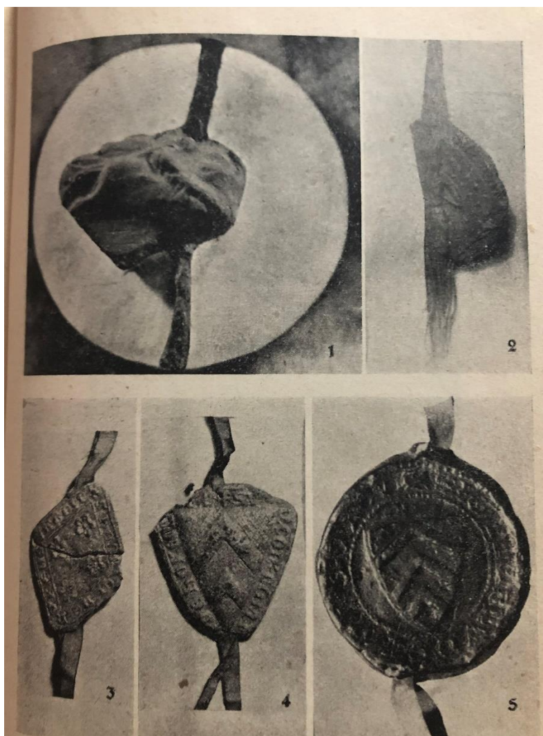
Obrázek 10: Pečeti Arnolda z Hückeswagenu (1), Adely z Hückeswagenu (2), Heinricha z Hückeswagenu (3), Franka z Hückeswagenu (4), Bluda a Jindřicha z Příbora (5).