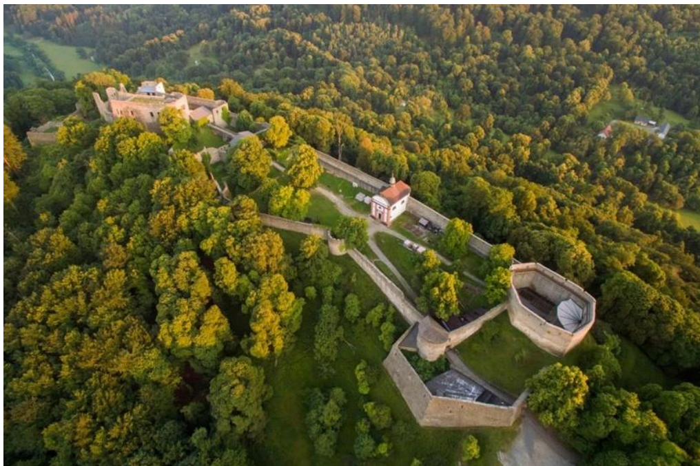
Obrázek 1: Letecký pohled na hrad Hukvaldy, nejspíš mezi lety 1270–1280.