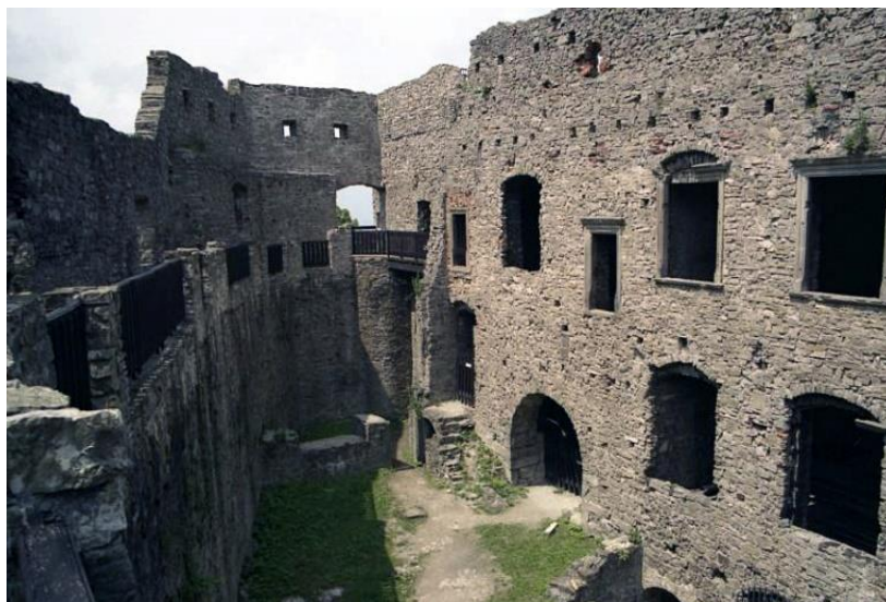
Obrázek 6: Palác hradu Hukvaldy z let 1270–1280.