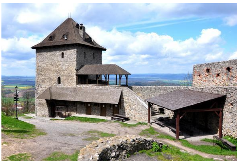
Obrázek 7: Hrad Starý Jičín, hlavní věž s hradbou.