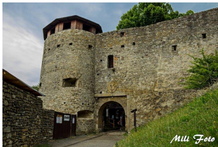
Obrázek 3: Dnešní vstup do hradu Hukvaldy.