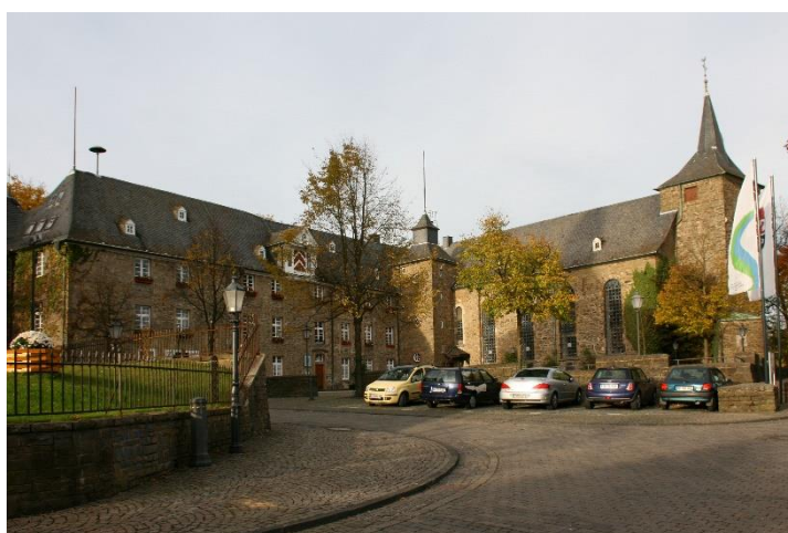
Obrázek 9: Dnešní zámek Hückeswagen.