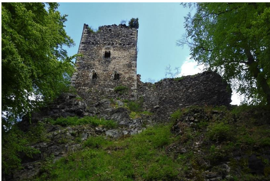
Obrázek 11: Hlavní věž hradu Osek.