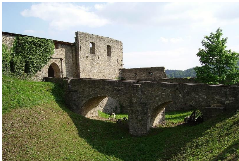
Obrázek 2: Třetí hradní brána Hukvald 1270–1280.