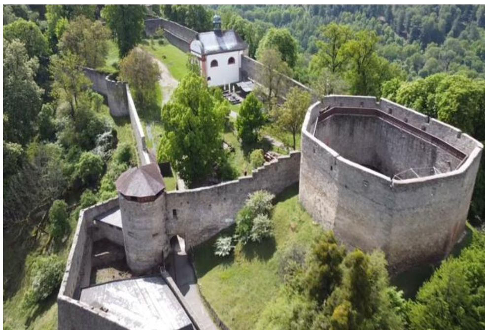
Obrázek 4: Pohled na mottu vpravo, dále pak na kapli sv. Ondřeje.