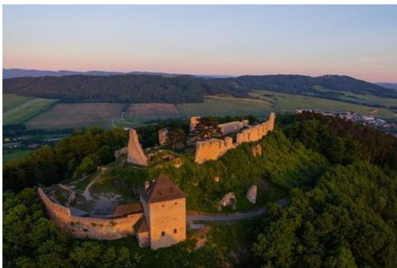
Obrázek 8: Letecký pohled na Hrad Starý Jičín.