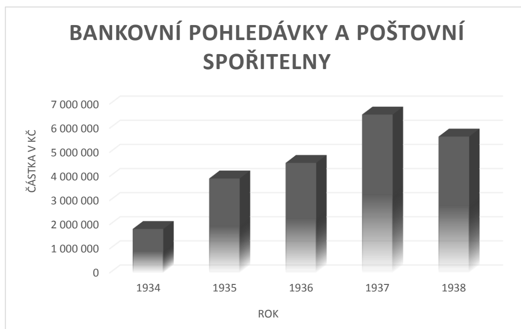
Graf č. 2: Růst položky Bankovní pohledávky a poštovní spořitelny [14, 15, 16, 17, 18].

Všeobecná rezie, odpisy, čistý zisk, daně, dávky a poplatky byly obsahem účtu ztrát. Zisk byl složen z položek jednatelské provize, úroků a ostatních příjmů a zisku z předcházejících let.