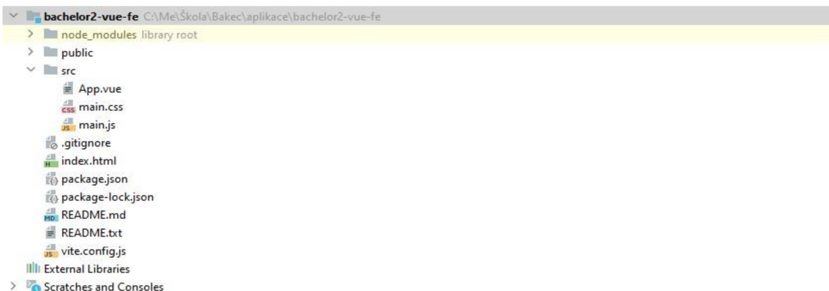
Obr. 2: Struktura Vue aplikace