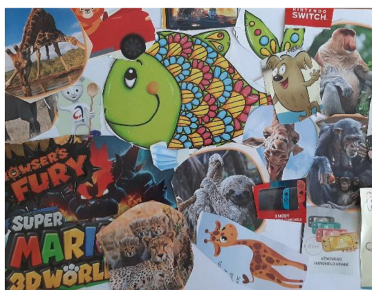
Obr. 20 Výsledný výkres (zvířátka a herní konzole)