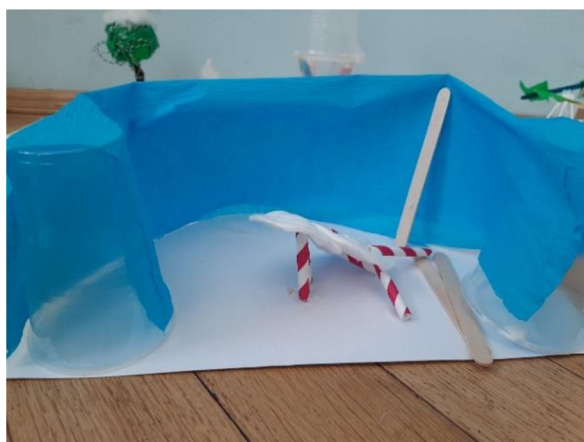
Obr. 18 Výsledný výkres (třída s rozbitou židlí)