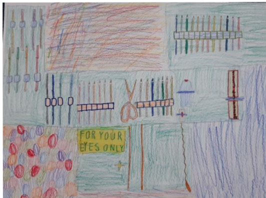
Obr. 12 Výsledný výkres