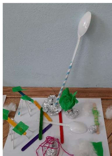
Obr. 19 Výsledný výkres (zábavní park)