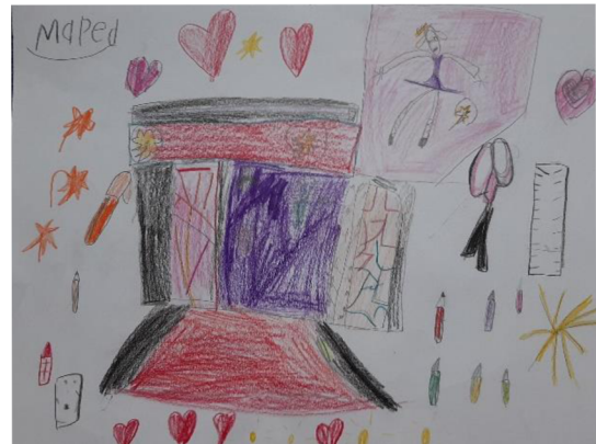
Obr. 15 Výsledný výkres