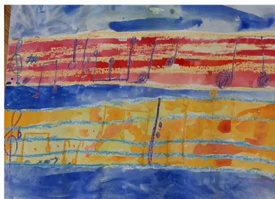
Obr. 5 Výsledný výkres