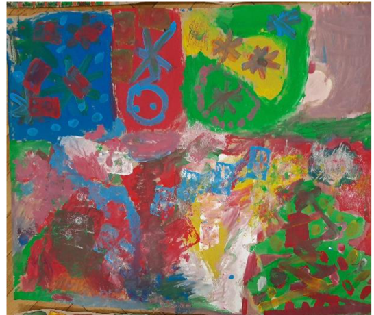
Obr. 2 Výsledný výkres