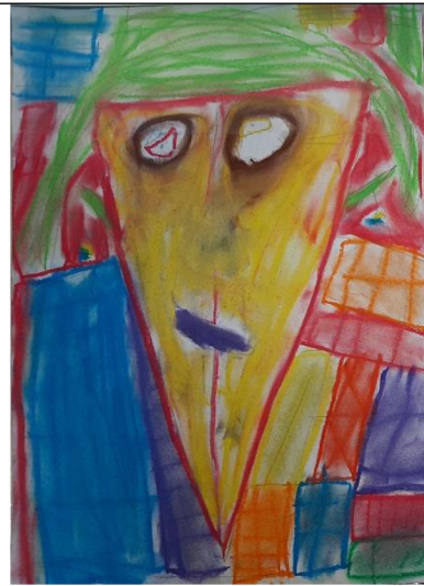
Obr. 9 Výsledný výkres