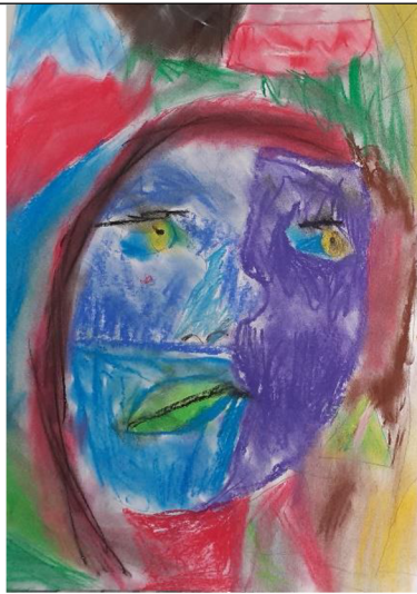
Obr. 8 Výsledný výkres