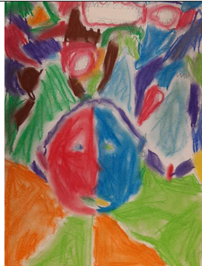
Obr. 11 Výsledný výkres