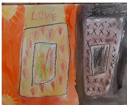
Obr. 6 Výsledný výkres