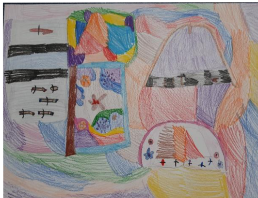
Obr. 14 Výsledný výkres