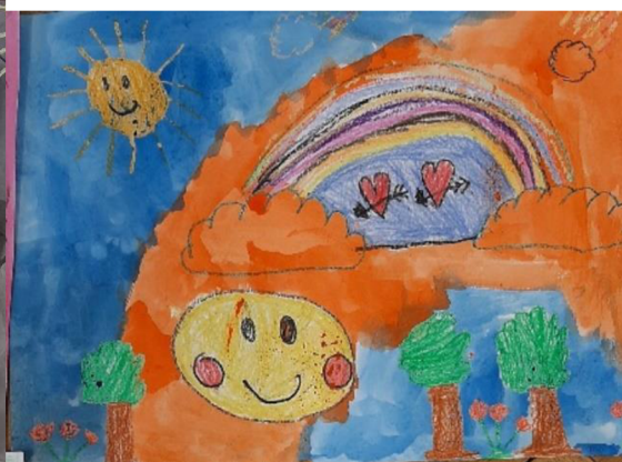
Obr. 7 Výsledný výkres