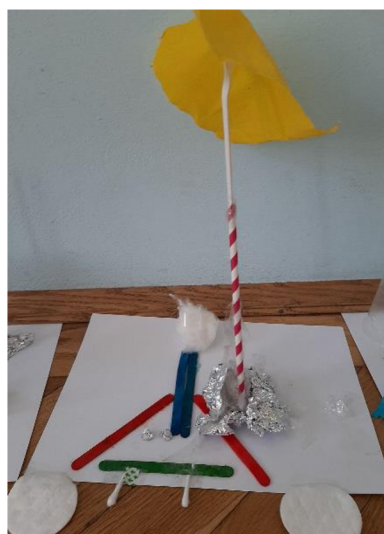
Obr. 17 Výsledný výkres (baletka na pláži pod slunečníkem)