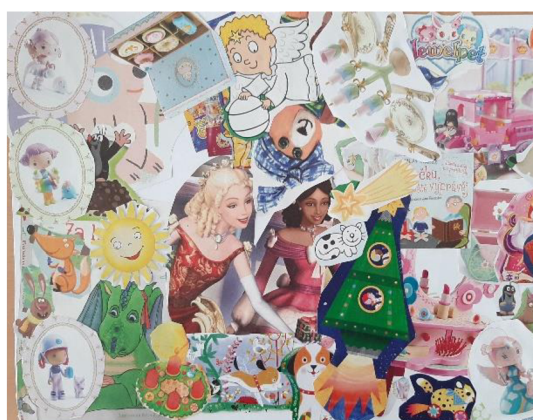
Obr. 21 Výsledný výkres (popletená pohádka)