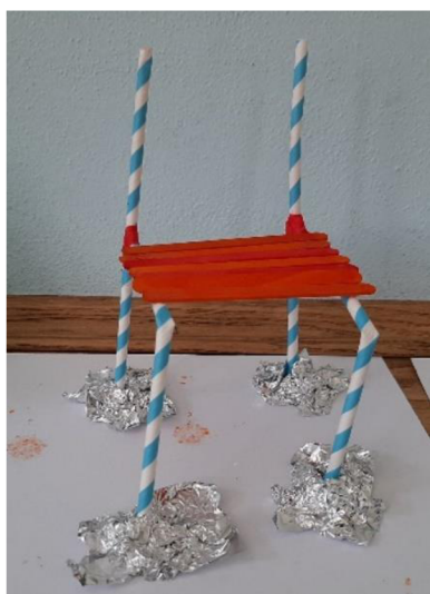
Obr. 16 Výsledný výkres (zrádná židle)