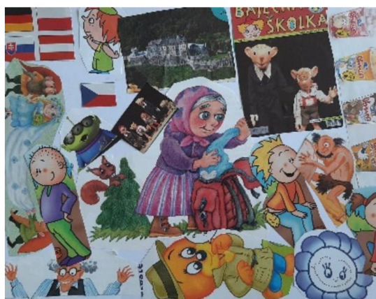
Obr. 22 Výsledný výkres (pohádkový les)