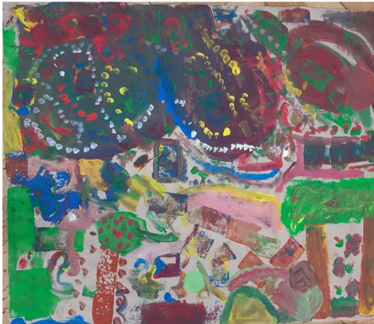
Obr. 1 Výsledný výkres