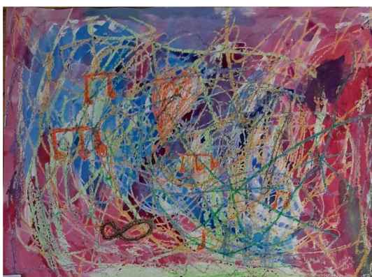
Obr. 4 Výsledný výkres