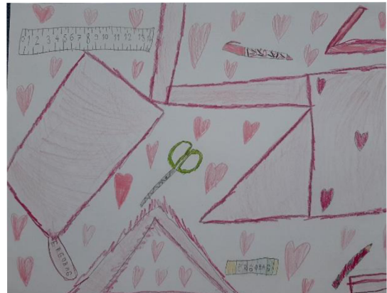
Obr. 13 Výsledný výkres