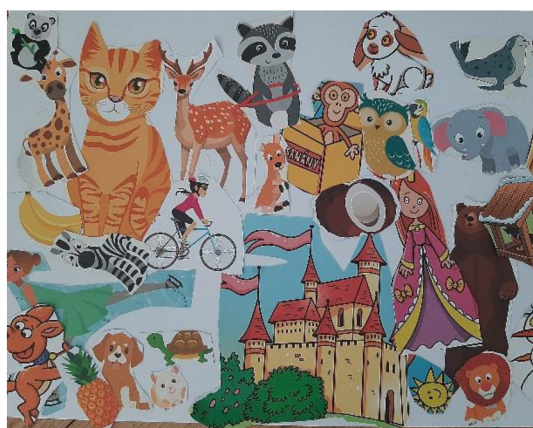
Obr. 23 Výsledný výkres (zvířátka a princezny)