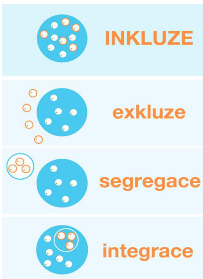
Obrázek 2 - Přístupy ke vzdělávání dětí se SVP (npi.cz, online, dostupné: z http://www.inkluzevpraxi.cz/apivb/co-je-inkluzi )

Nejnovějším pojmem je inkluze, ta označuje jakýsi vyšší stupeň integrace. Tato fáze se odklání od diagnostických kritérií, protože všichni lidé jsou si rovni a není potřeba je