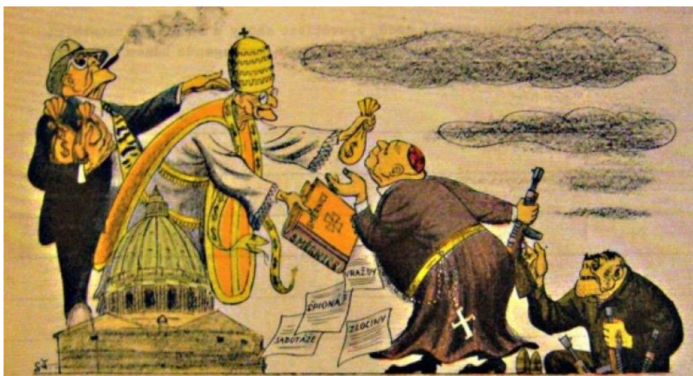
Obrázek 4 Proticírkevní propaganda v době komunismu