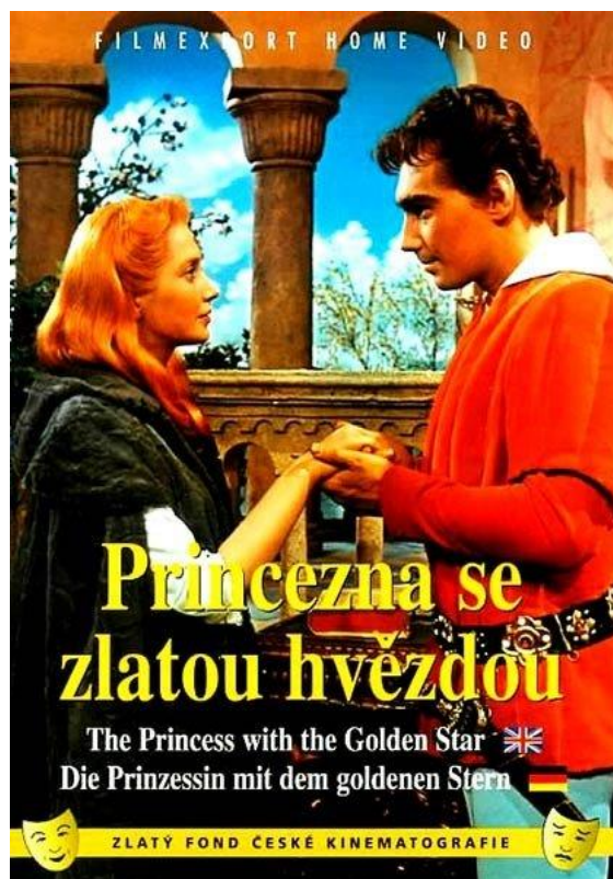
Obrázek 7 Princezna se zlatou hvězdou