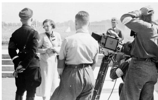
Obrázek 5 Leni Riefenstahl a Heinrich Himmler při natáčení triumfu vůle