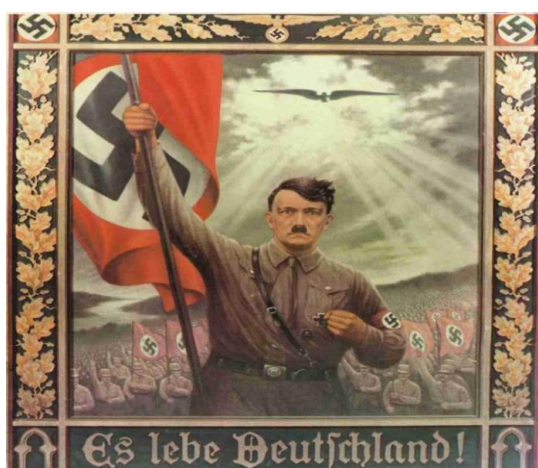
Obrázek 2 Adolf Hitler v přímých prezidentských volbách