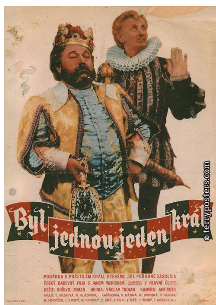
Obrázek 8 Byl jednou jeden král