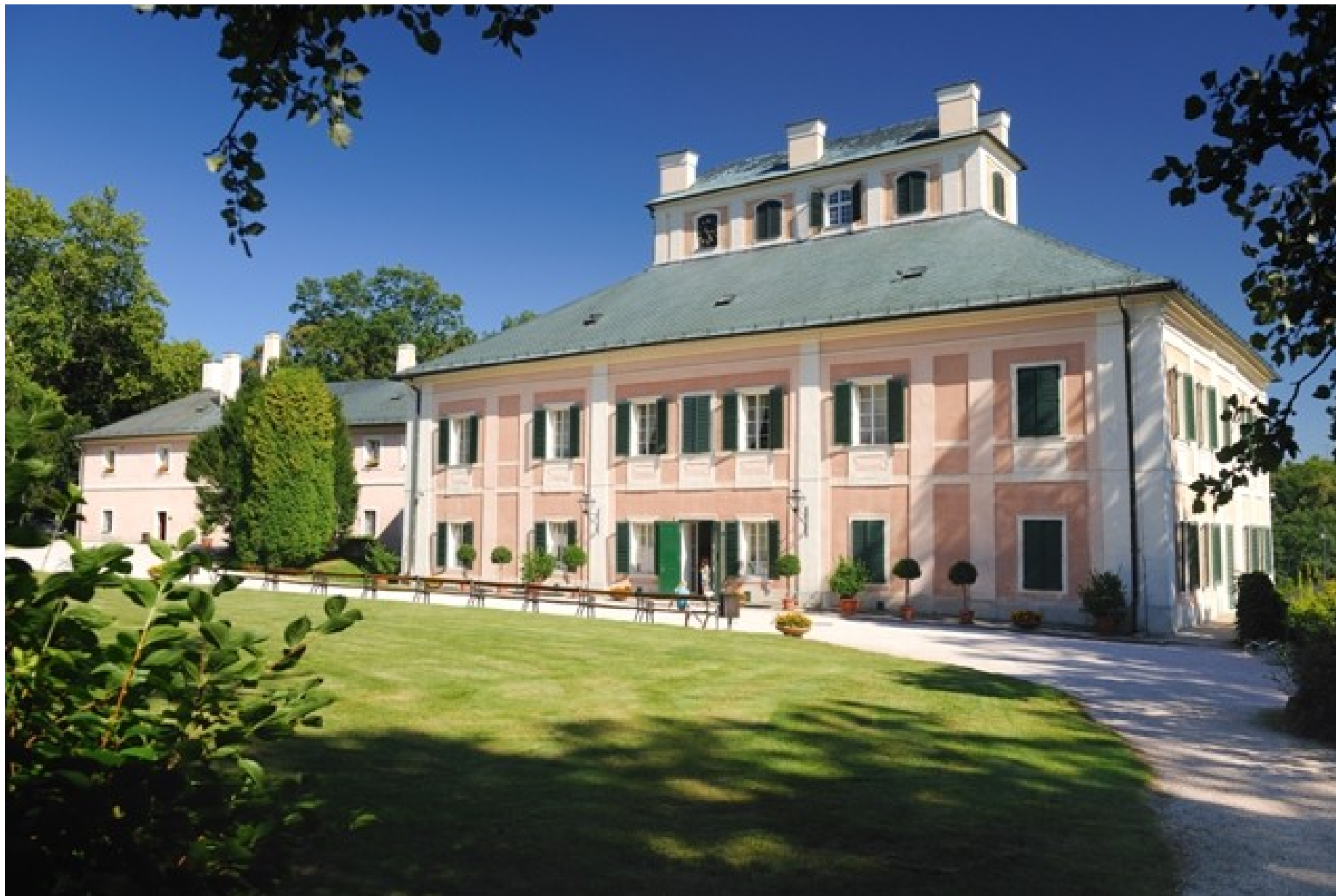
Zámek Chvalkovice nedaleko Ratibořic