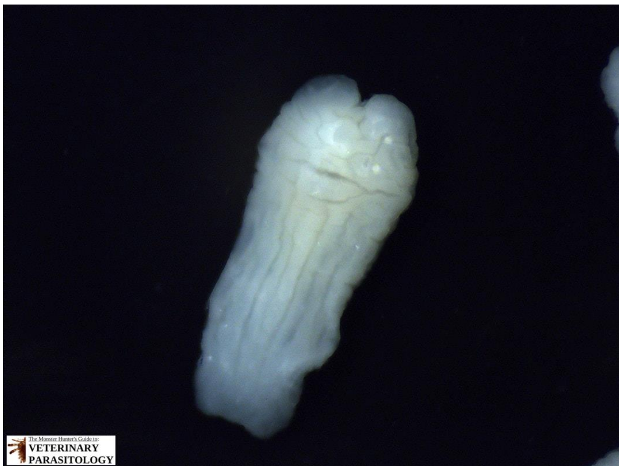
Obr. č. 2. Tetrathyridium tasemnice rodu Mesocoestoides

Psi a kočky mohou sloužit jako náhodní mezihostitelé a infekce se v těchto případech mohou klinicky projevit jako peritoneální larvální cestodóza, méně často známá jako tetrathyridiíza (Boyce et al. 2011; Dahlem et al. 2015).