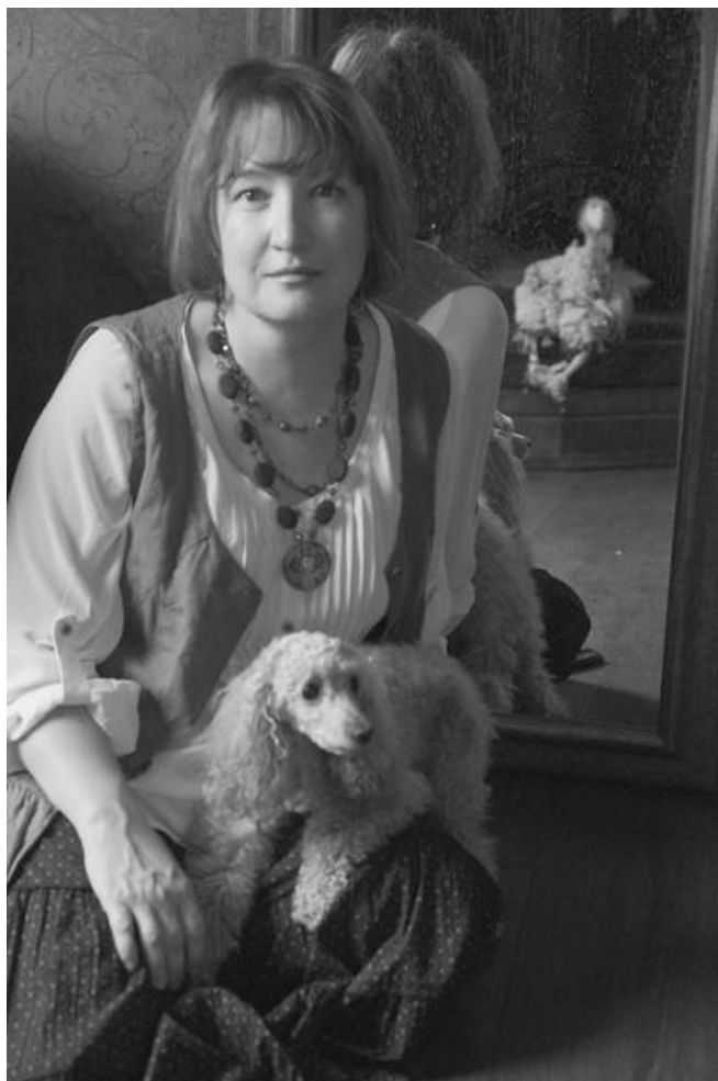
Fotografie Diny Sabitovy