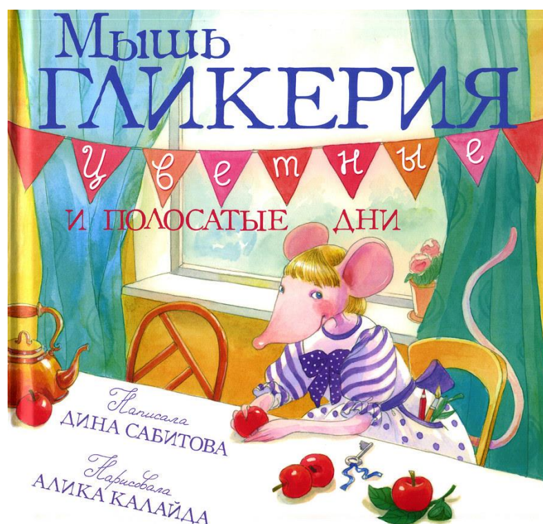
Obrázek 1: obálka knihy