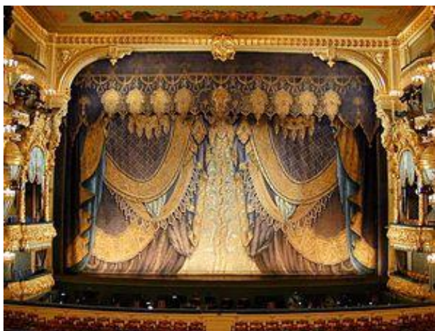
Úchvatná opona v MD

Na začátku 20. století právě v MD poprvé zazněly Čajkovského opery. Zajímavostí je, že na premiéře opery Чародейка a se role dirigenta ujal sám autor. Mezi další autory, jichž díla byla prezentována, patří například: Rimskij-Korsakov a jeho Сказание о невидимом граде Китеже , A. Borodin a jeho Князь Игорь a mnozí další. Z děl evropských skladatelů bylo možné shlédnout například díla Ромео и Джульетта , Кармен , Мефистофель atd.