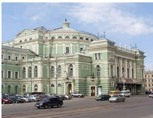
Budova MD zvenčí

V roce 2003 proběhl mezinárodní konkurz na projekt nové budovy, v němž zvítězil francouzský architekt Dominik Perro. Jeho návrh spojil poslední trendy v architektuře s klasikou Petrohradských staveb. 49