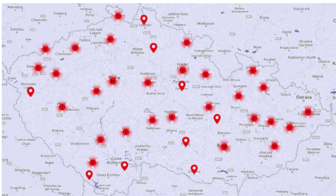
Obrázek 3 Rozložení sociálních podniků v rámci České Republiky.