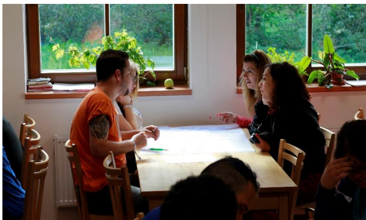
Obrázek 14: Finanční aspekt projektu, plnění úkolů na stanovištích.