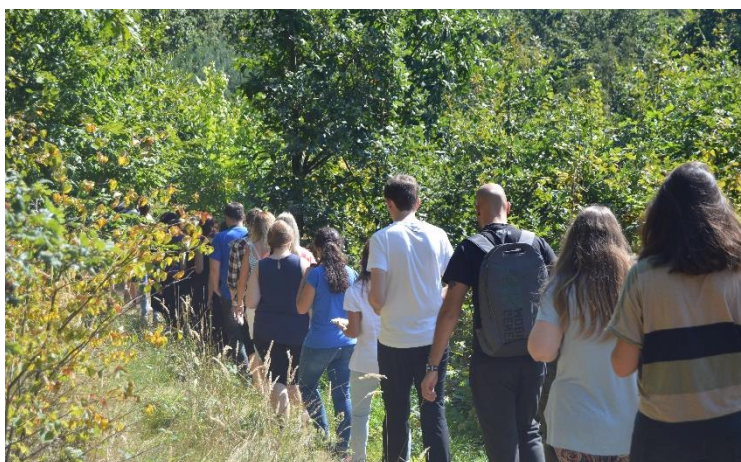
Obrázek 5: Můj postoj ke komunitě, procházka lesní stezkou, zapisování odpovědí na otázky.