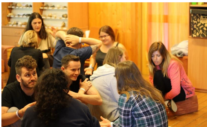
Obrázek 10: Úvod do projektového managementu, vytvořený vnitřní a vnější kruh k diskusi.