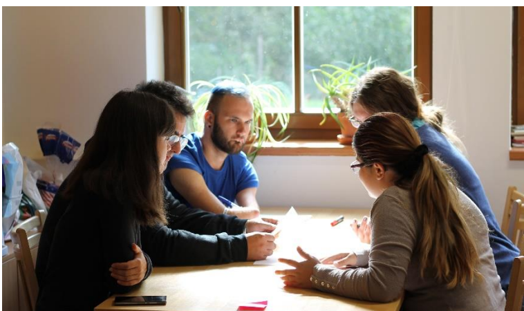
Obrázek 8: Míra kulturních aktivit ve Vaší obci, práce ve skupinách.