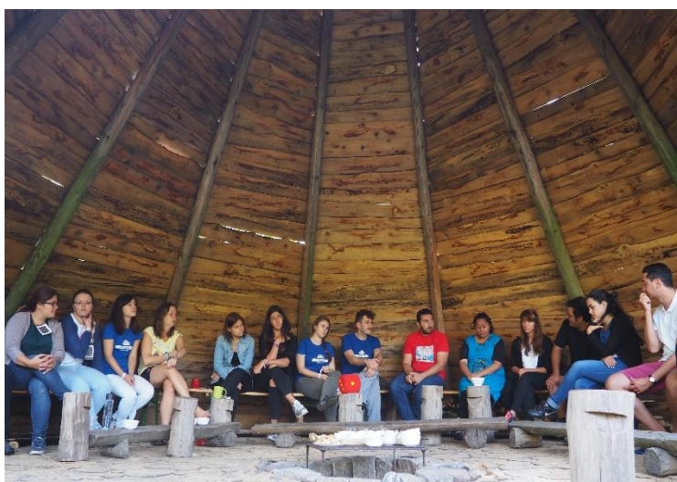
Obrázek 4: Upravená metoda Živé knihovny - závěrečná diskuse společně s návštěvníky Živé knihovny