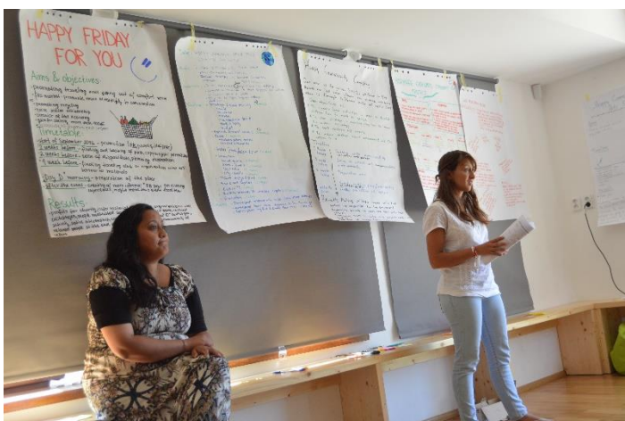
Obrázek 16: Navrhni svůj vlastní projekt v síti Šťastné komunity, prezentace finálních projektů.