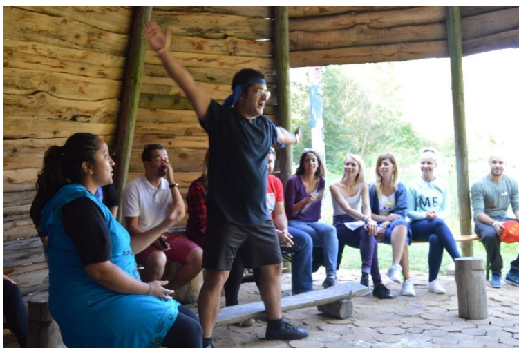
Obrázek 13: Simulace realizační fáze události, hraní divadelní scénky dle obdrženého scénáře.