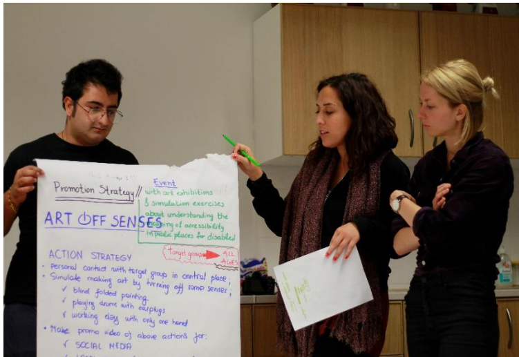
Obrázek 12: Propaguj svoji událost, prezentace propagační strategie případové studie události.