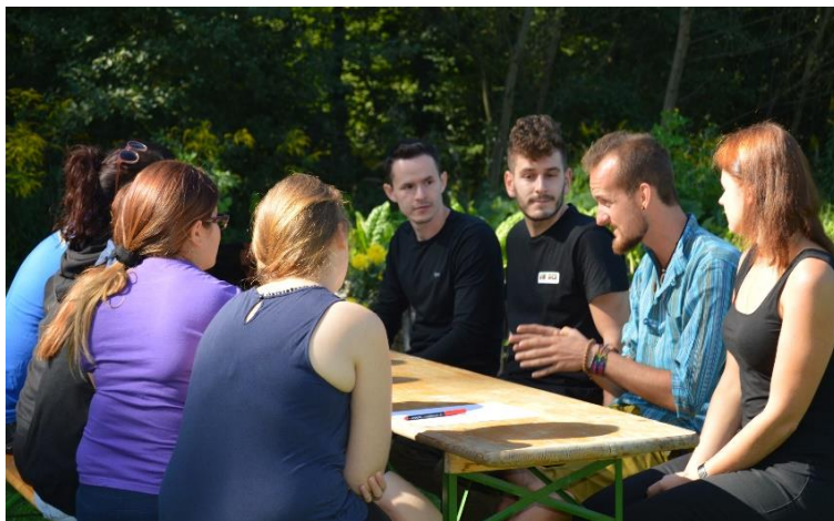
Obrázek 3: Upravená metoda Živé knihovny, pozvaný expert sdílí jeho příběh aktivního občana.