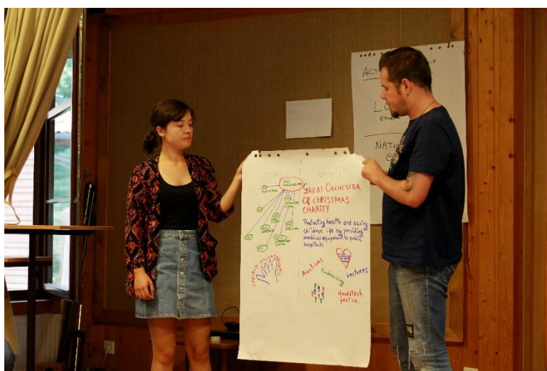
Obrázek 2: Vysvětlení pojmu aktivního občanství, prezentace příkladů aktivního občanství na lokální a národní úrovni.