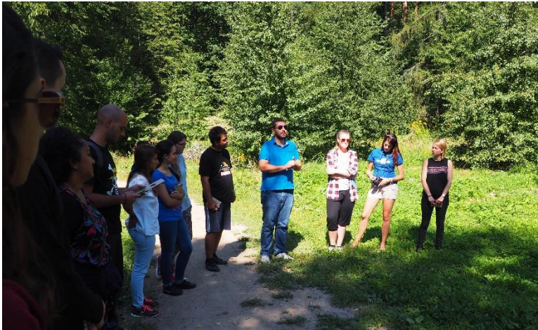
Obrázek 6: Můj postoj ke komunitě. Vytvoření kruhu, kdy účastníkům lektor pokládá další otázku k zamyšlení.