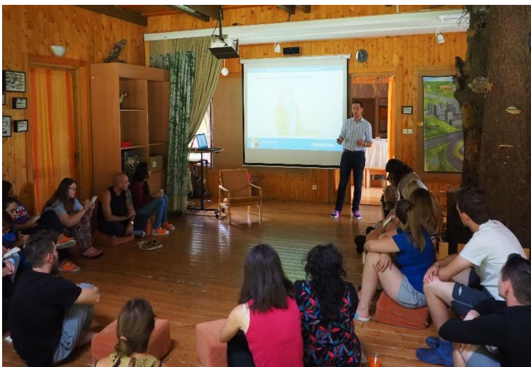
Obrázek 7: Stanovení cílů pro tebe a tvou komunitu, úvodní prezentace.