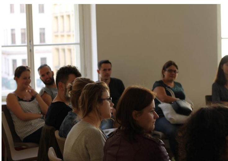
Obrázek 11: Poznej potřeby tvé komunity, vyhodnocení výzkumů v Mahenově knihovně v Brně.