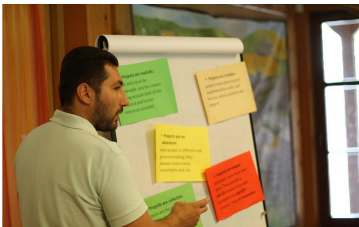
Obrázek 9: Úvod do projektového managementu, školitel umísťuje témata k diskusi.