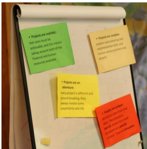
Obrázek 1: Návrh umístění témat k diskusi

bylo viditelné pro všechny. Obrázek níže slouží jako praktická ukázka, jak je vhodné dávat účastníkům nová témata k diskusi.