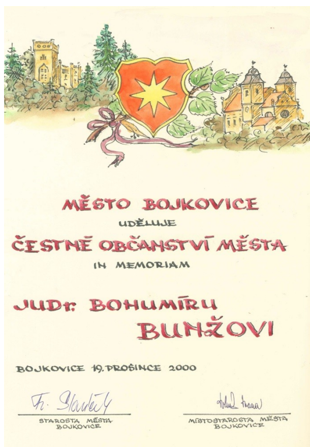
8/ Zápis v pamětní knize města Bojkovice.