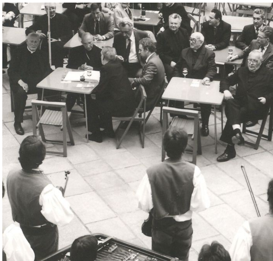
6/ Kardinál František kardinál Tomášek (sedící první zleva) a Agostino kardinál Casaroli (sedící vedle Františka kard. Tomáška) na nádvoří zámku Nový Světlov v Bojkovicích po Národní pouti na Velehradě v roce 1985.