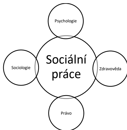
Obrázek 2 Profesionalita sociální práce

takové můžeme označit hlavně psychologii a sociologii, k doplnění praxe nebo teorie slouží například sociální pedagogika nebo andragogika.