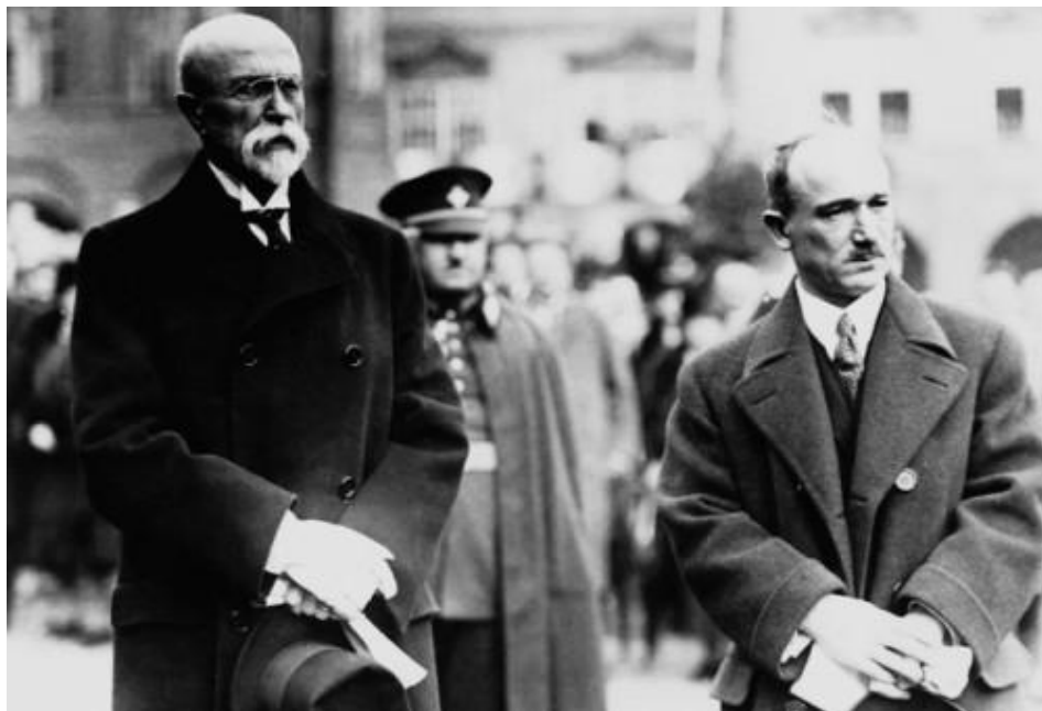
Obrázek 2: Edvard Beneš po boku T. G. Masaryka