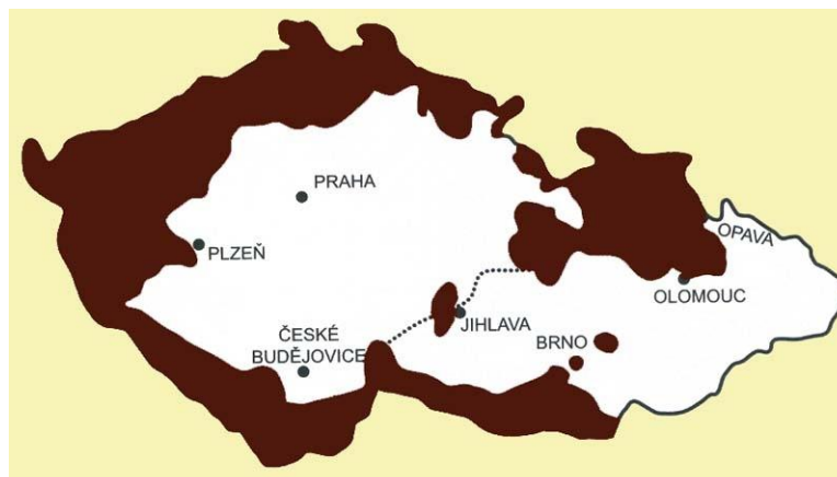
Obrázek 3: Pohraničí českých zemí - Sudety vč. německého osídlení