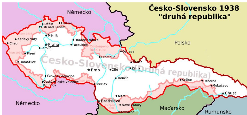
Obrázek 10: Československé území po Mnichovu (říjen 1938 - březen 1939)

Zdroj: ČAPKA, František. Tragédie mnichovské dohody: skutečná fakta a odhalené mýty; osudové okamžiky . 1. Vyd. Brno: Computer Přes, 2011, s. 125. ISBN 978-80-251-3376-7.