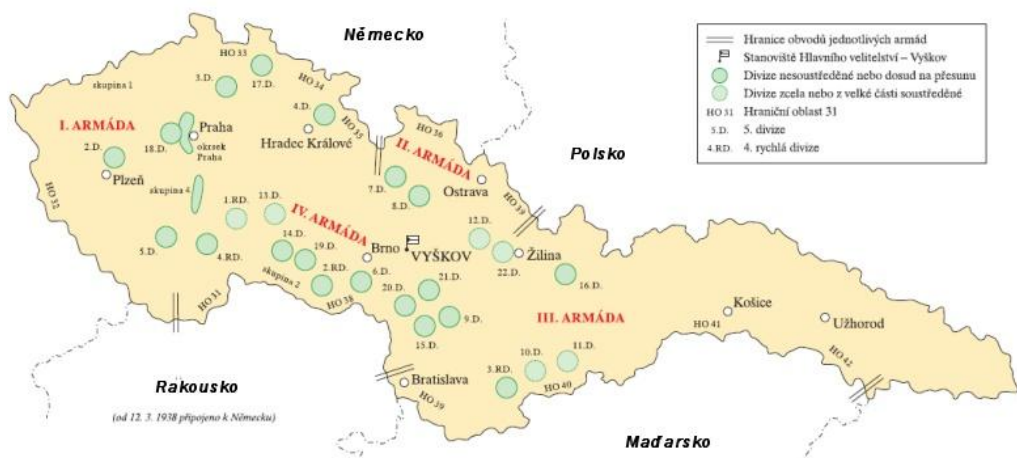
Obrázek 11: Obrana Československa 1938