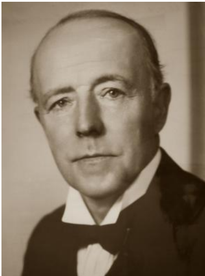
Obrázek 5: Lord Walter Runciman