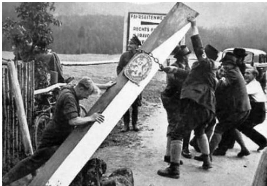
Obrázek 9: Sudetští Němci vyvracejí pohraniční sloup ČSR

Zdroj: ČAPKA, František. Tragédie mnichovské dohody: skutečná fakta a odhalené mýty; osudové okamžiky . 1. Vyd. Brno: Computer Press, 2011, s. 122. ISBN 978-80-251-3376-7.