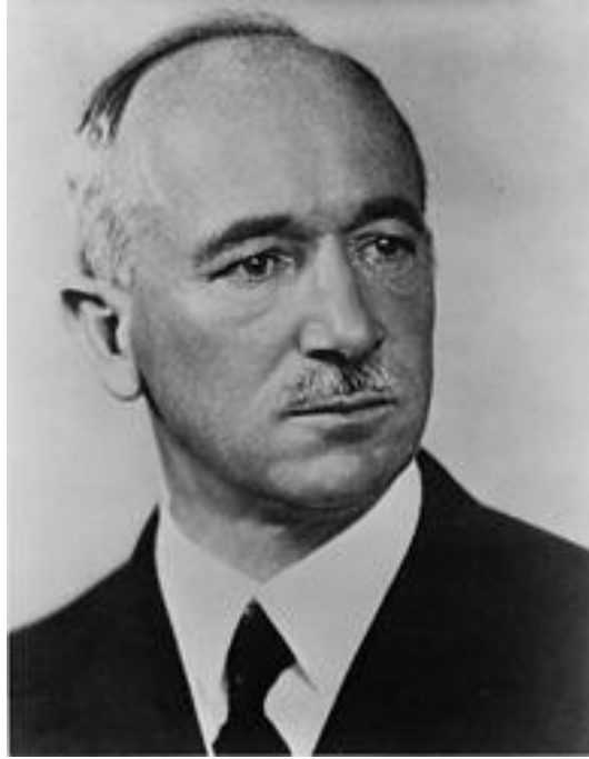
Obrázek 1: Edvard Beneš