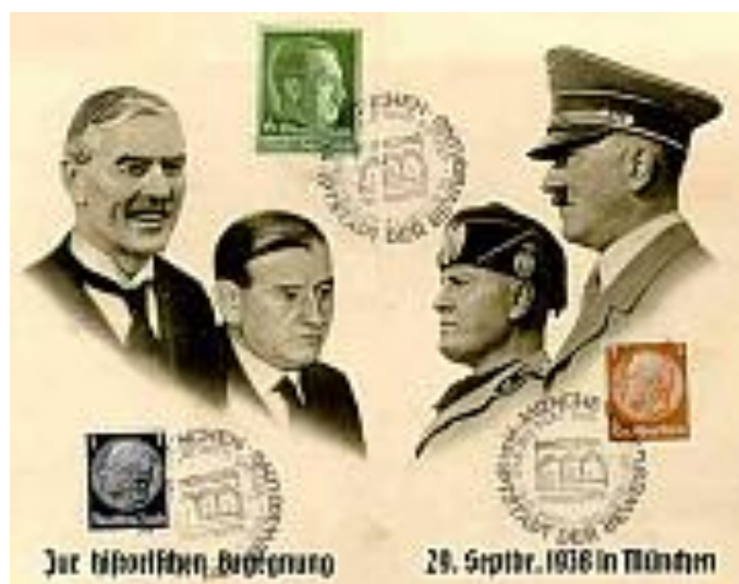
Obrázek 7: Aktéři mnichovského diktátu