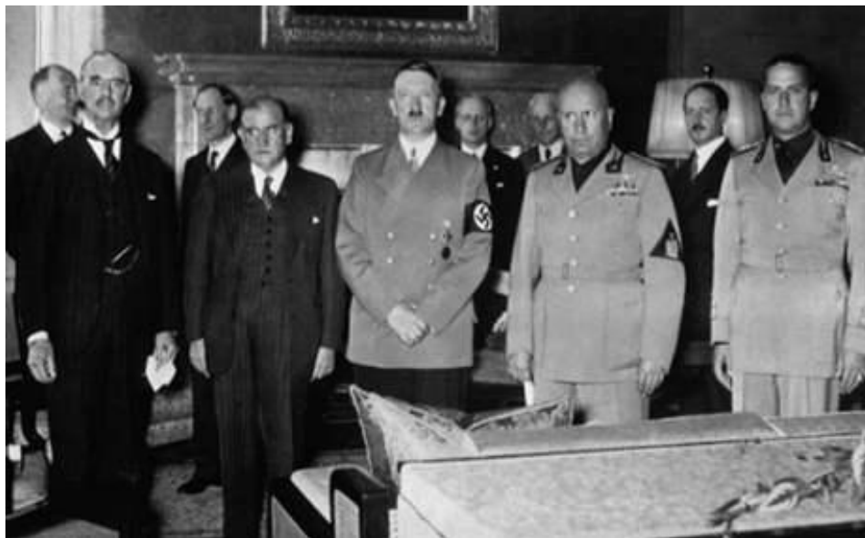
Obrázek 8: Fotografie z průběhu mnichovského jednání