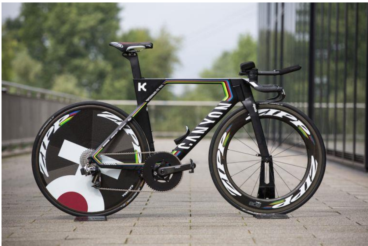
Obrázek 2. Časovkářský speciál alias „koza“ (Cycling Weekly, 2017)