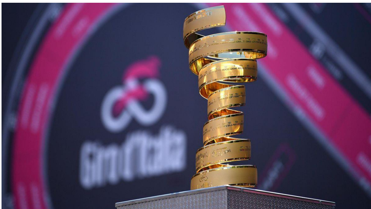
Obrázek 4. Trofeo Senza Fine (pohár pro vítěze celkové klasifikace) a oficiální logo závodu (Eurosport, 2019)