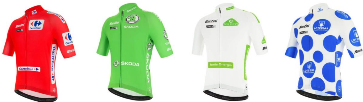
Obrázek 6. Barevné dresy pro vedoucí závodníky hlavních soutěží na Vuelte

Vuelta je ze všech 3 Grand Tour pravděpodobně nejméně mediálně sledovaná a velkolepou Tour, či nevyzpytatelným Girem poněkud zastíněna. Mnoho cyklistů ji má v oblibě pro svou přátelskou a živelnou atmosféru, kterou dokáží španělští pořadatelé a fanoušci navodit.