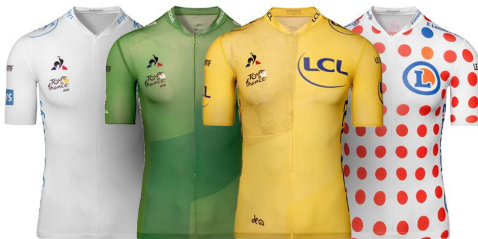
WHITE GREEN YELLOW POLKA-DOT Best placed young rider (under 26) leader of the points classification - rewarding sprinters Lowest cumulative time and overall race lead Leader of the mountains points classification