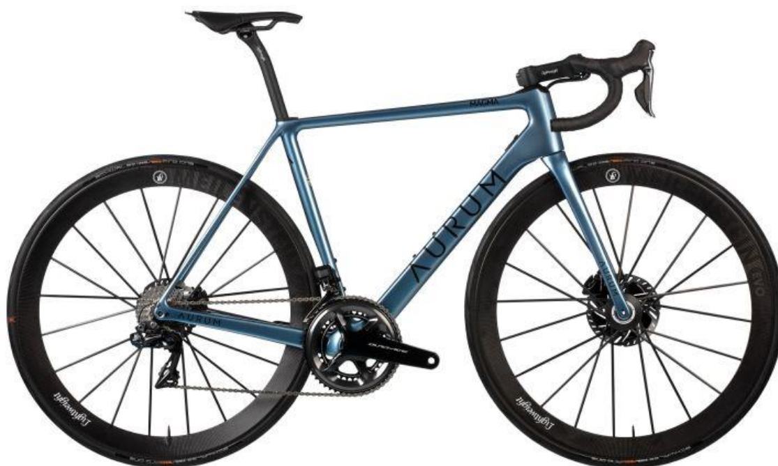
Obrázek 1. Typický vzhled silničního kola (Cycling Weekly, 2020)

„Profesionální cyklistika je výjimečná také tím, že je silně týmovým sportem, přestože to tak na první pohled nemusí vypadat“ (Rebeggiani & Tondani, 2007). I když je týmovost v nejvyšších soutěžích naprosto nepostradatelná, oficiálně se silniční cyklistika řadí mezi sporty individuální a to i z toho důvodu, že v amatérských kategoriích se s týmovou spoluprací setkáme jen minimálně.