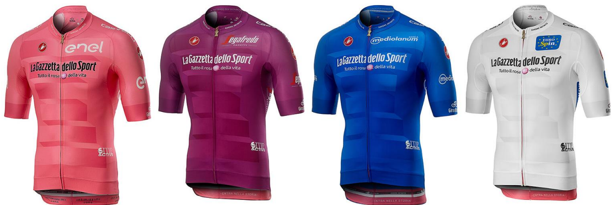
Obrázek 3. Cenné trikoty typické pro Giro d'Italia