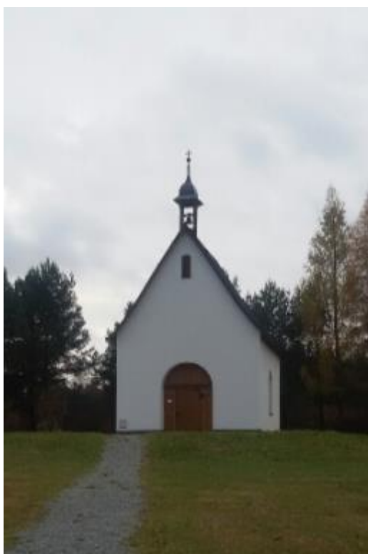
Kaplička „Betlém“ v Rokoli