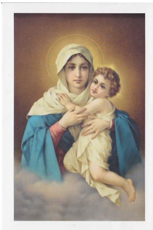
Milostný obraz Matky Třikrát Podivuhodné

Maria, Matko má, Královno, tobě se úplně obětuji. Na důkaz své oddanosti zasvěcuji ti dnes své oči, své uši, svá ústa, své srdce, sebe samého docela. Protože náležím tobě, dobrá Matko, chraň, vychovávej a používej mě. Jsem tvé dítě a tvé vlastnictví. Amen.