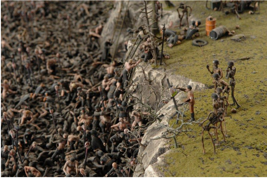
Jake & Dinos Chapman, Fuckin Hell , 2008 detail