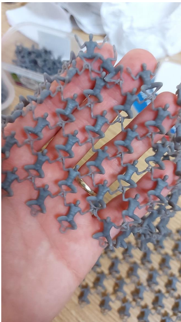
Detail pracovného postupu.