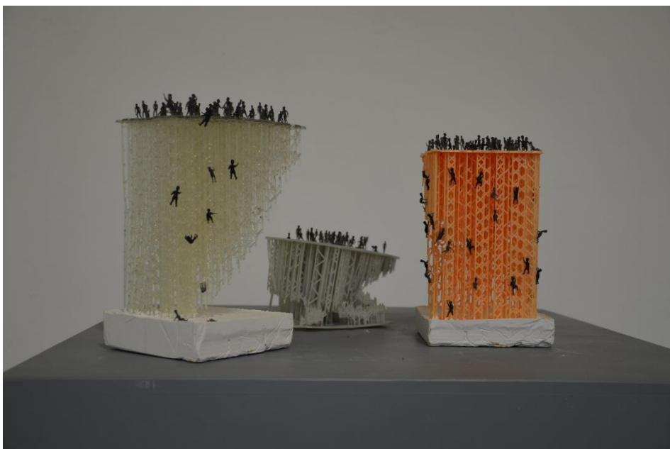
Jakub Matušek, Pracovné modely, polymérová 3D tlač, sadra, 15*15*30 cm 2021