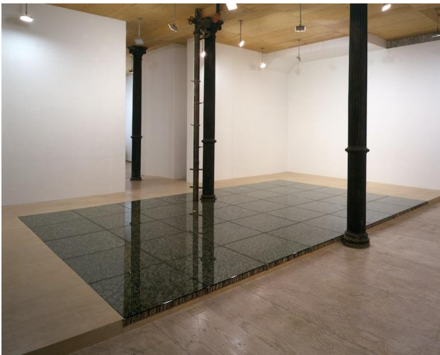
Do Hu Sun, Floor, plast, sklo, 2017