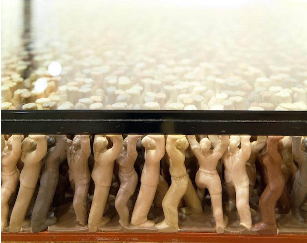
Do Hu Sun, Floor, plast, sklo, 2017