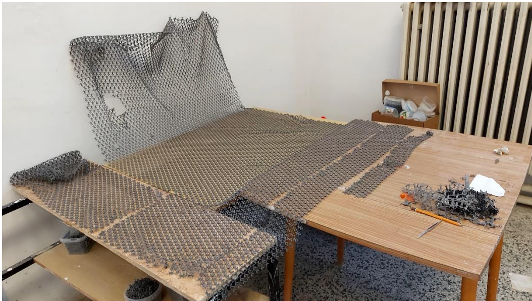
Fotodokumentácia pracovného postupu