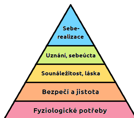
Obrázek 1: Maslowova pyramida potřeb

Maslowova pyramida potřeb je dělí podle toho, s jakou intenzitou na jedince naléhají. Na nejnižší úrovni řeší člověk základní podmínky pro přežití. Vyšší patra nejsou nutná pro přežití, ale přispívají k dlouhodobé spokojenosti a rozvíjí náš osobnostní potenciál. Dosáhnout seberealizaci lze pouze za předpokladu uspokojení nižších potřeb. Mnozí klienti sociální práce žijí většinu svého života naplňováním spodní úrovně své pyramidy. Maslowovu teorii lze využít v individuální práci s klientem, ale lze ji aplikovat i v práci s komunitou. (Schuringa, 2007)