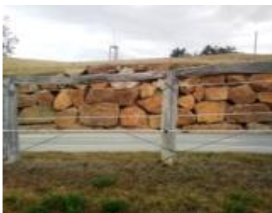
Obrázek č. 6: Dřevěný ohradník golfového areálu