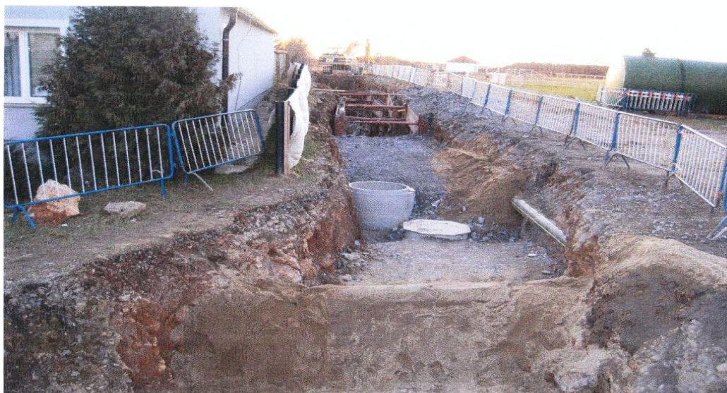
Obrázek č. 3: Výkopové práce na severní straně domu Nekolových

Prosím o informaci alespoň 2 dny před přiblížením k objektu Nekolových. Po dokončení bude vydána zpráva. K provedení byla doporučena firma INSET s.r.o.