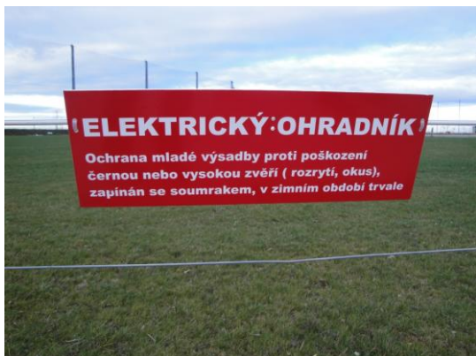
Obrázek č. 5: Elektrický ohradník golfového areálu