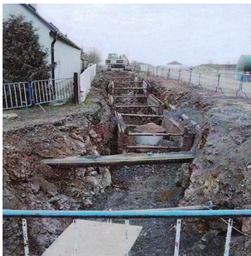
Obrázek č. 4: Dům manželů Nekolových - výkop zasahující i k přední části domu

Současně si dovoluujeme požádat o spolupráci a umožnit přístup do objektu pro následující činnosti dle návrhu Ing. Františka Čermáka (technologický postup z 24. 8. 2007), který bude dohlížet na postup prováděných prací a stav objektu.