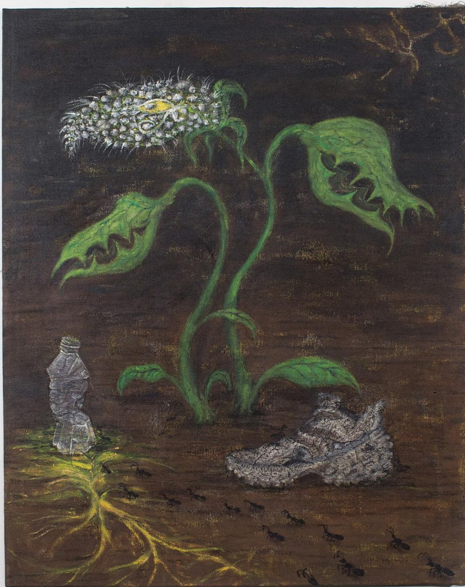
A Still Life With Ants, Mycelium, Balenciaga Defender and Carnivorous Plant akryl a olej na plátně, 90 × 70 cm, 2023