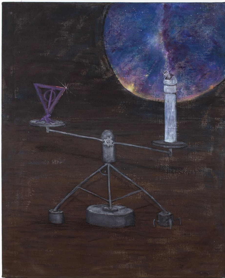
The Ivory Tower , akryl na plátně, 90 × 70 cm, 2023