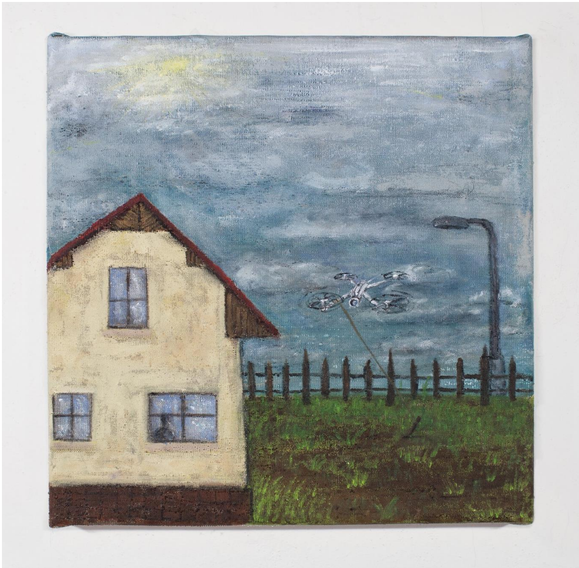
Keep your curious drone tied as you would your mad dog, akryl na plátně, 50 × 50 cm, 2023