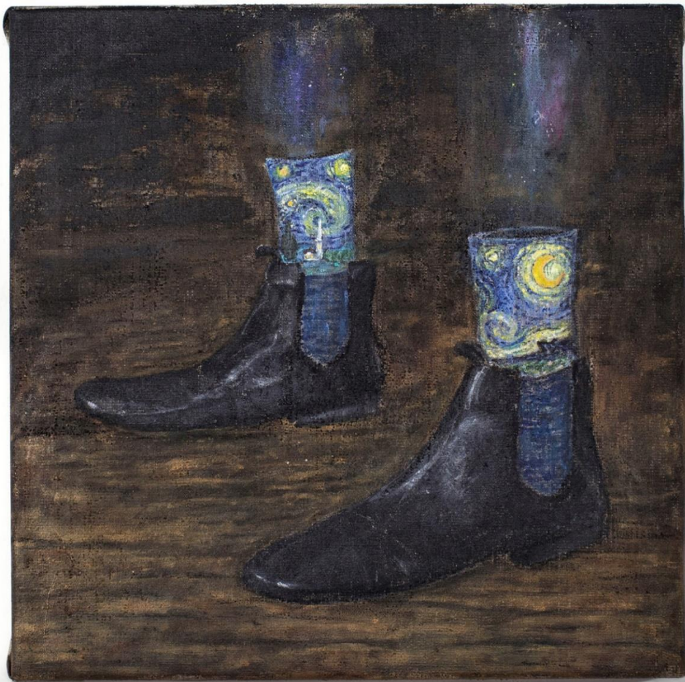
Rethinking Magic , akryl na plátně, 50 × 50 cm, 2023