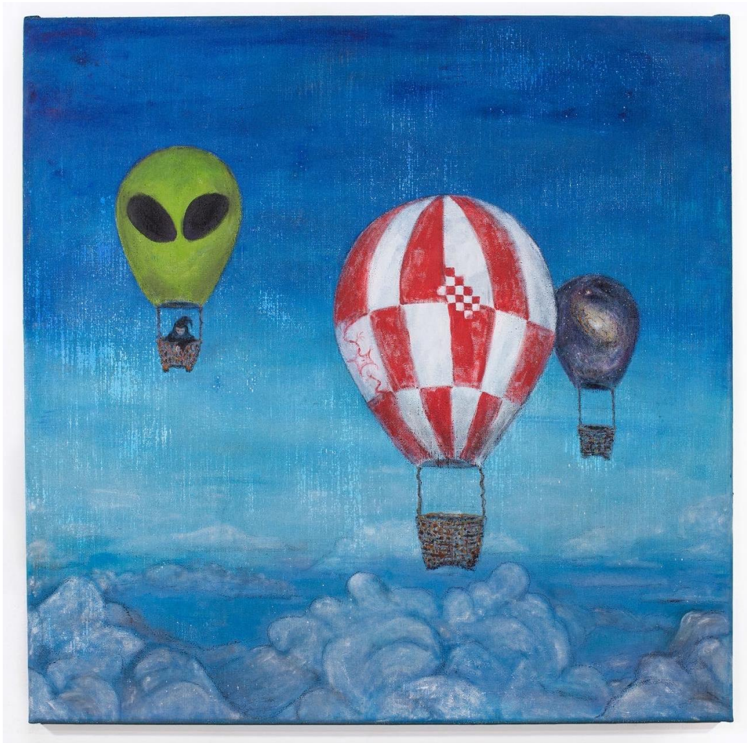
Three Balloons , akryl na plátně, 100 × 100 cm, 2023