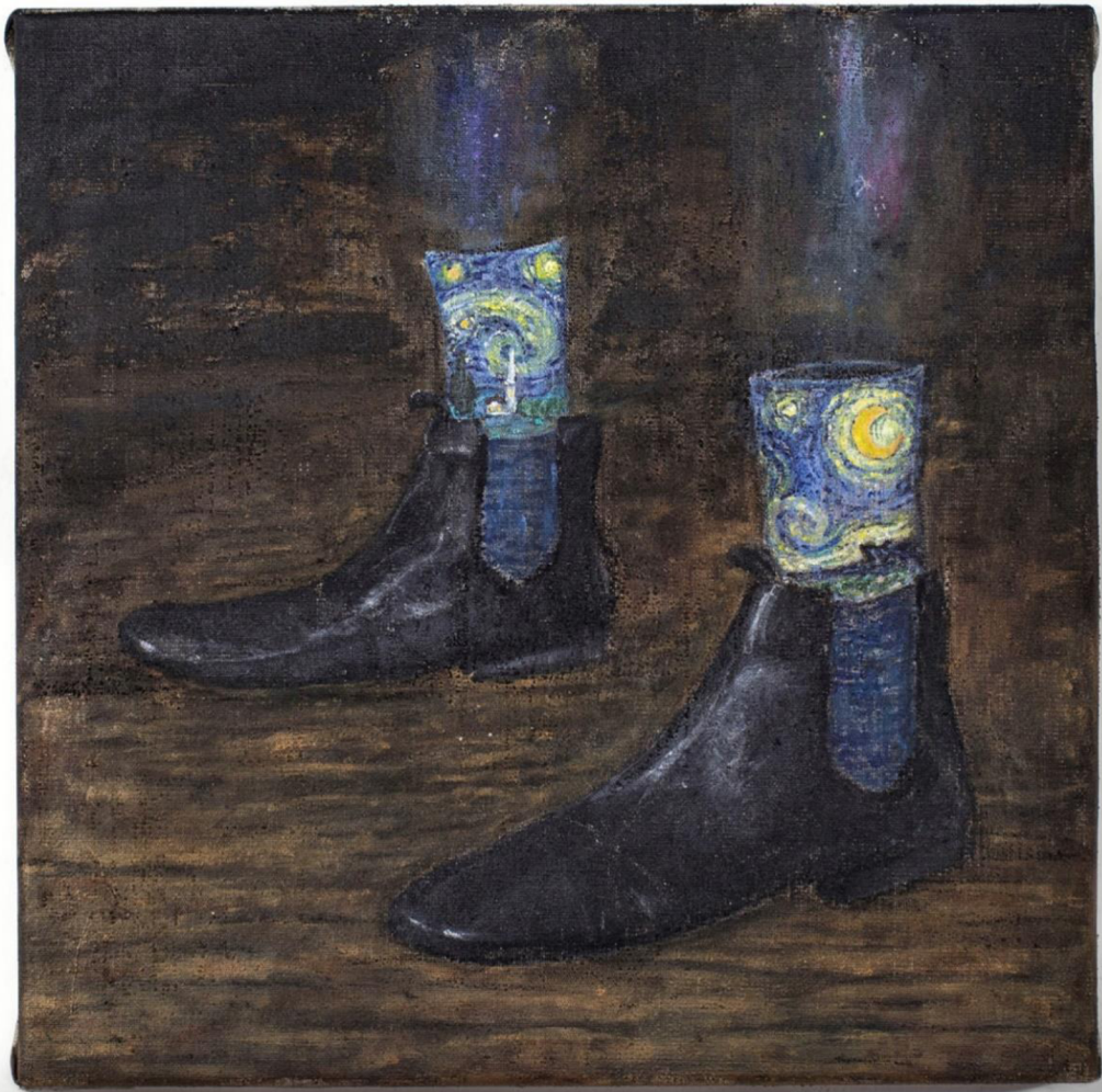
Rethinking Magic , akryl na plátně, 50 × 50 cm, 2023