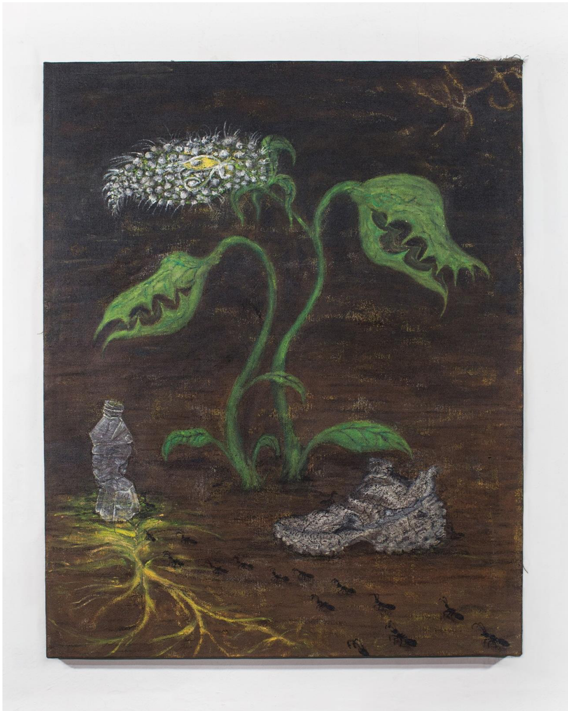
A Still Life With Ants, Mycelium, Balenciaga Defender and Carnivorous Plant akryl a olej na plátně, 90 × 70 cm, 2023