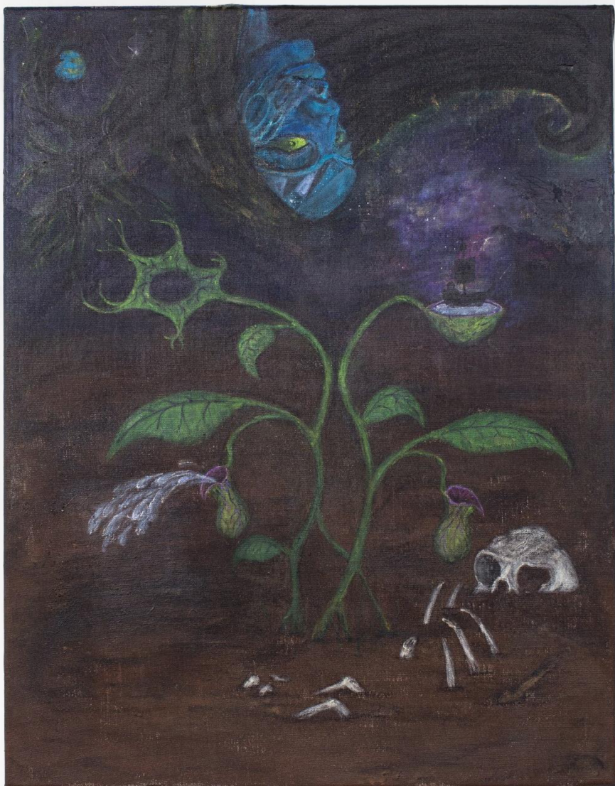
My body's not a temple, It is a vessel , akryl na plátně, 90 × 70 cm, 2023