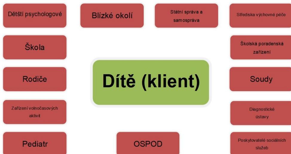
Schéma č. 1 (vlastní zpracování)