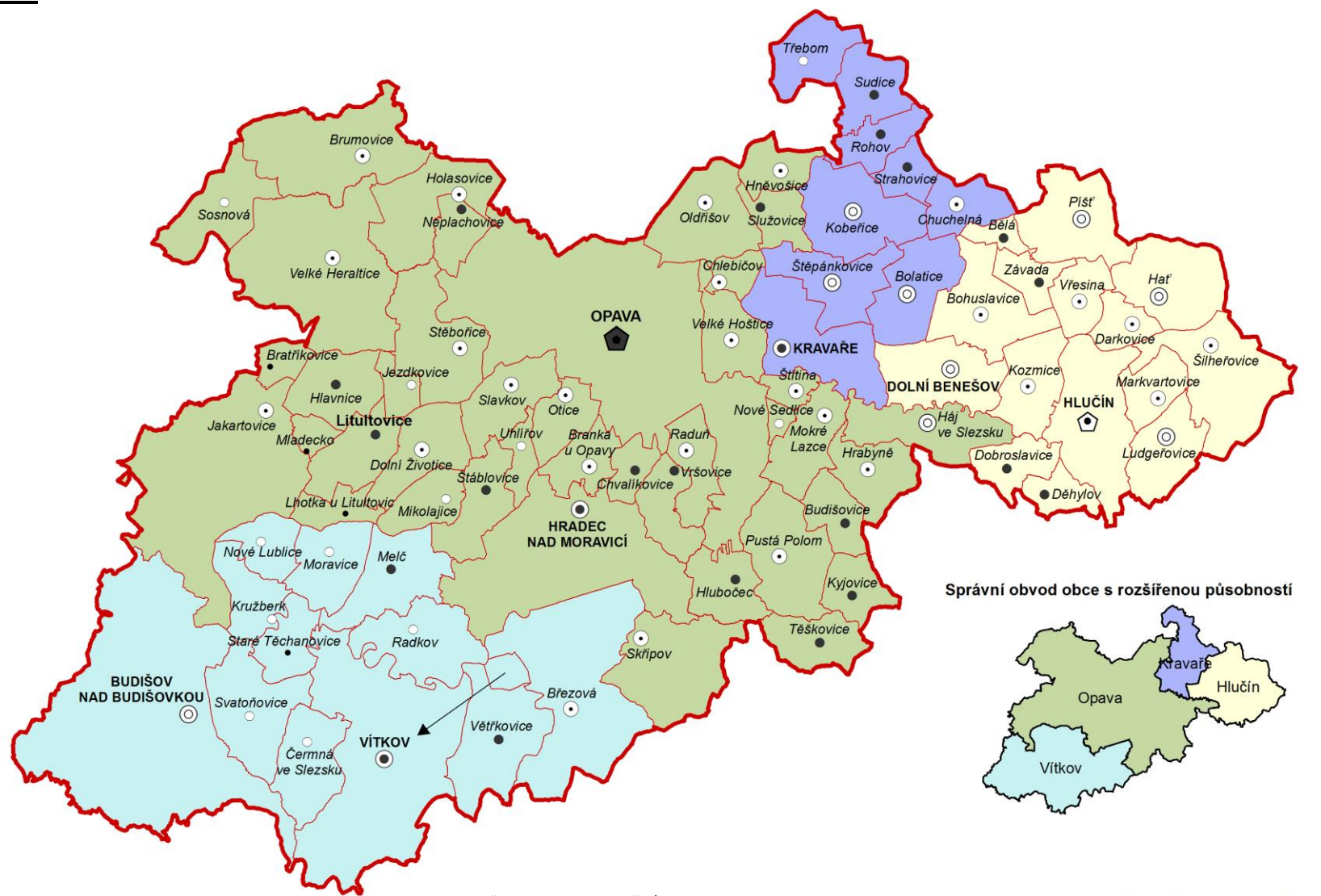
Správní obvod obce s rozšířenou působností