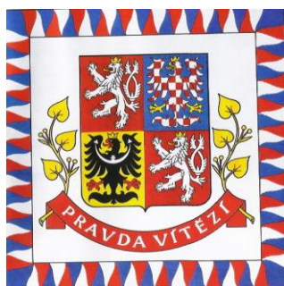
Obrázek 9: Vlajka prezidenta České republiky