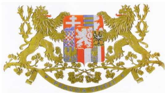
Obrázek 3: Velký znak Československé republiky z roku 1920