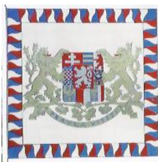
Obrázek 8: Vlajka prezidenta Československé republiky z roku 1920 (Flag of the President of the Czechoslovak Republic of 1920)