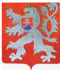
Obrázek 6: Malý znak Československé republiky z roku 1920