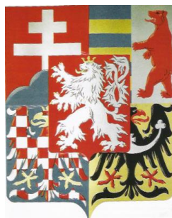
Obrázek 4: Střední znak Československé republiky z roku 1920