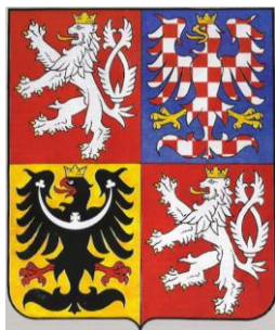
Obrázek 5: Velký státní znak České republiky