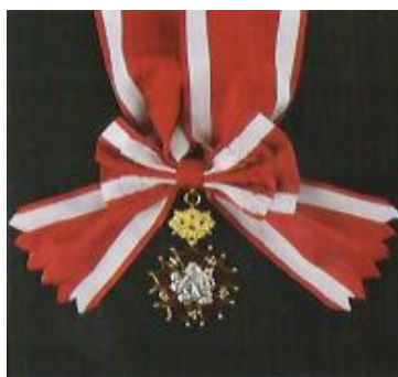
Obrázek 10: Řád bílého lva, velkostuha a klenoty I. třídy občanské skupiny.