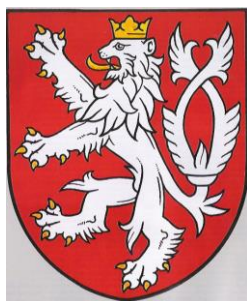
Obrázek 7: Malý znak České republiky (Small Emblem of the Czech Republic)