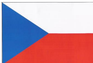
Obrázek 2: Státní vlajka České republiky