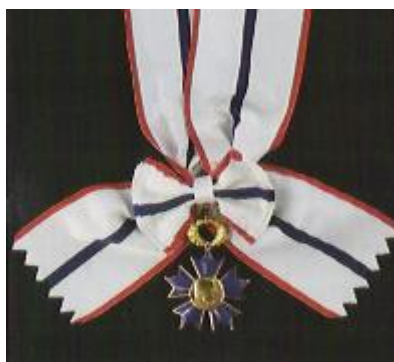
Obrázek 11: Řád Tomáše Garrigua Masaryka, velkostuha a klenot I. třídy.