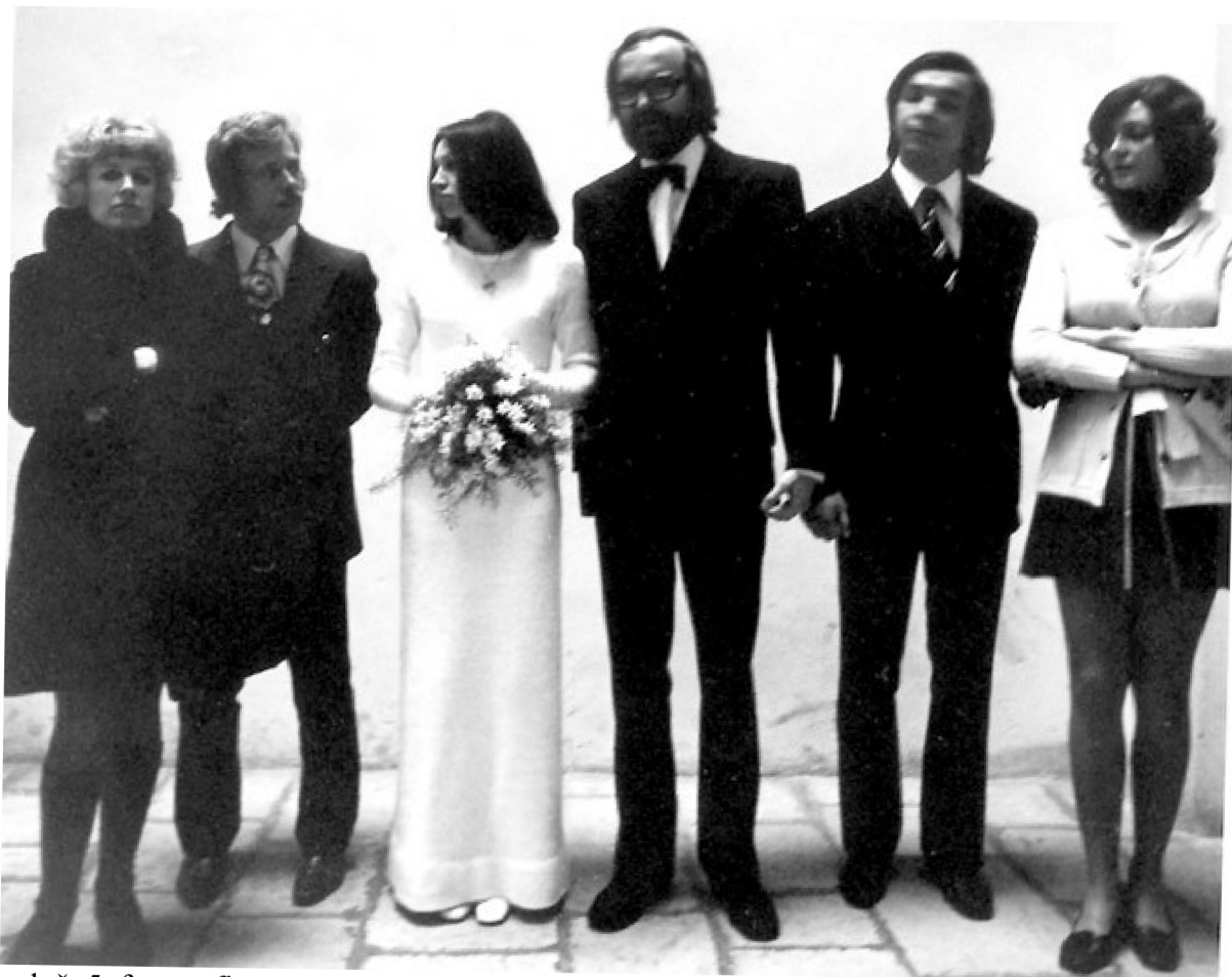
Obrázek č. 5: fotografie ze svatby Marty Kubišové s Janem Moravcem, rok 1974, zdroj: fotogalerie webu kubisova.cz [online], [vid. 15. 9. 2021] https://www.kubisova.cz/fotogalerie/1971-1988.html .