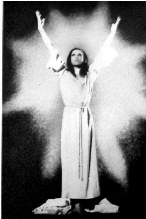
Obrázek č. 3: Modlitba pro Martu v pořadu Gramohit 1968, zdroj: biografie zpěvačky na webu kubisova.cz [online], [vid. 15. 9. 2021] https://www.kubisova.cz/biografie/1967-1970.html .