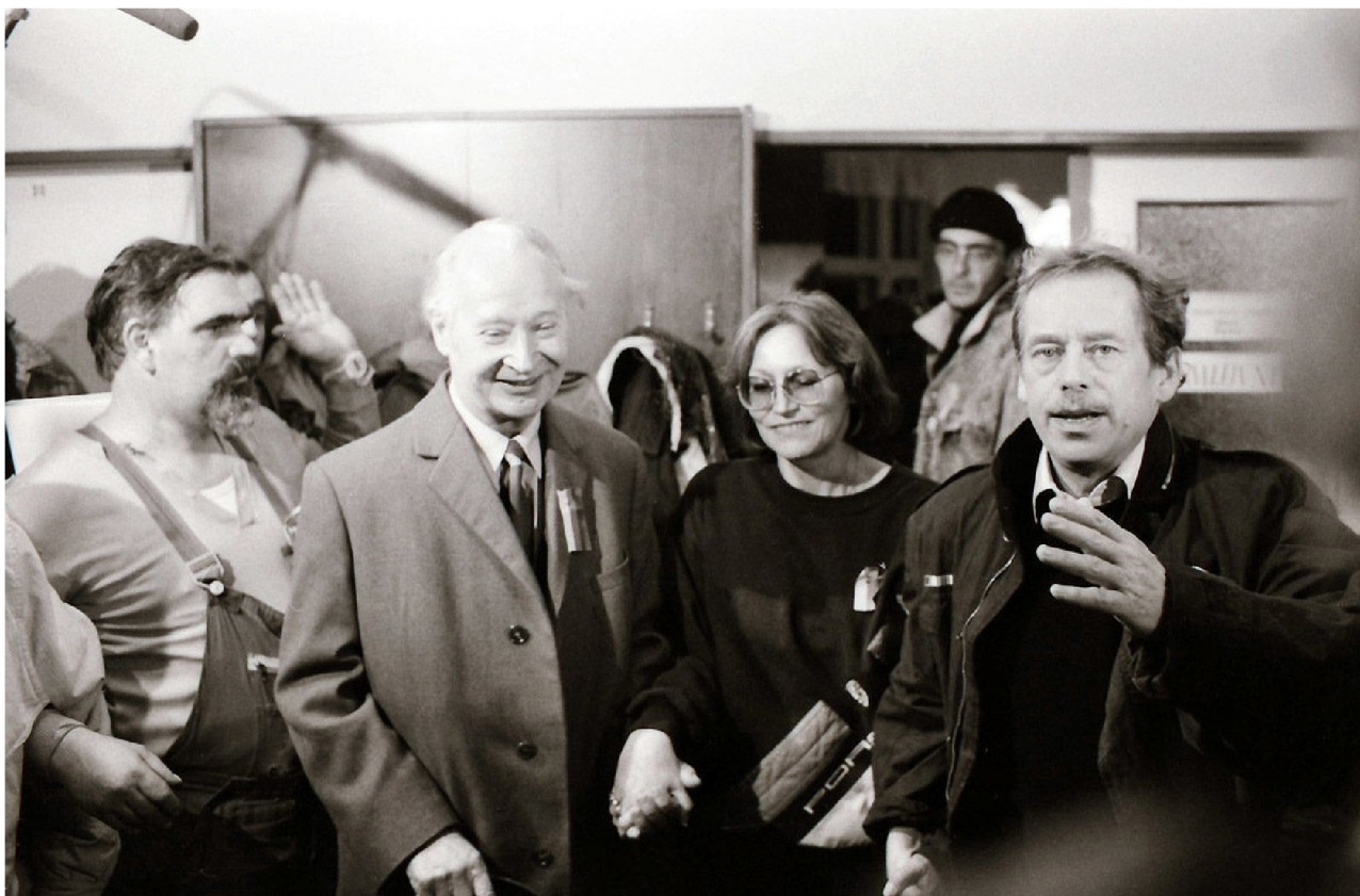
Obrázek č. 6: 1989