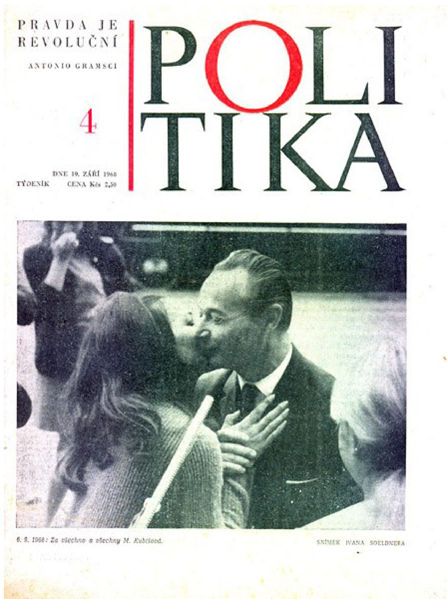
Obrázek č. 4: Týdeník Politika číslo 4, rok 1968.