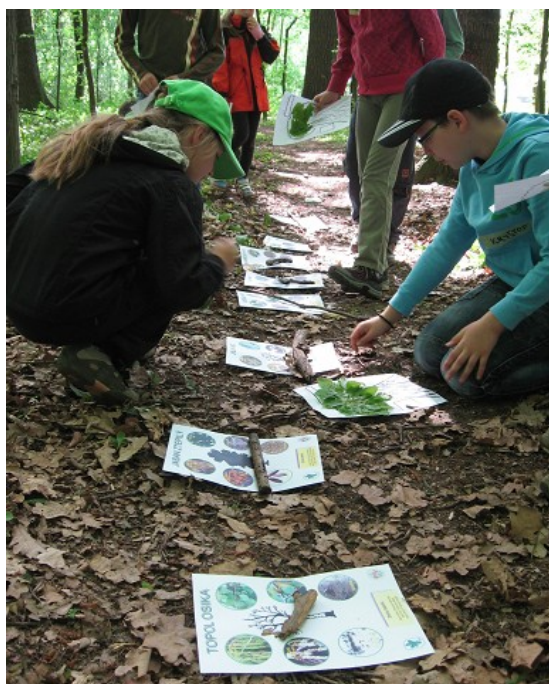
Obr. č. 6 – Určení druhu dřeviny dle atlasu