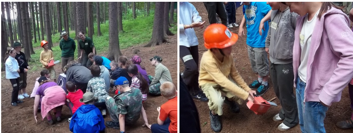
Obr. č. 13 – Lesník, dřevorubec, mladé stromky Obr. č. 14 – Dřevorubec provádějící těžbu