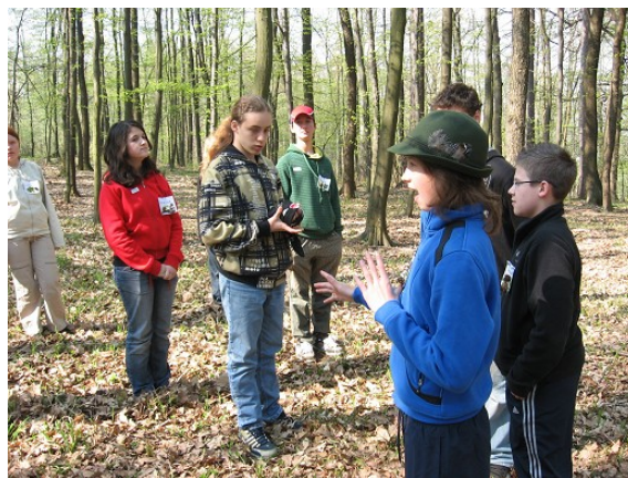
Obr. č. 12 – Zalesňování dřevin (smíšení)