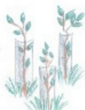
ochrana před zvěří