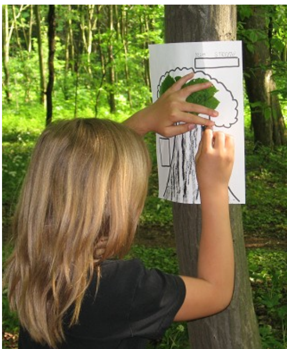
Obr. č. 5 – Frotáž kůry