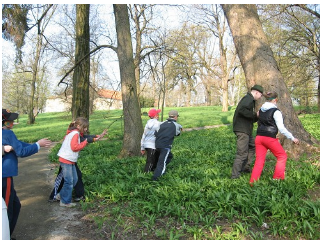
Obr. č. 3 – Najdi svůj strom – vedení