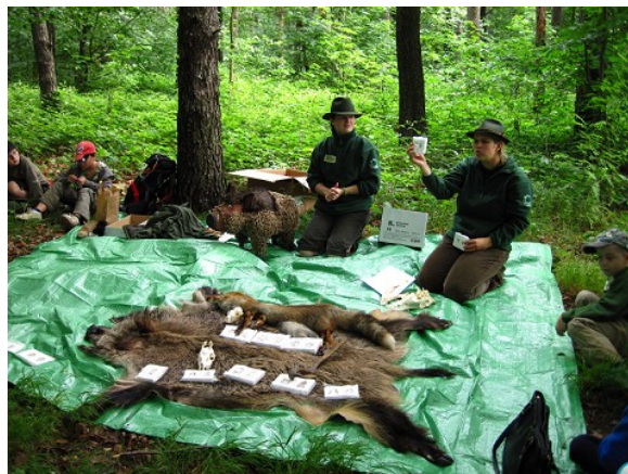
Obr. č. 2 – Úvodní kruh s tématem lesní zvěře