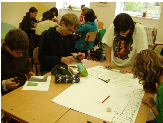
Obr. č. 19 – Práce ve skupině

Jednou z vhodných forem další práce ve školní třídě navazujících na výše navržený program „Život lesa a práce lesníka“ je grafické zpracování plakátů na zadaná témata. Žáci pracují ve skupinkách. Vlastní obsah plakátů vytváří nejrůznějšími technikami – kreslení, psaní textů, vlepování obrázků a přírodnin, nejlépe však materiálů, které si donesli přímo z lesní vycházky. Vhodná témata jsou například těžba dřeva a výchova lesních porostů. Rozhodnutí, zda se bude s poznatky získanými lesní vycházkou s lesníkem ve škole dále pracovat a jakou formou, záleží již jen na učiteli.