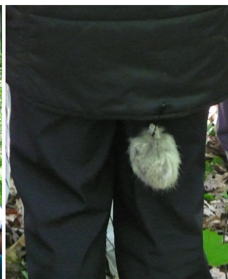
Obr. č. 8 – Zaječí král