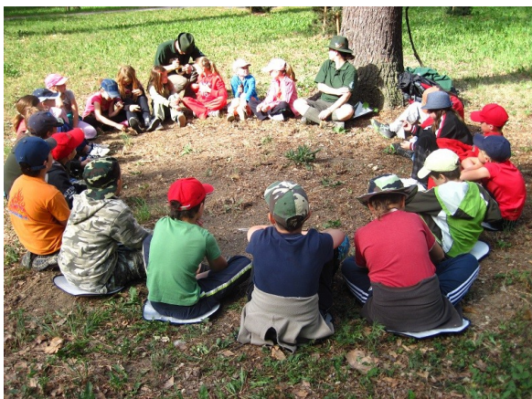
Obr. č. 1 – Úvodní kruh