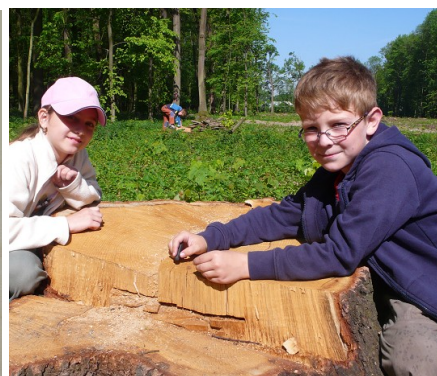
Obr. č. 16 – Počítání letokruhů