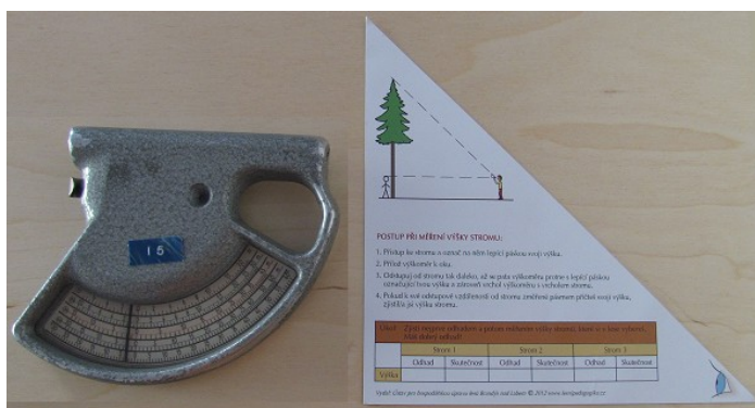
Obr. č. 15 – Výškoměry (mechanický, papírový)