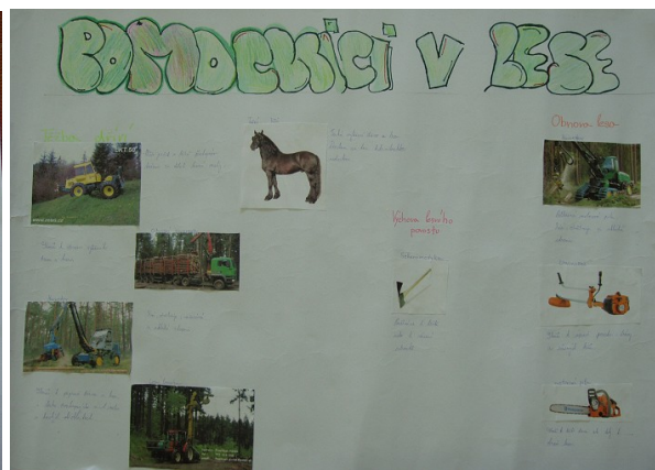
Obr. č. 22 – Plakát s pomocníky lesníka