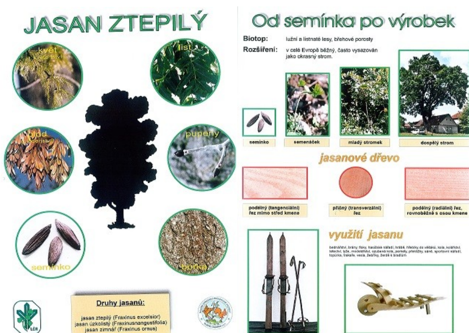
Obr. č. 9 – Ukázka listu ze sbírky „Od semínka po výrobek“