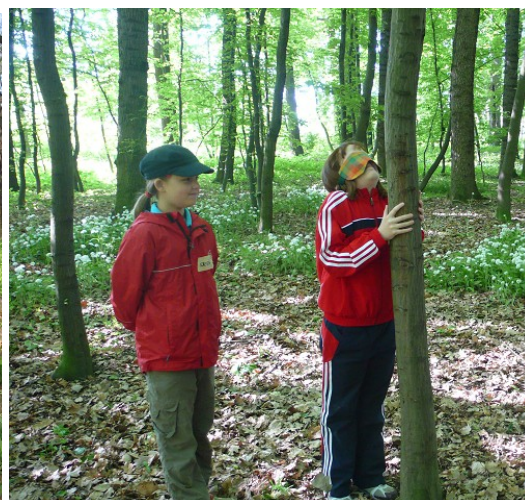
Obr. č. 4 – Najdi svůj strom – prohlížení