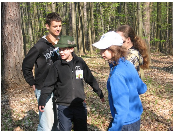
Obr. č. 11 – Lesník vybírá sazenice