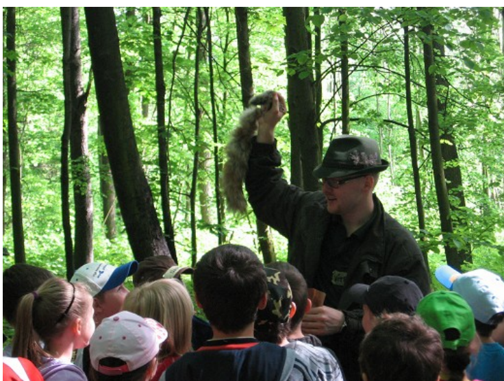
Obr. č. 7 – Výběr lišky