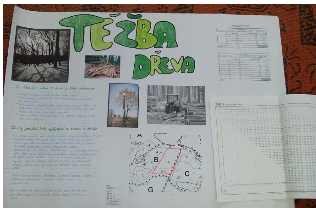
Obr. č. 20 – Plakát s tématem lesní těžby