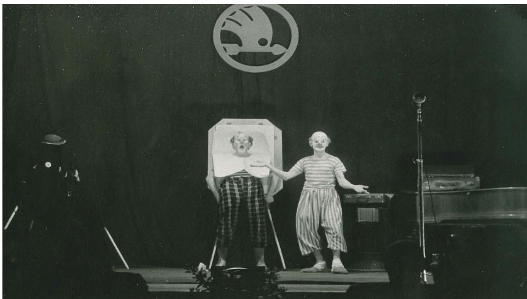
Fotografie z blíže neupřesněného zábavního večera pořádaného v ASAPu, pravděpodobně rok 1944 či 1945.