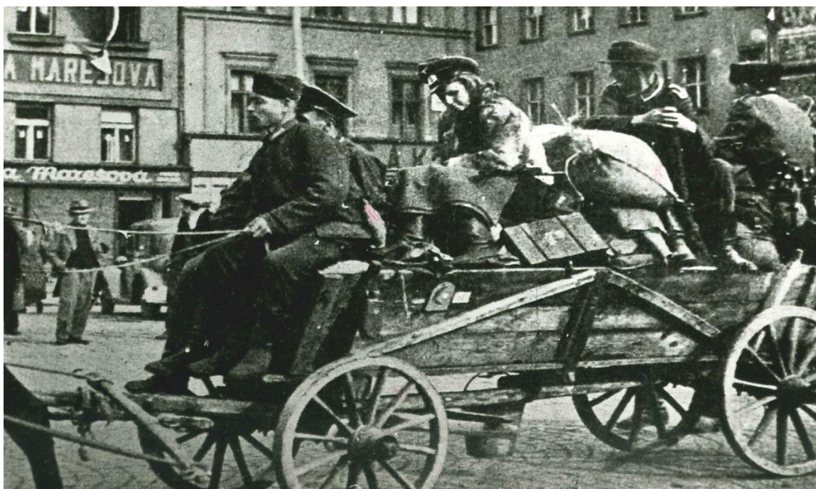
Odjezd německých jednotek z Mladé Boleslavi (Nové město), květen 1945.