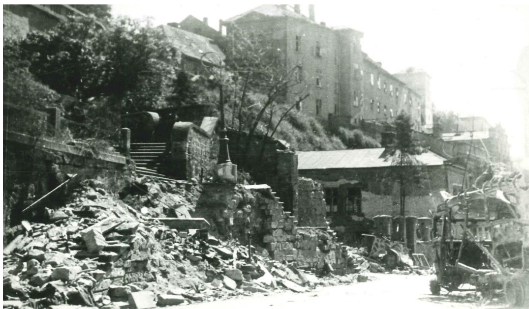
Schody u Ptáčekovy třídy po náletu, včetně zasaženého autobusu s prchajícími Němci, 9. květen 1945.