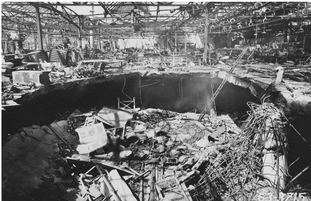
Následky náletu v areálu ASAPu, zasažená montážní hala, 9. květen 1945.