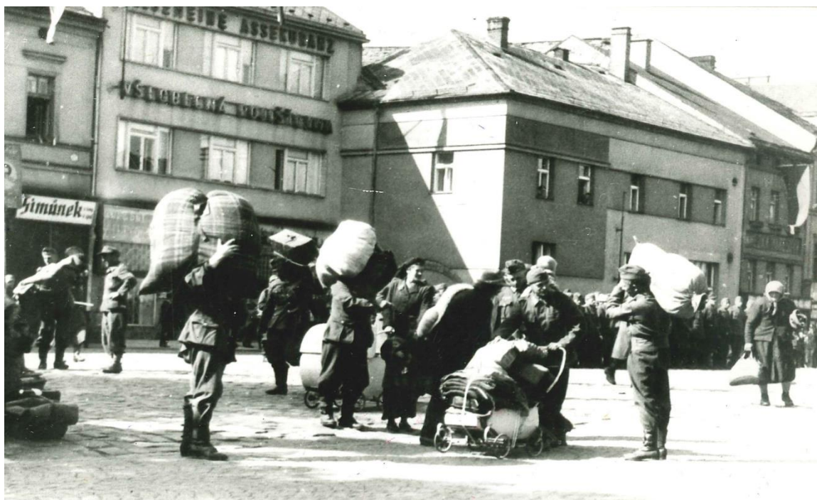
Odchod tzv. národních hostů ze Staroměstského náměstí v Mladé Boleslavi, 9. květen 1945.