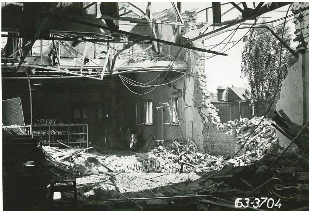
Následky náletu v areálu ASAPu, 9. květen 1945.