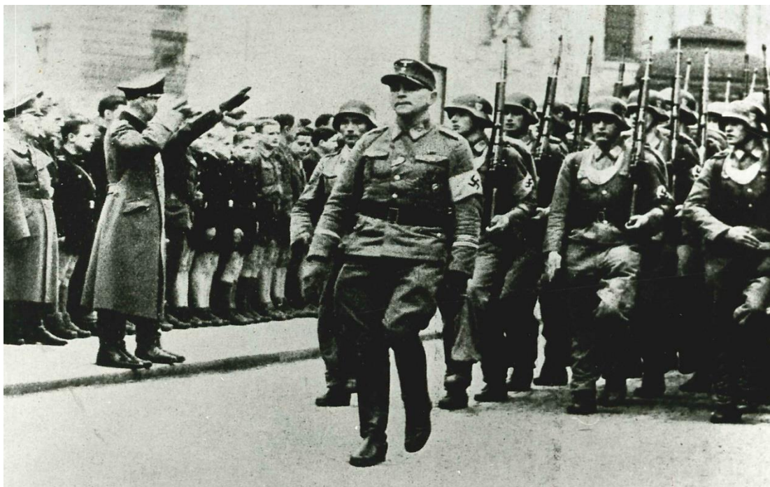
Německá vojenská přehlídka na novoměstském náměstí v Mladé Boleslavi, 1944.