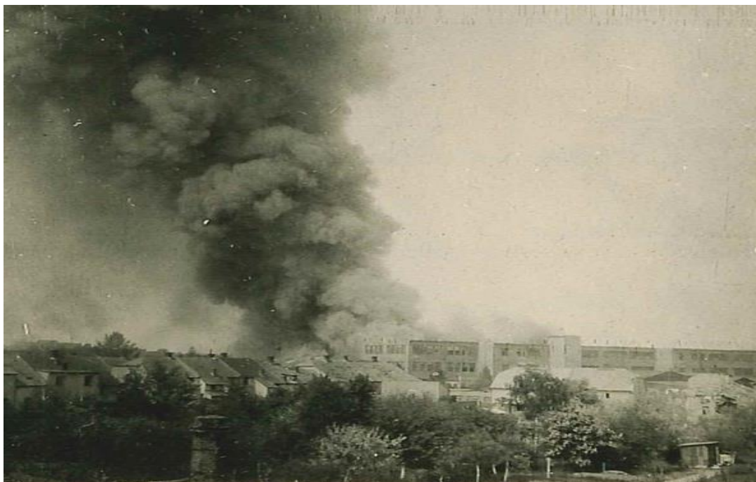
Požár v areálu ASAPu způsobený náletem, z domu č. p. 645/57 v Žižkově ulici, 9. květen 1945.