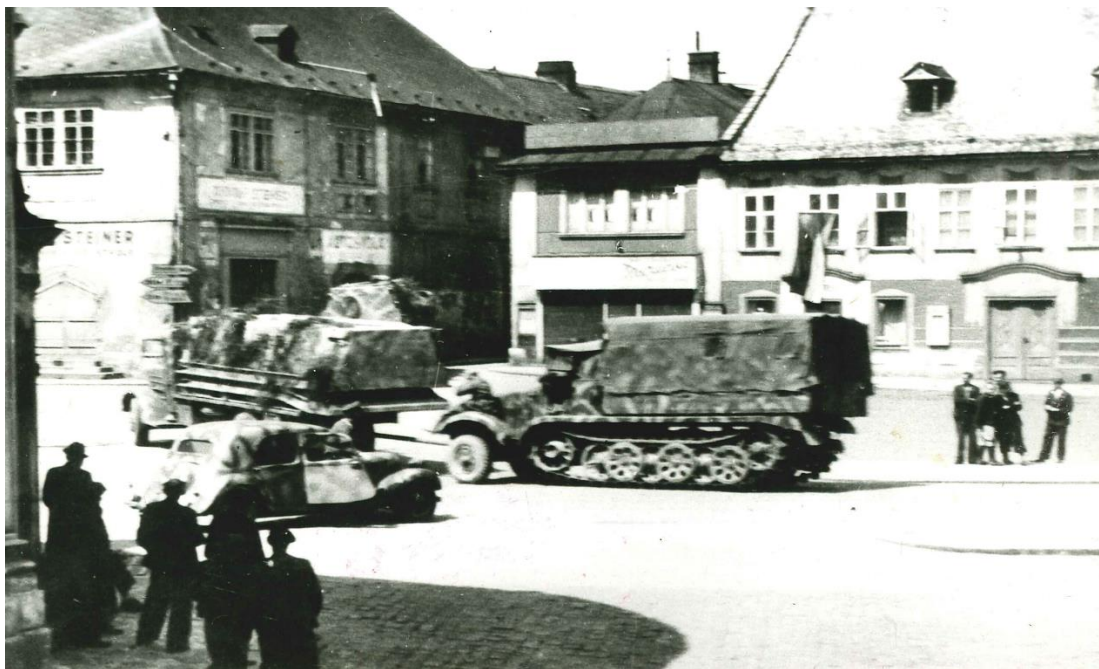
Odjezd německých jednotek z Mladé Boleslavi (Staré město), květen 1945.