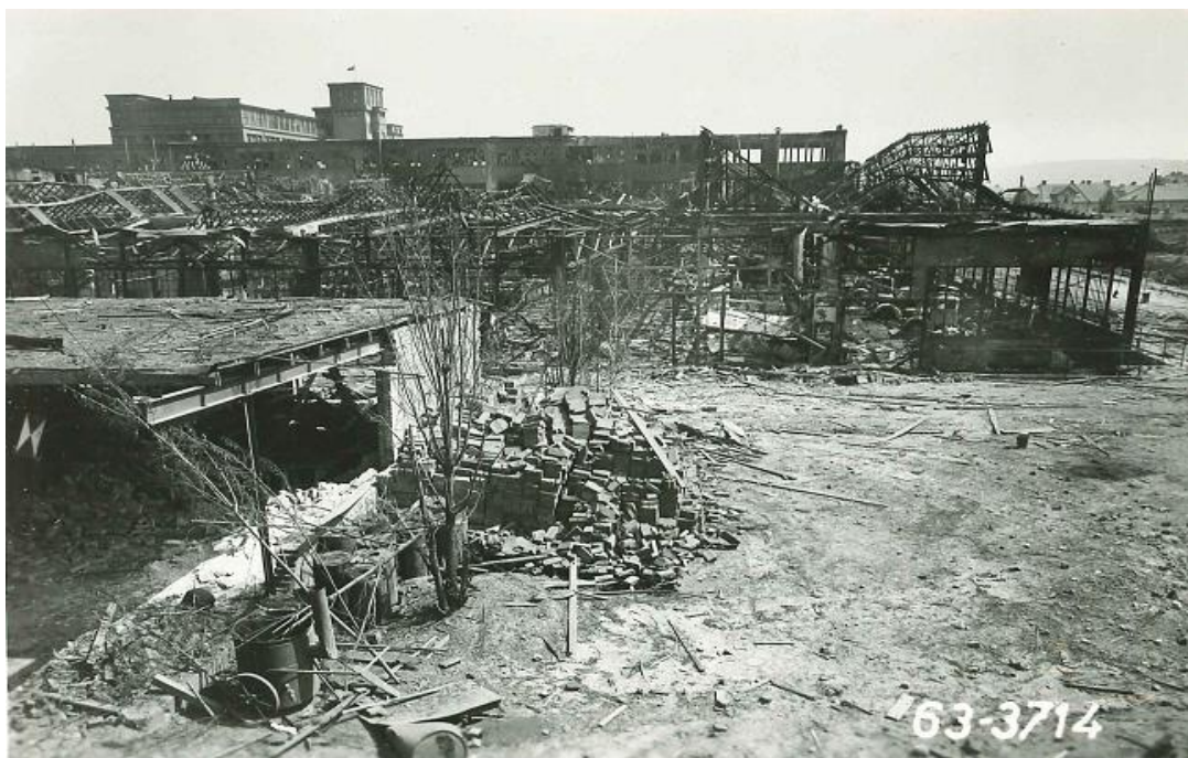
Následky náletu v areálu ASAPu, 9. květen 1945.