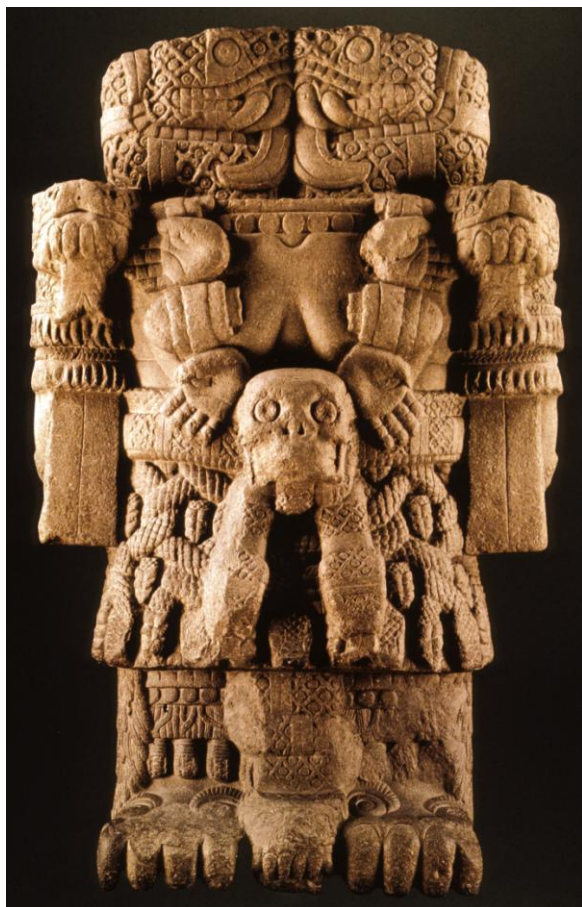
Obrázek 5 - Coatlicue

ze dvou hadích hlav, na sukni vyobrazené spletnice hadích těl, dlouhé pařáty na nohách i na rukách a mocný přívěšek z lidských končetin a srdcí na krku. Jen z popisu lze vyvodit, že šlo o velmi mocnou a hroživou bohyni. 39