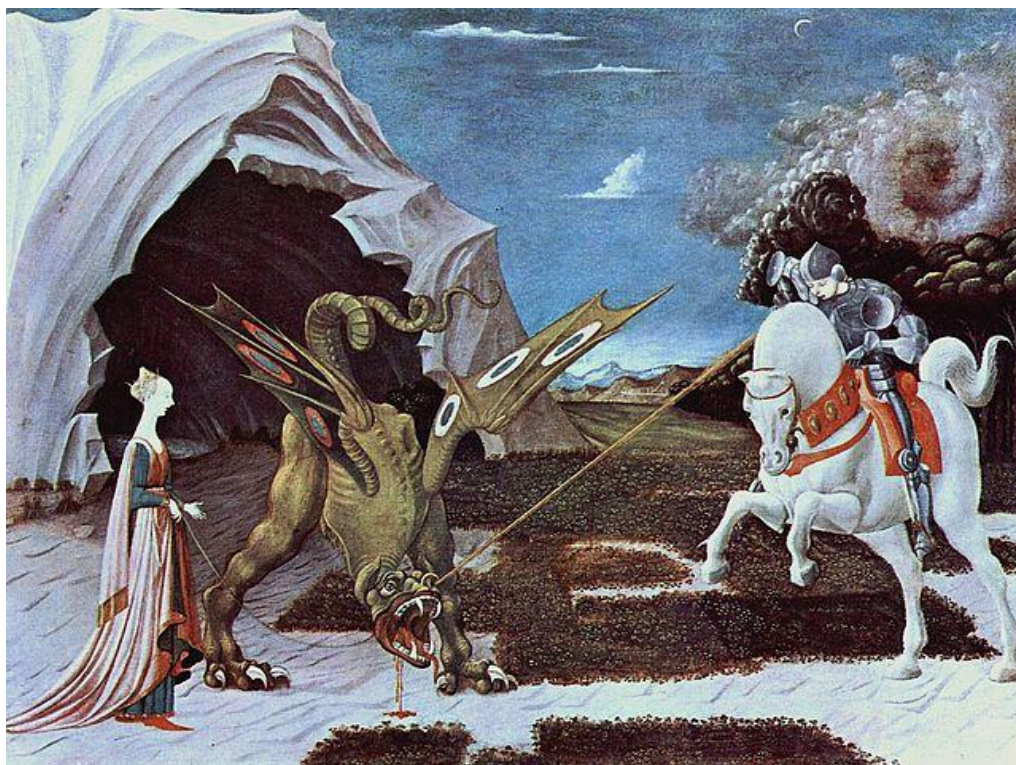
Obrázek 1 - Sv. Jiří a drak

V ní se vypráví, jak hrdina Jiří zachránil obětovanou princeznu ze spárů draka. Po těžkém boji Jiří zvítězil, ale draka úplně nezabil. Dovedl ho do města a lidem slíbil, že ho zabije, až když se všichni lidé nechají pokřtít. 16 V této legendě se projevuje čistě křesťanský zájem. Jinak lze říci, že jde o novější verzi příběhu Persea a Andromedy, z něhož vzešlo mnoho pohádek a vyprávění, tak jak je známe my. Znak draka mají ale i další světci, jako je Svatý Benedikt z Nursie, jehož atributem je okřídlený dráček vylézající z kalicha, nebo Svatý Gotthard, jemuž leží zkrocený drak u nohou.