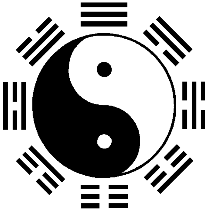
Obrázek 7 - Osm trigramů

Čchang-šeng Jao byl nejvýznamnějším čínským umělcem, který tvořil obrazy draků. Jeho díla zobrazují dračí sílu i vitalitu a tím jsou speciální. Legendy vyprávějí, že při malování vždy plátna přibil k zemi hřebíky a místnost, kde tvořil, musela být zamčená. Dokud tyto podmínky nebyly nastoleny, odmítal malovat oči draka. Díla byla natolik duchovně naplněna, že se obával, že ve chvíli, kdy by drak viděl, ožil by, vystoupil z obrazu a letěl k nebi. Do dnešní doby se uchovala tradice, že při malbách draků se oči malují až jako poslední z celého obrazu a jen při příležitosti nějaké slavnosti. 50