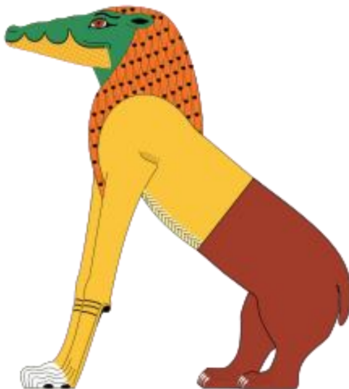
Obrázek 4 - Amemait

Druhou bytostí nápadně podobnou drakovi je nebeský Apop. Již byl zmíněn kosmický souboj mezi bohy a ten v Egyptě můžeme pozorovat právě mezi Apopem, který má podobu hada a představuje kosmický chaos a bohem slunce Re. Mýtus vypráví o nekonečném cyklu opakujících se dní. Slunce v podobě boha Re každý den putuje po nebesích od východu na západ. Každou noc se musí utkat v podsvětí s Apopem, kterého není možné zabít a zároveň Slunce nelze zničit, jde tedy o nekonečný souboj, kterým se udržuje ve vesmíru řád. Egypťané se snažili tento řád udržovat pomocí rituálů a obřadů. 25