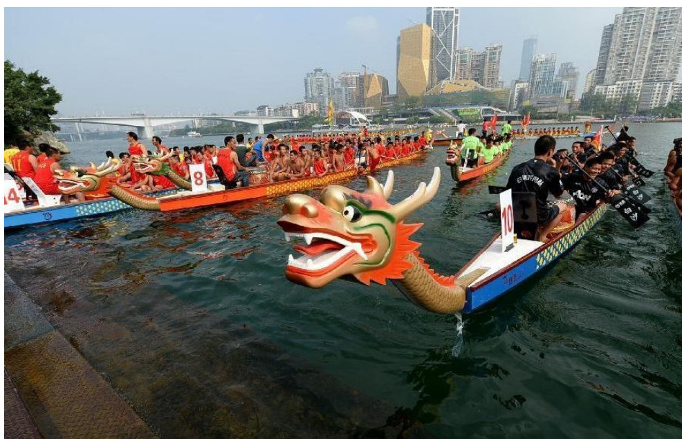
Obrázek 6 - Závody dračích lodí, Guangxi Zhuang, Jižní Čína

Další velmi významnou tradicí jsou závody dračích lodí. Tyto lodě jsou symbolem čínské kultury a ducha. Tato tradice, kdy lidé soutěží v lodích s dračími hlavami, vznikla z legendy o básníku Čchü Jüanovi, který byl ve 3. st. př. n. l. rádcem císaře v provincii Čchü. Byl obviněn z intrik, vyhnán do exilu a na protest proti císaři skočil do řeky Mi-luo-t'iang, v níž se utopil. Věřilo se, že tělo sebevraha patřilo vodním duchům, protože byl lidmi oblíben, házeli do řeky koláče a doufali, že jimi nasytí vodní duchy a odeženou je od sebevrahovy duše. Aby byl efekt zahnání větší, pluli v malých loďkách po řece a bubnovali. Na tuto událost se dnes vzpomíná v době letního slunovratu při festivalu Tuen Ng (festival dračích lodí), kdy se na řece závodí na loďkách, zdobených dračími hlavami a ocasy, za doprovodu bubnů. V dnešní době se závody dračích lodí nekonají jen v Číně, ale kdekoliv na světě, kde žijí Číňané. 47 Břežky řek se zaplní nejen místními obyvateli, ale i turisty, kteří pozorují nádherné, dlouhé dračí lodě (viz Obrázek 6), jak mezi sebou závodí. Po setmění mohou pozorovat všemožné výtvary a osvětlené dračí výjevy na břehu.