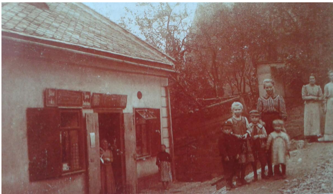
Obrázek č. 4: Soukromý dům s obchůdkem, byl původně sídlem staré velkobystřické školy 3