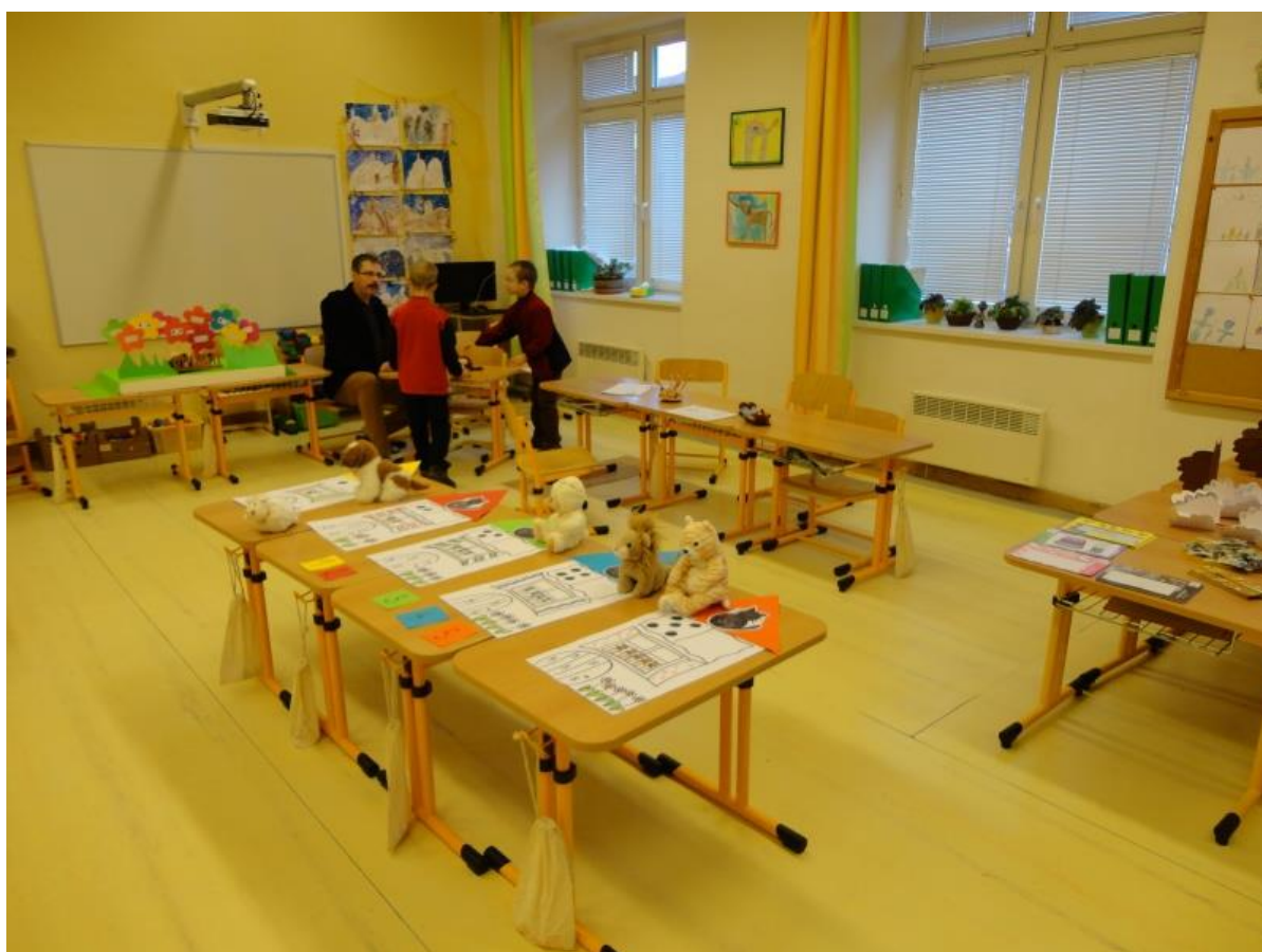
Obrázek č. 12: Zápis do první třídy 5

(pozn. + žáci budou vzdělávaní v zahraničí)