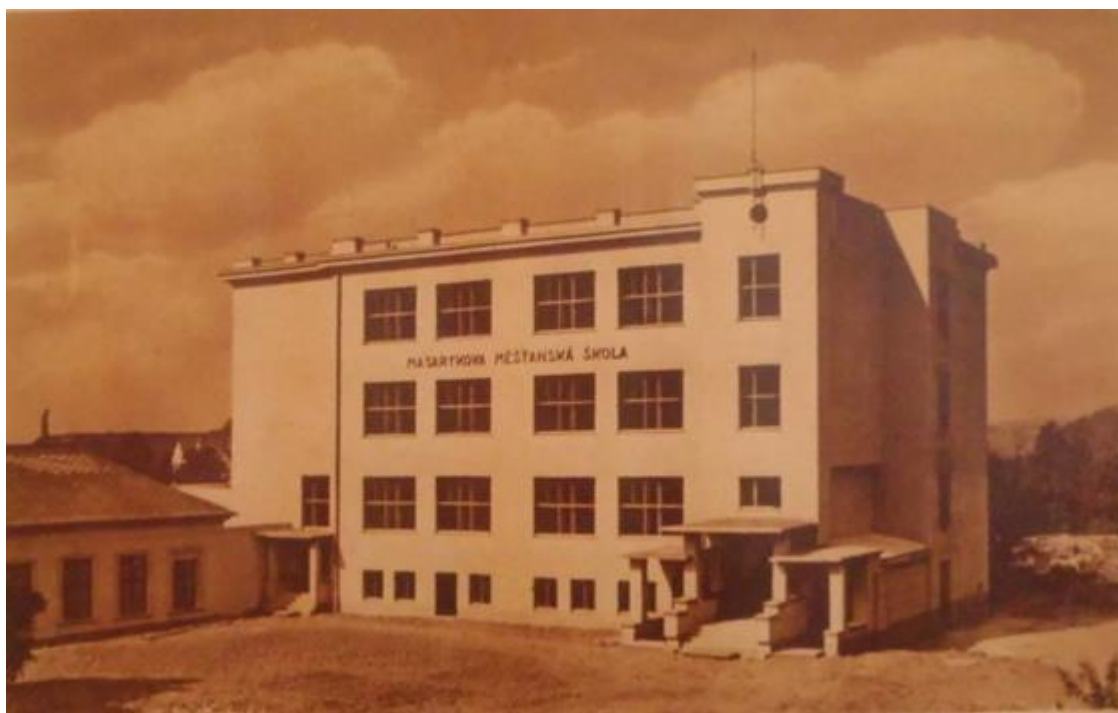
Obrázek č. 6: Masarykova měšťanská škola