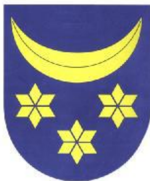
Obrázek č. 2: Znak Velké Bystřice

v naší republice nastal roku 1951, kdy bylo nařízeno všem národním výborům užívat v úředním styku, tedy na razítkách i úředních papírech výhradně státní znak. Roku 1998 požádali představitelé Velké Bystřice o stanovení správné podoby znaku obce. Rozhodnutím podvýboru pro heraldiku Poslanecké sněmovny Parlamentu ČR byly definitivně odstraněny dosavadní nesrovnalosti a znak Velké Bystřice je nyní popisován následovně: „V modrém štítě pod stoupajícím půlměsícem 3 (2,1) hvězdy, vše zlaté“ 2 .