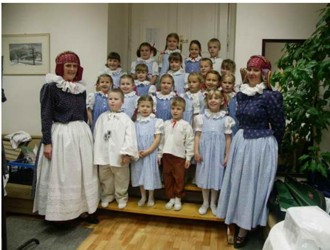
Obrázek č. 9: Čekanka (fotogalerie souboru)

Tato folklorní přípravka pracuje od r. 2004 a je součástí folklorního souboru Haná Velká Bystřice. Děti ve věku 5 až 8 let v Čekance pobývají většinou 2 až 3 roky, během kterých se učí hanácké písničky, říkadla a tanečky, poté postupují do souboru Krušpánek. Výsledky svého snažení předvádí Čekanka obecnstvu v krátkých pásmech o Vánocích, na Masopustu, na vánočním a velikonočním jarmarku ve škole, na Slavnosti kroje a na Lidovém roku ve Velké Bystřici. Vystoupení Čekanky doprovází zpravidla muzika Krušpánek pod vedením Lenky Černínové, na Slavnosti kroje hrává muzika Strunky 17 .