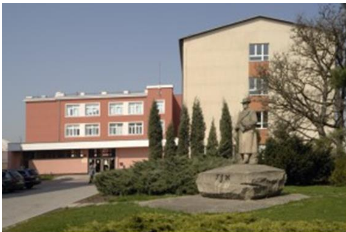
Obrázek č. 11: Současná podoba budovy školy 5

Posláním velkobystřické školy není pouhé zprostředkování určitého obsahu vědomostí a následné zkoušení žáků z faktografických přehledů. Chce, aby škola byla místem, které žáky motivuje k aktivnímu učení a toto učení všemožně podporuje. Nejsou podstatné encyklopedické vědomosti, ale hlavní je osvojit si pro život důležité kompetence – umět se učit, chtít se učit, umět řešit problémy a mít sociální dovednosti. Cílem školy je vytvořit takové prostředí, kde děti s různými vzdělávacími potřebami získávají kvalitní vzdělání, cítí se bezpečně a spokojeně. Chce rozvíjet u žáků kompetence, které jsou nezbytné pro jejich další studium i život. Charakter práce školy má v dětech podporovat pocit bezpečí, možnost pozitivního prožívání, získání zdravého sebevědomí, rozvíjení kritického myšlení a schopnost sebehodnocení.