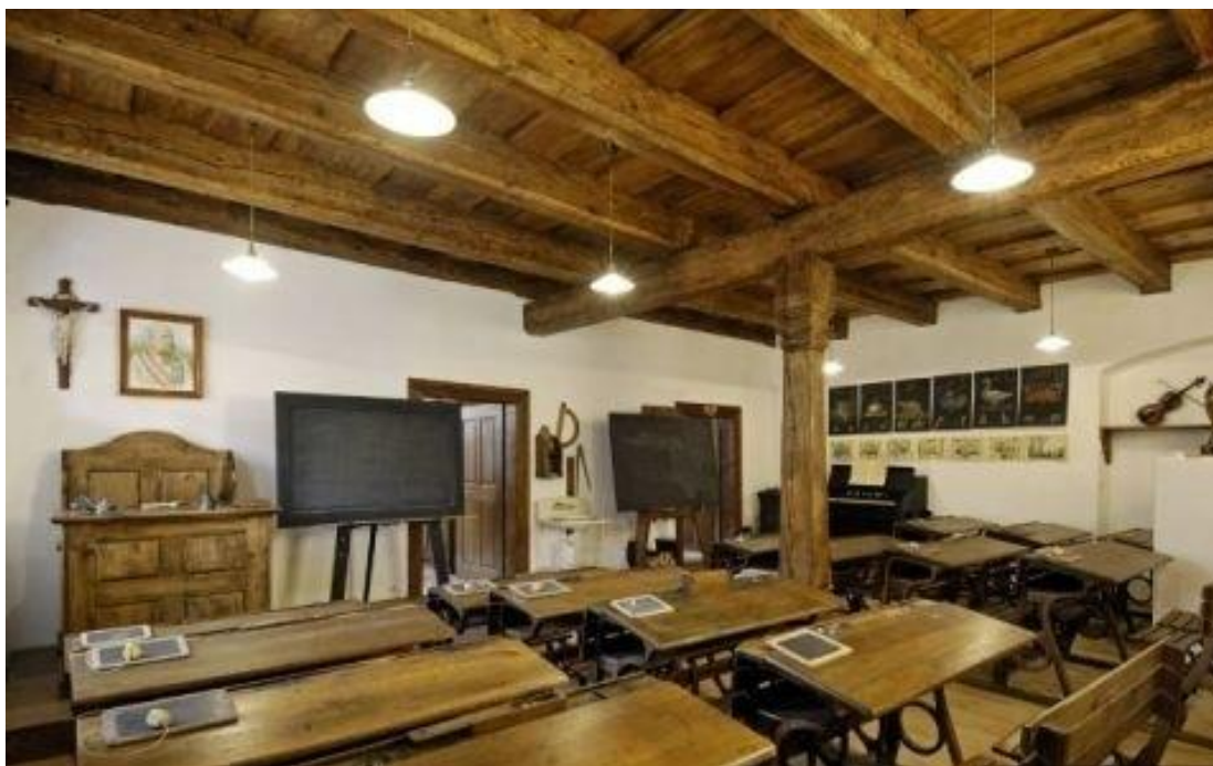
Obrázek č. 7: učebna