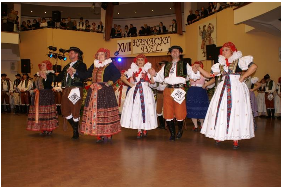
Obrázek č. 8: Folklorní soubor Haná