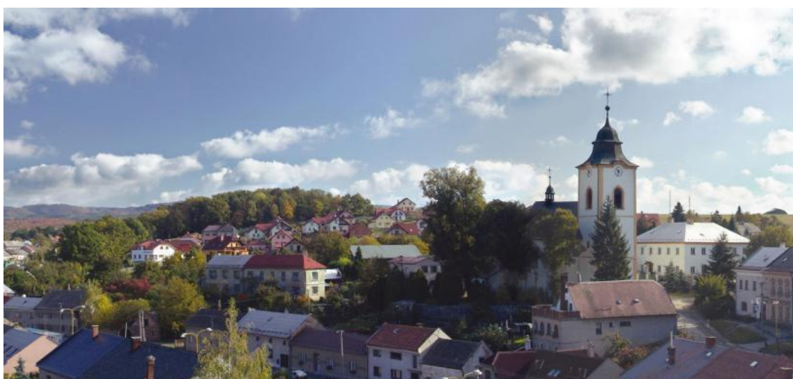
Obrázek č. 1: Velká Bystřice

Díky své poloze a dosahu mnoha významných turistických cílů je Velká Bystřice atraktivní destinací pro všechny věkové kategorie, vyznavače různých způsobů trávení volného času a zejména pro rodiny s dětmi. Město je sídlem mikroregionu Bystřička a místní informační centrum návštěvníkům nabídne program přesně podle jejich přání. Z analýzy dostupných podkladů jsem zrekonstruovala následující popis města v historickém, kulturním, ekonomickém a politickém kontextu vývoje regionu.