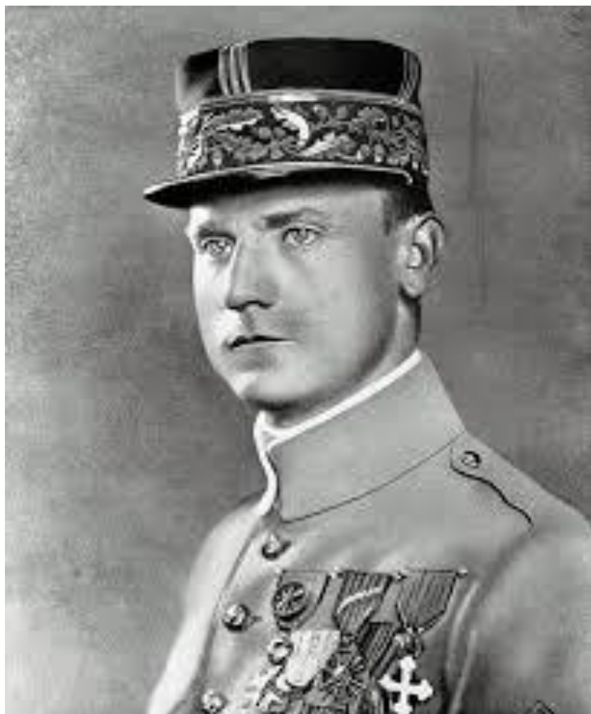
Obrázek 4. První československý ministr vojenství Milan Rastislav Štefánik

MINARECHOVÁ Radka, Štefánik co-founded Czechoslovakia but did not live to see it thrive , The Slovak Spectator, 2018. Dostupné z: https://spectator.sme.sk/c/20944645/stefanik-co-founded-czechoslovakia-but-did-not-live-to-see-it-thrive.html [staženo: 2021-02-18]