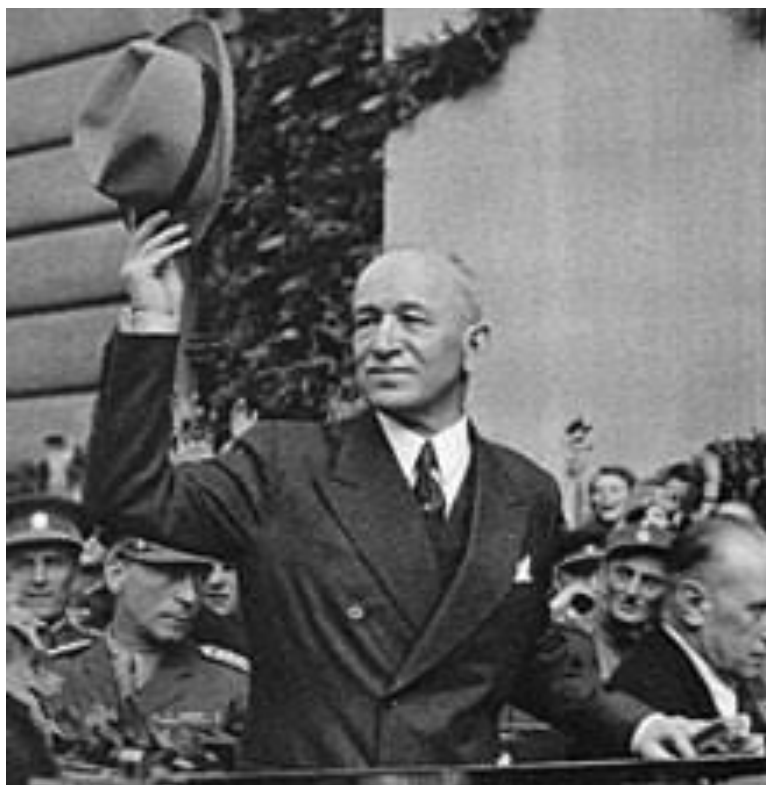
Obrázek 3. První československý ministr zahraničních věcí Edvard Beneš

Návrat prezidenta Beneše do Prahy, Praha, 1945. [staženo: 2021-02-18] Dostupné z: https://cs.wikipedia.org/wiki/Edvard_Bene%C5%A1