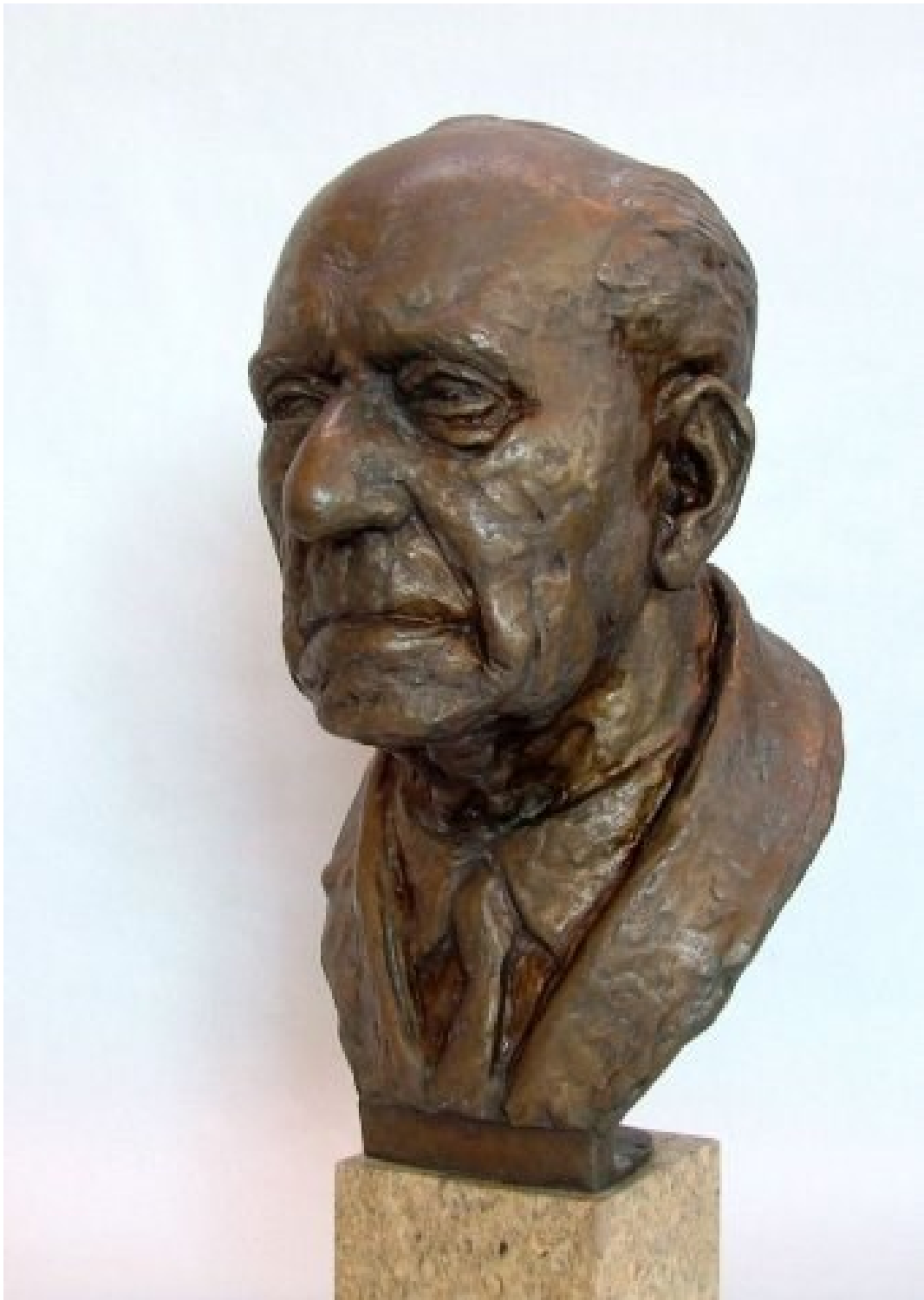
Obr. 10: Portrét Oldřicha Tichého

Zdroj: Nina Jindřichová – Sochařský a štukatérský ateliér: Portrét generála Oldřicha Tichého . In: http://www.jindrichova.com/portfolio/volna-tvorba/portrety [cit. 26. 4. 2015]