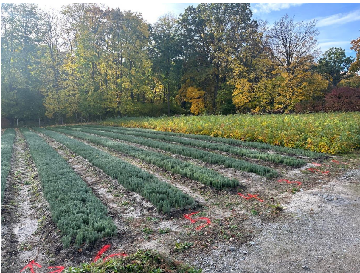
Obrázek č.6 Testované záhony

K samotnému pokusu bylo vybráno šest záhonů smrku ztepilého. Jednotlivé záhony byly popořadě očíslovány a zavedeny do databáze.