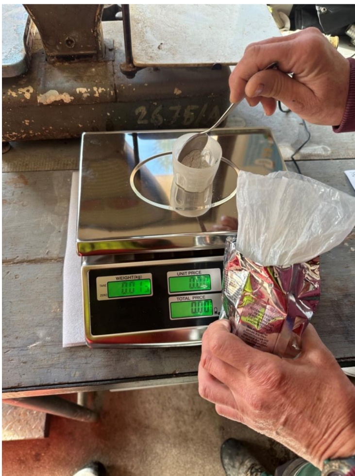
Obrázek č.2 Vytváření jíchy pro aplikaci preparátů