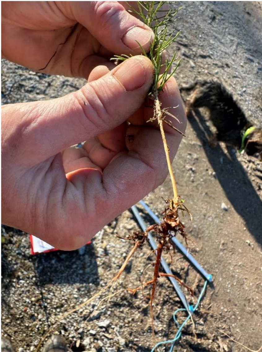
Obrázek č.3 Analýza napadeného jedince Botrytis cinerea

každém měření na jednotlivých záhonech. Po provedení všech měření došlo k fotodokumentaci ideálních jedinců, na kterých bylo velmi viditelné napadení Botrytis cinerea .