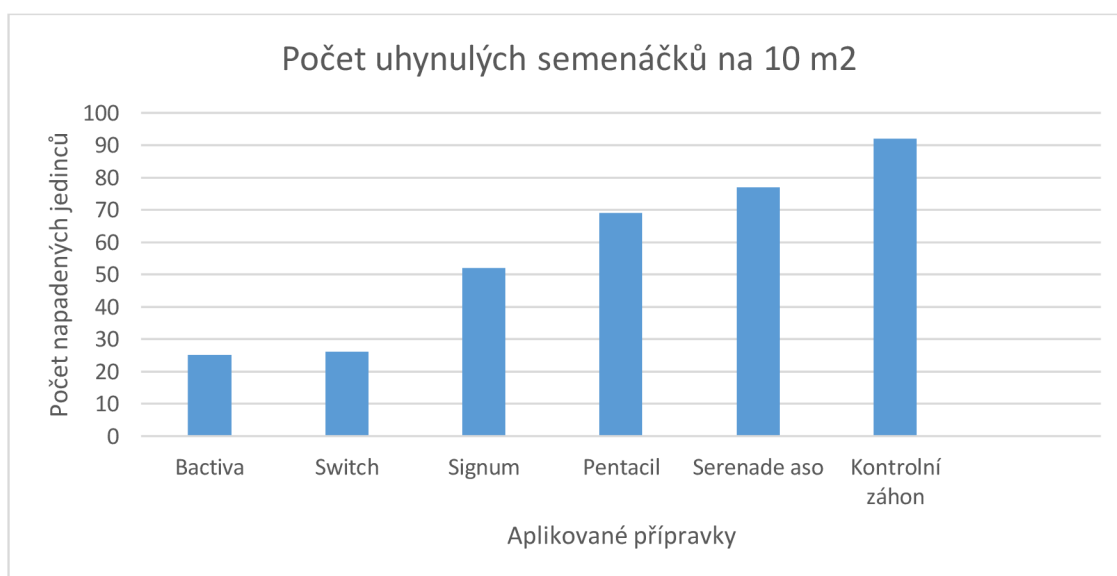
Obrázek č.9 Zobrazení účinnosti použitých biopreparátů pomocí sloupcového grafu.