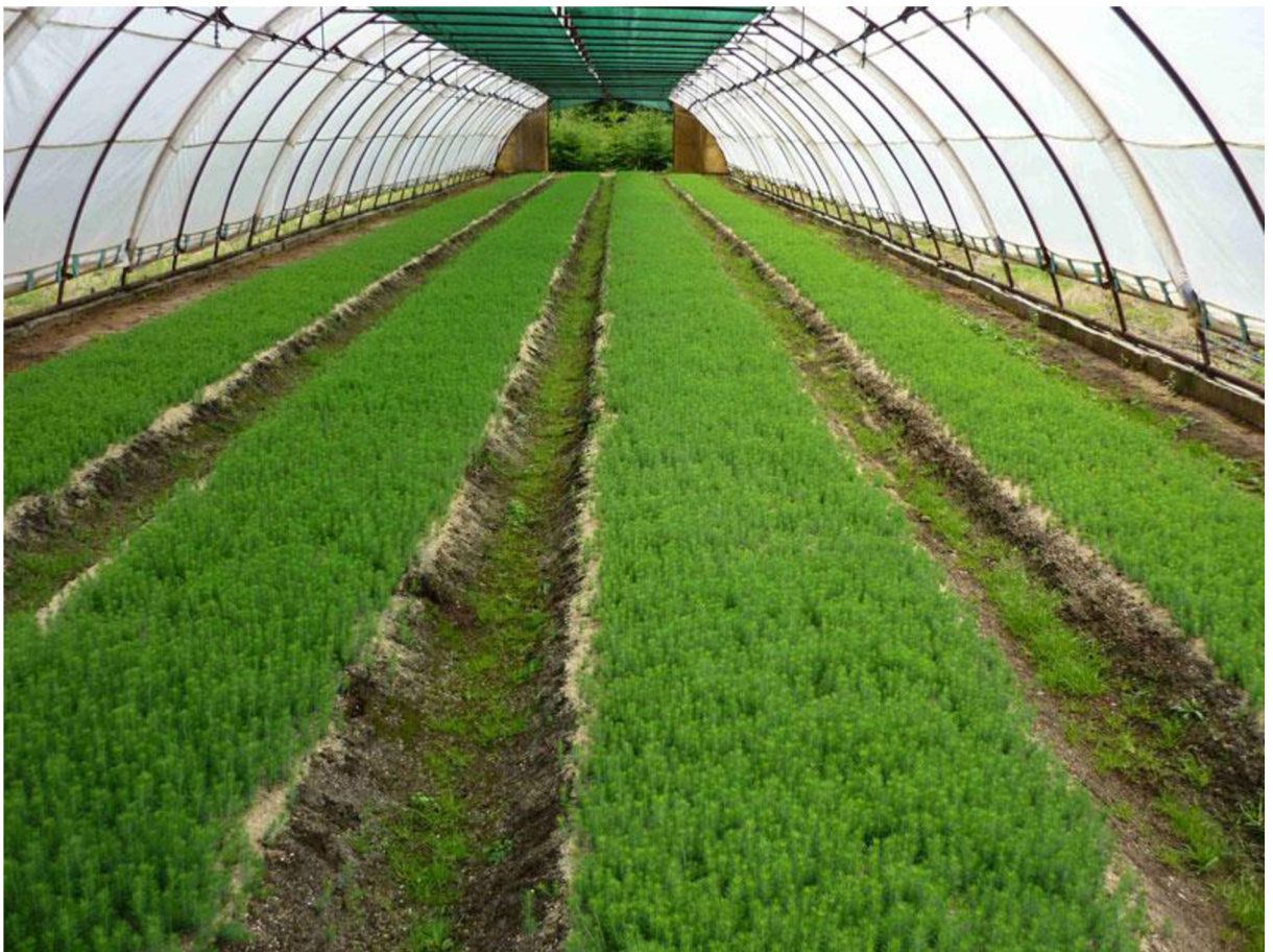
Obrázek č.1 Lesní školka Orlík nad Vltavou

Náklady na produkci sazenic se podařilo snížit a podíl opakované obnovy lesa na celkovém zalesnění klesl z dlouhodobého průměru 21 % na 11 %, což ukazuje, že nebyla snižována kvalita. Přibližně 10% produkce je upraveno nákupem chybějících druhů a prodejem přebytků. Cílem není rozšířit komerční produkci, ale spíše podporovat spolupráci s okolními lesními školkami, zejména s Lesní školkou Pavel Burda (Bambuška, 2024).