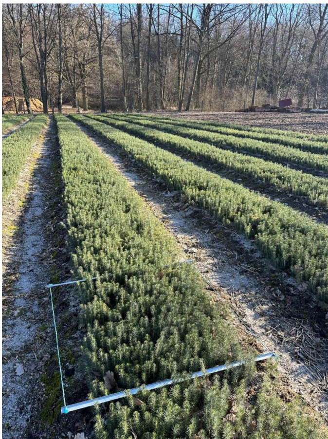
Obrázek č.5 Získávání dat pro výpočet počtu jedinců na 1 m 2

jednotlivých semenáčků na ploše 1 m 2 a k uschování dat. Následně došlo k vypočítání počtu jedinců na ploše 1 m 2 , za pomoci aritmetického průměru.