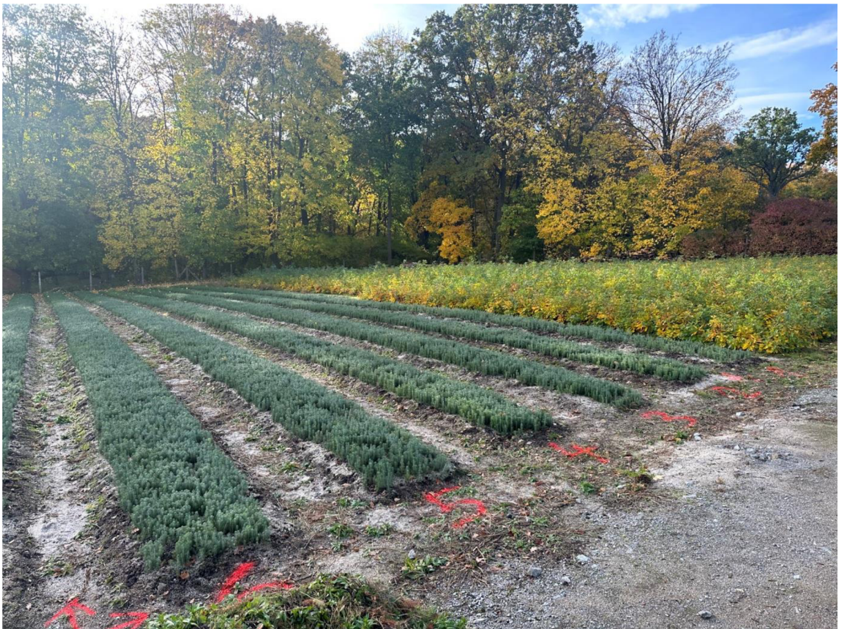
Obrázek č.6 Testované záhony

K samotnému pokusu bylo vybráno šest záhonů smrku ztepilého. Jednotlivé záhony byly popořadě očíslovány a zavedeny do databáze.