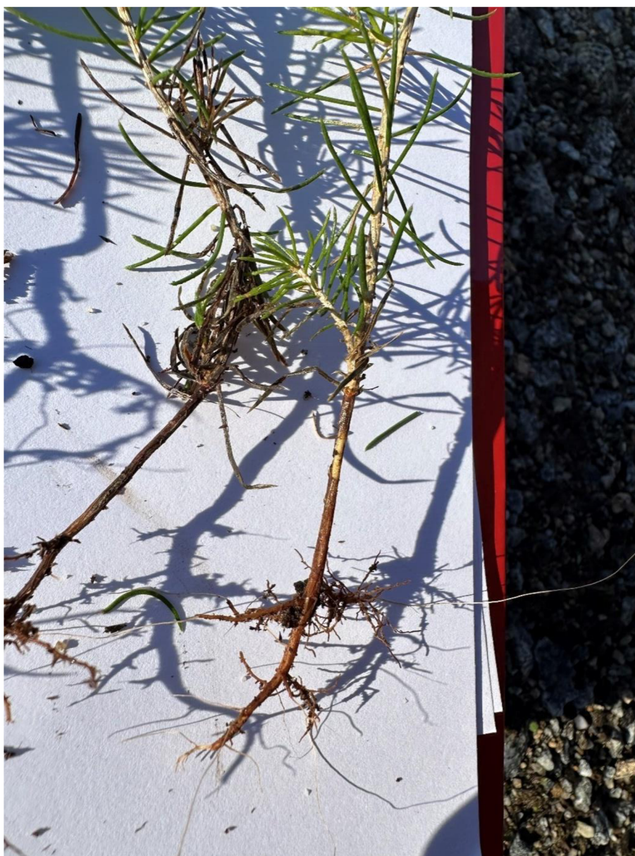
Obrázek č.4 Analýza napadeného jedince Botrytis cinerea