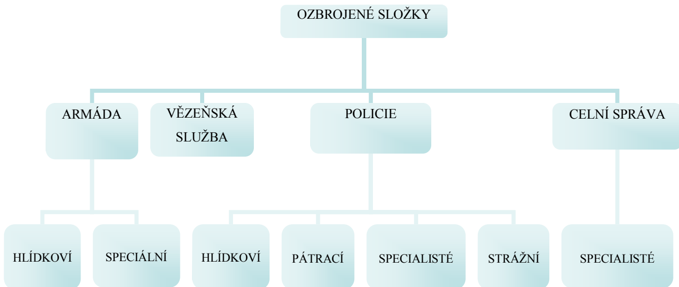
Obr. 3: Schéma využití psů v ozbrojených složkách