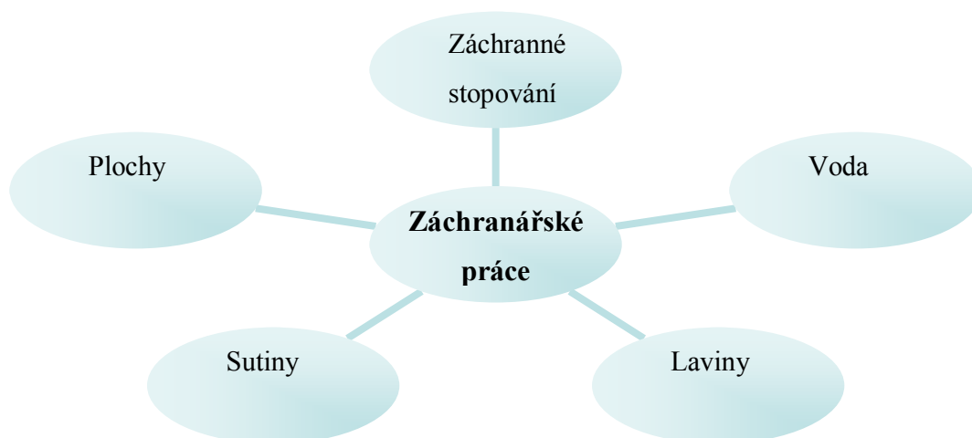
Obr. 2: Schéma záchranných prací

umožňuje pracovat v prašných a nevýhodných podmínkách. Díky němu dokáží vyhledávat pohřešované v sutinách, nepřístupném terénu, pod lavinami nebo vodní hladinou.