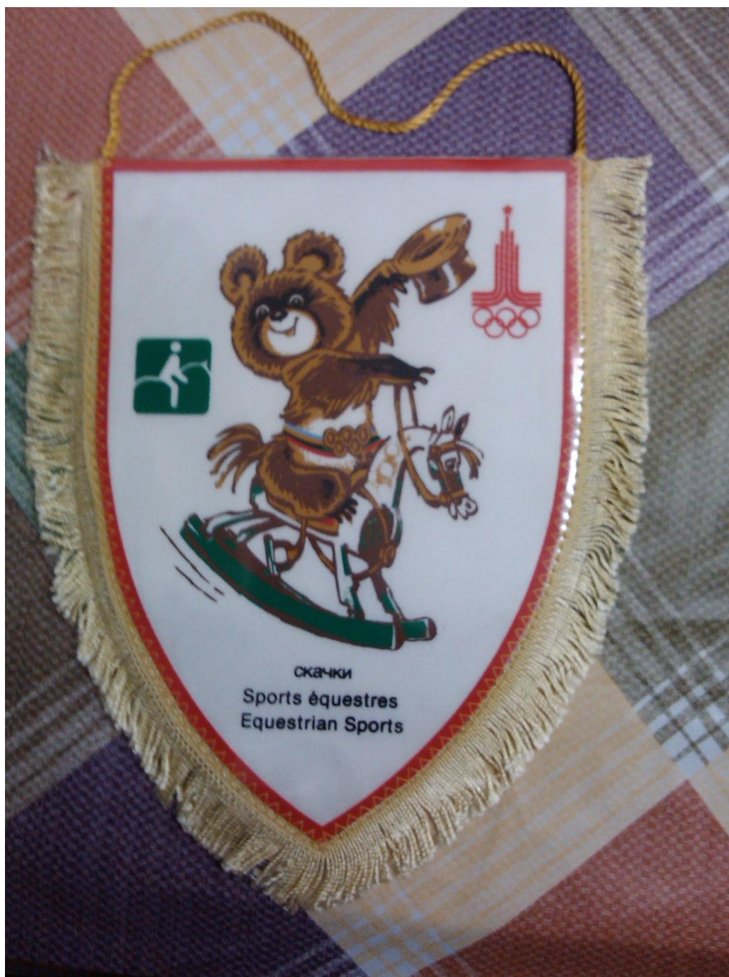
Upomínkový předmět s maskotem Míšou – Moskva 1980