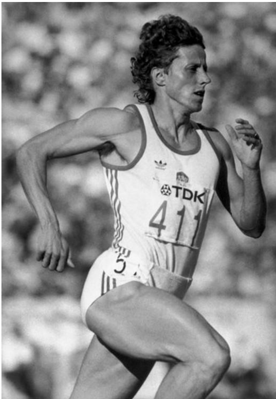
Jarmila Kratochvílová – československá běžkyně