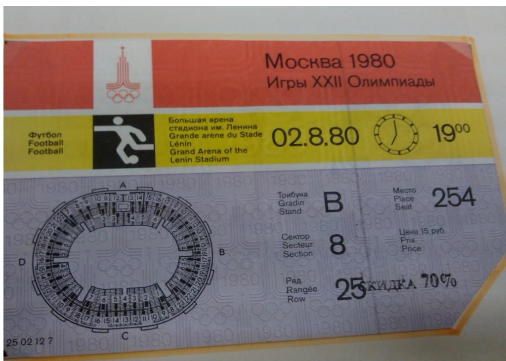
Пříloha č. 5