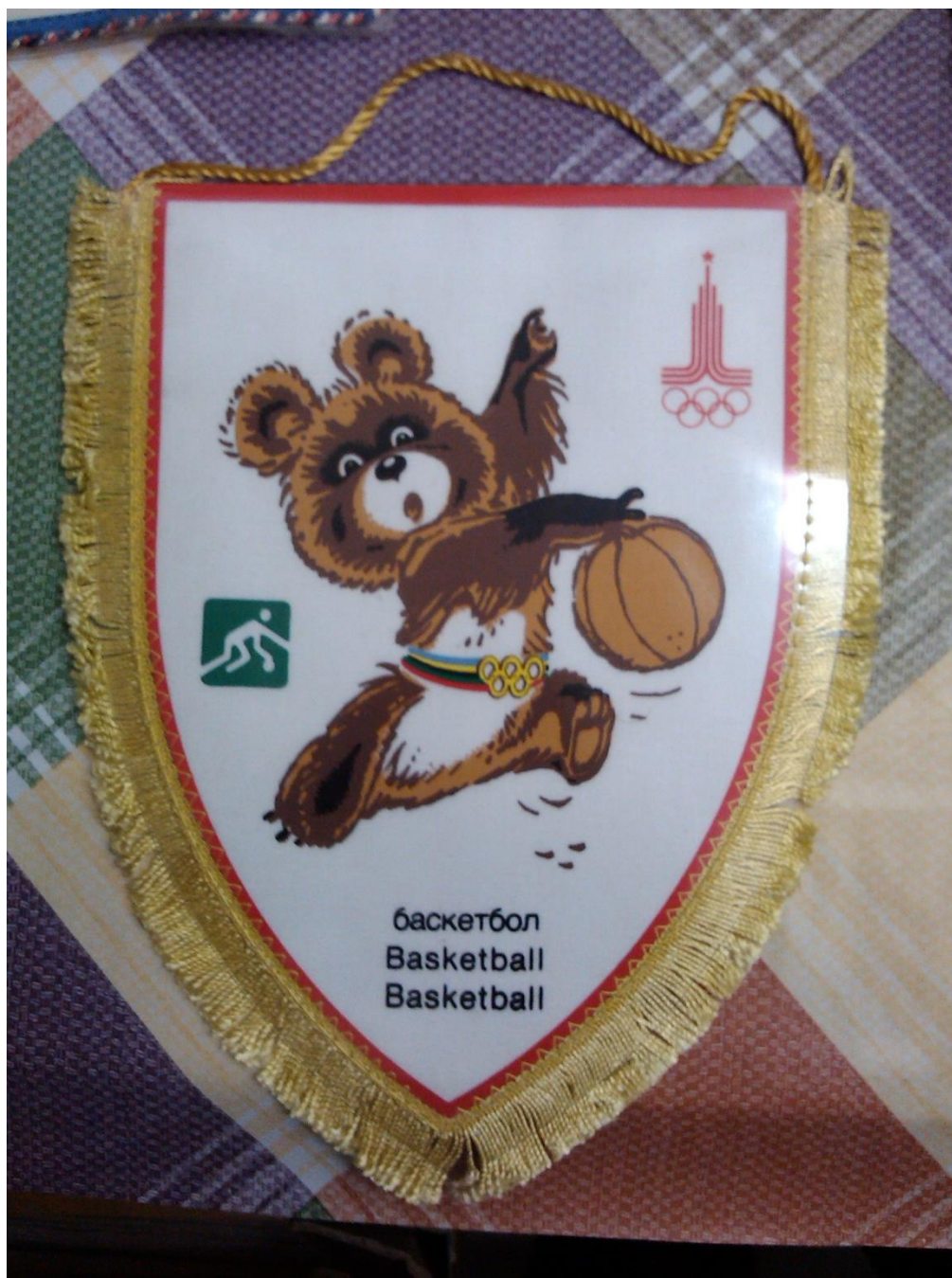
Upomínkový předmět s maskotem Míšou – Moskva 1980