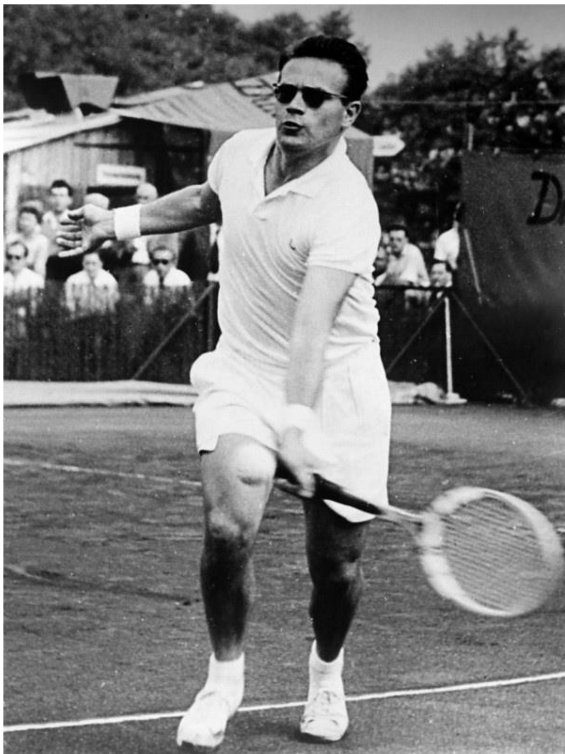
Jaroslav Drobný – československý hokejista a tenista