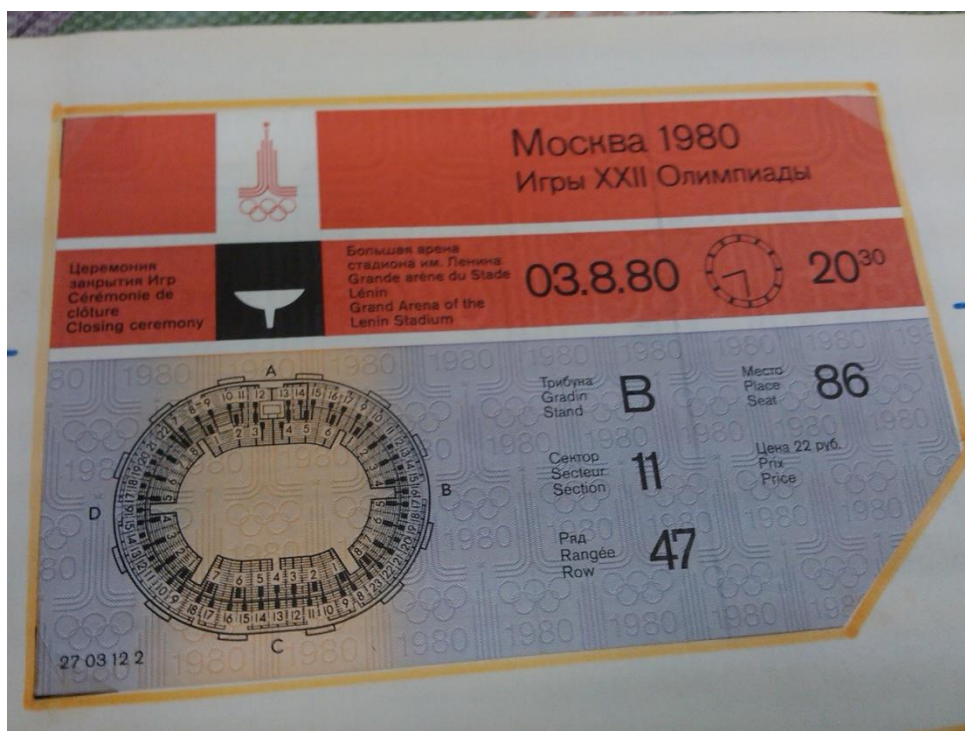
Vstupenky z olympiády v Moskvě 1980