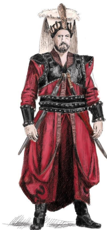
Obrázek 2: Vyobrazení příslušníka janičářů 17. století