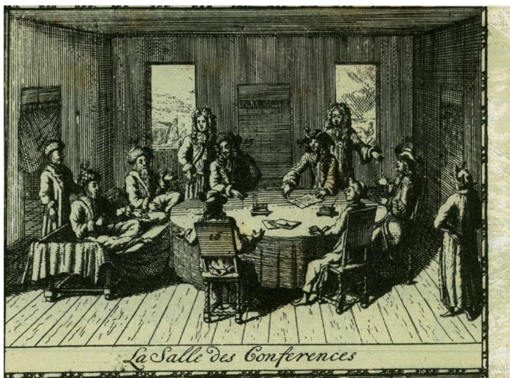
Obrázek 4: Mírová jednání ve Sremských Karlovcích