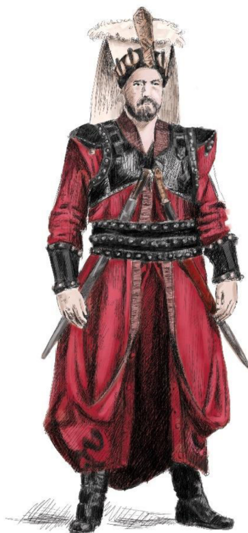
Obrázek 2: Vyobrazení příslušníka janičářů 17. století