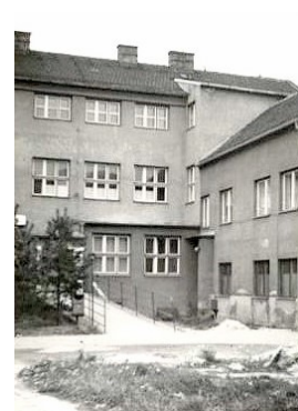
20. Nemocnica Ivančice