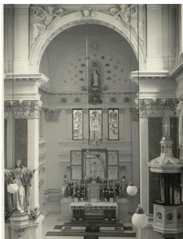
8. Interiér zrekonštruovaného kostola so otvoreným hlavným oltárom