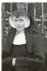
73. S. M. Olga