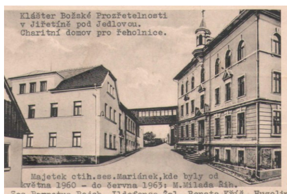
83. Internácia Jiřetín pod Jedlovou