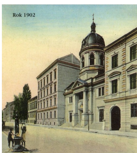
4. Pôvodnú vzhľad materinca a kostola do roku 1944