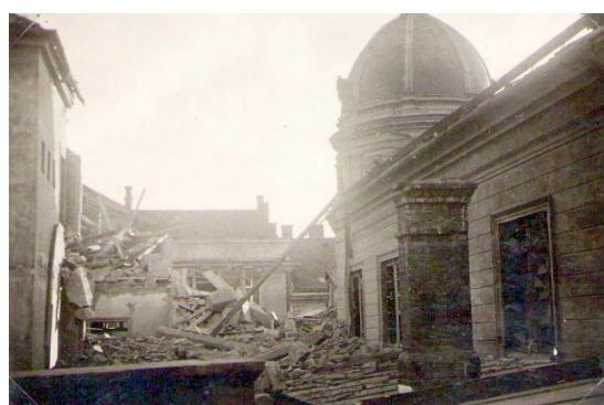
7. Pohľad zozadu