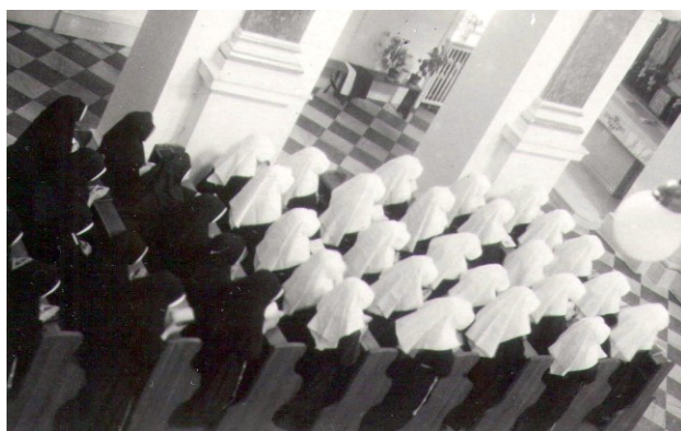
26. Pohľad z ľavej strany spredu