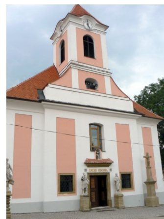
51. Žarošice - kostol