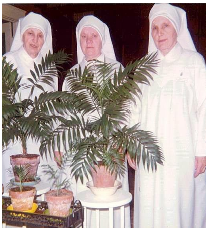
52. Komunita sestier v Buffálo (USA)