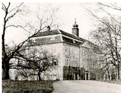
11. Filiálka Višňové