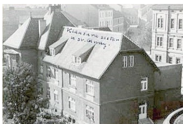
18. Nemocnica u sv. Anny