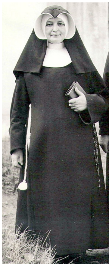
91. Pôvodný rehoľný odev našej kongregácie