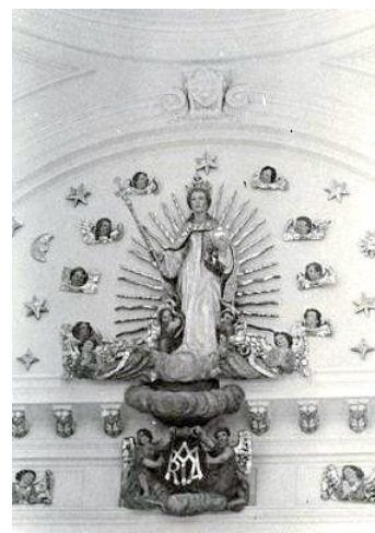
10. Detail sochy Kráľovnej vesmíru nachádzajúcej sa nad hlavným oltárom