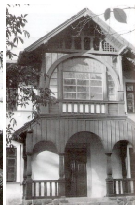
17. Roželov pri Rožmitáli