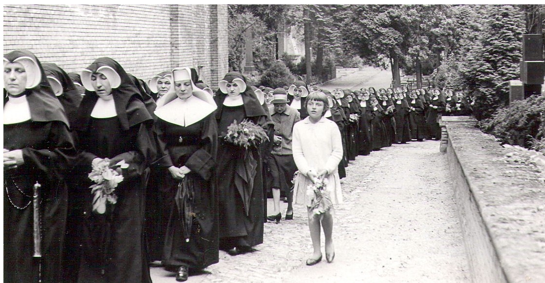
90. Dlhý zástup sestier sprevádzajúcich Mater Gerardu na poslednej ceste