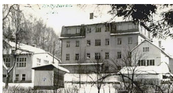
43. Rokytnice nad Jizerou