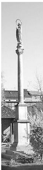
13. Socha Kráľovnej Mieru na záhrade