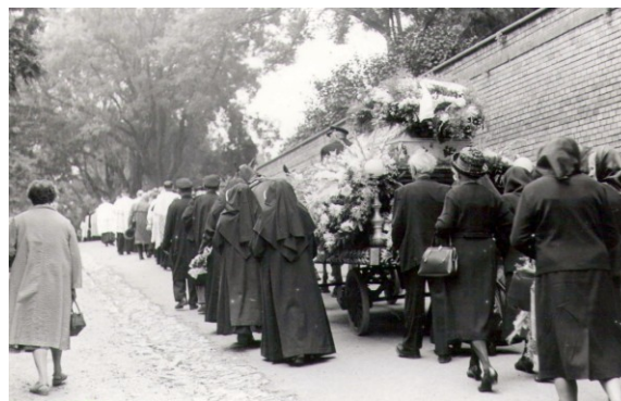
89. Rakva Mater Gerardy