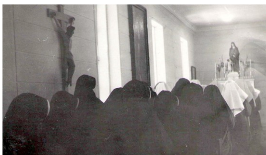
29. Preplnený bol aj chór kostola