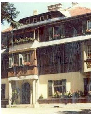
37. Mariánske Lázně – Beskyd