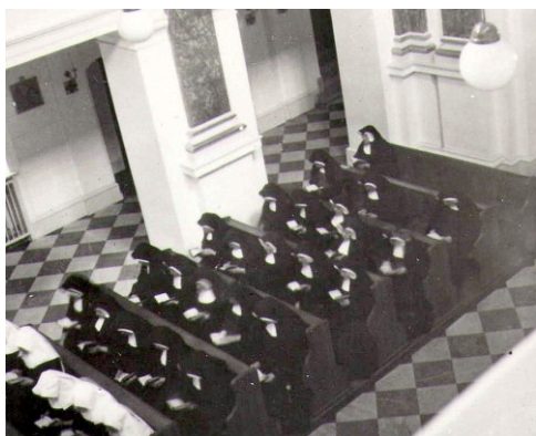
25. Preplnený materinec po vyhnaní sestier z nemocníc. Pohľad na modliace sa sestry v pravej zadnej časti kostola