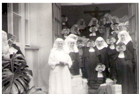
30. Sestry z Ivančíc ukladajú svoje veci do umrlejšej komory