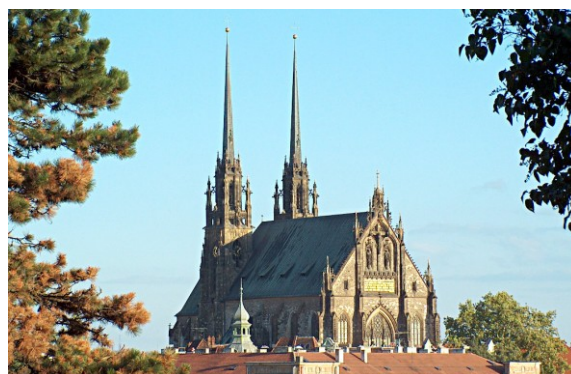
49. Brno – Petrov – biskupstvo