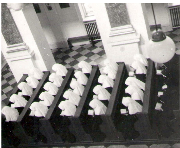
27. Pohľad na pravú stranu vpredu