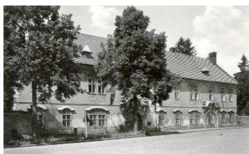
44. Teplice nad Metují