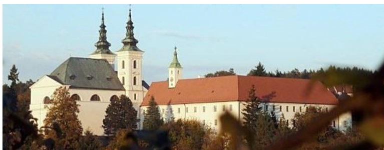
50. Vranov pri Brne