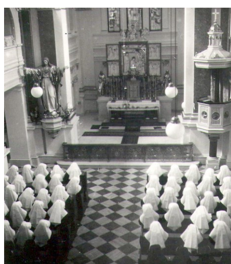
28. Celkový pohľad na prednú časť kostola.