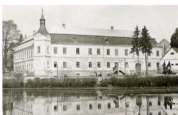
41. Česká Olešná