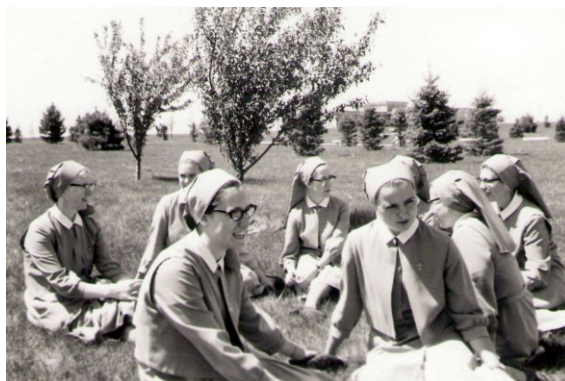
55. Komunita mladých sestier počas nedeľného popoludnia. V pozadí je vidieť materinec Máriiných sestier vo Vawerly USA