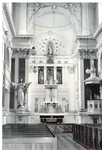
9. Interiér so zatvoreným hlavným oltárom