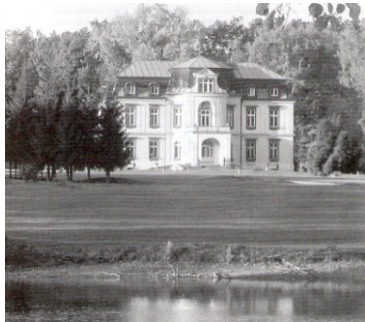
15. Myštěves – pohľad spredu