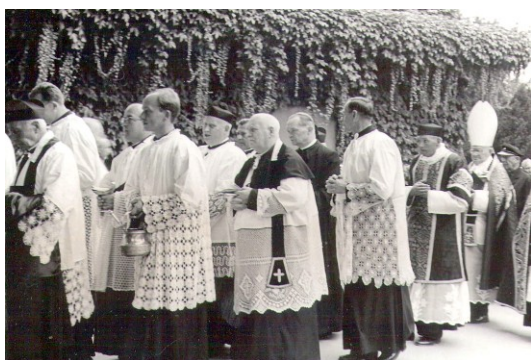
88. Pohreb Mater Gerardy – Mons. Hlouch v smútočnom sprievode