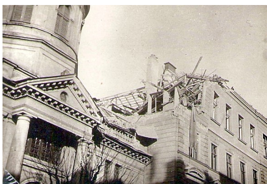
6. Následky bombardovania v roku 1944. Pohľad z ulice