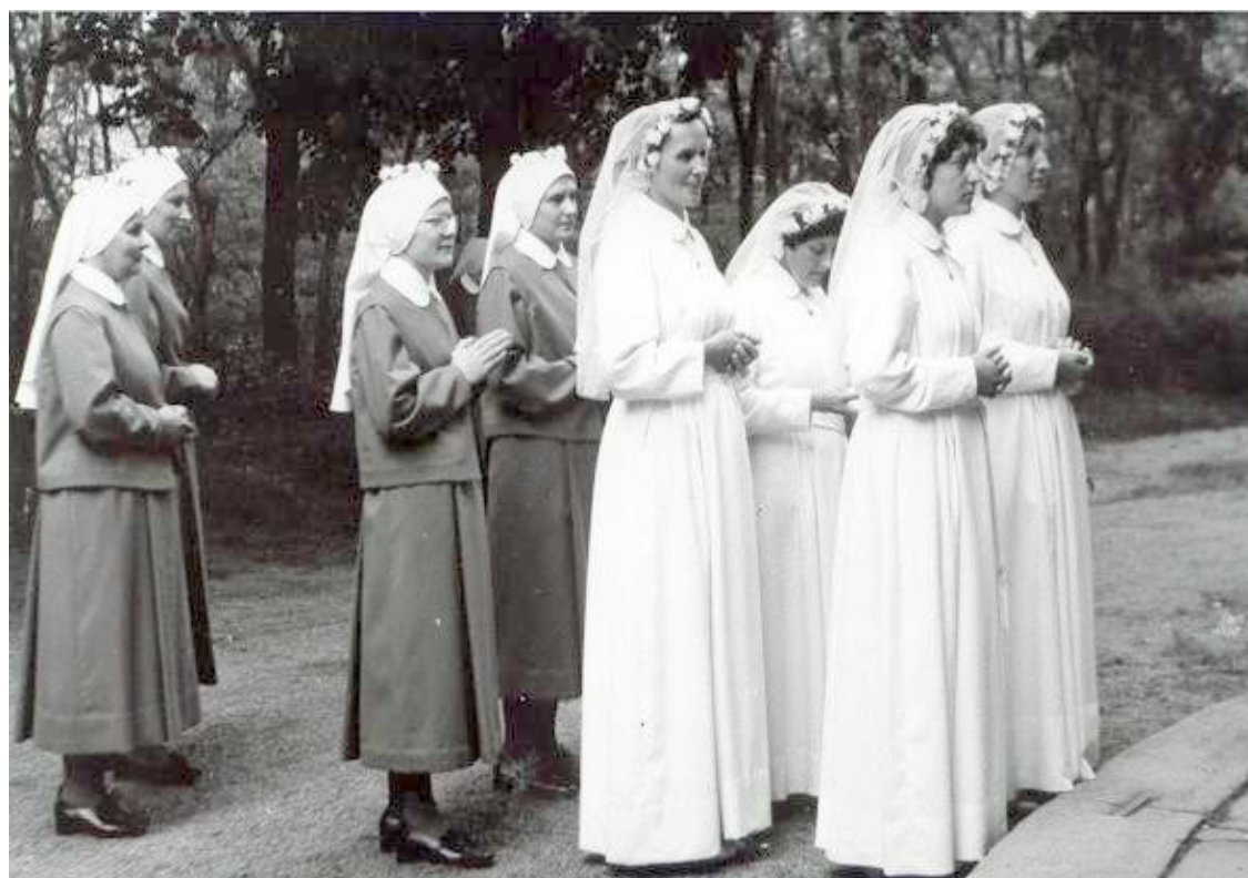
96. Obliečka a prvé sľuby v Lehoviciach 29. mája 1971