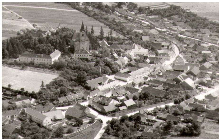
56. Filiálka Niederhollabrunn – Rakúsko