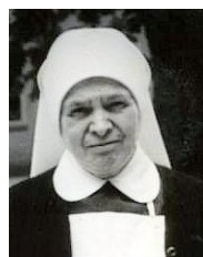
74 S. M. Pankrácie