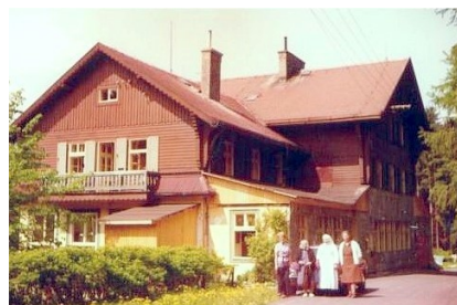
36. Mariánske Lázně - Polom