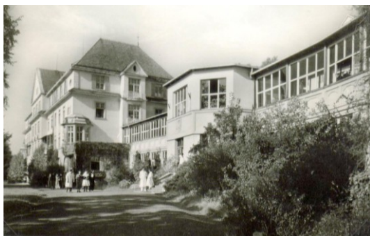
21. Pľúčne sanatórium Jevíčko