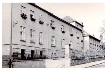
39. Nový Jičín