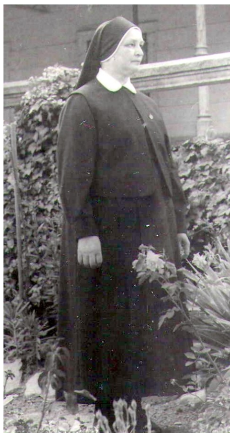
92. Nový rehoľný odev zmenený v duchu záverov II. vatikánskeho koncilu