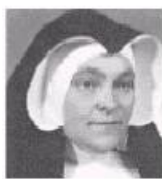
79. S. M. Fides