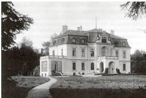
16. Myštěves – pohľad zozadu