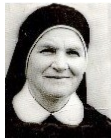
61. S. M. Aquinata