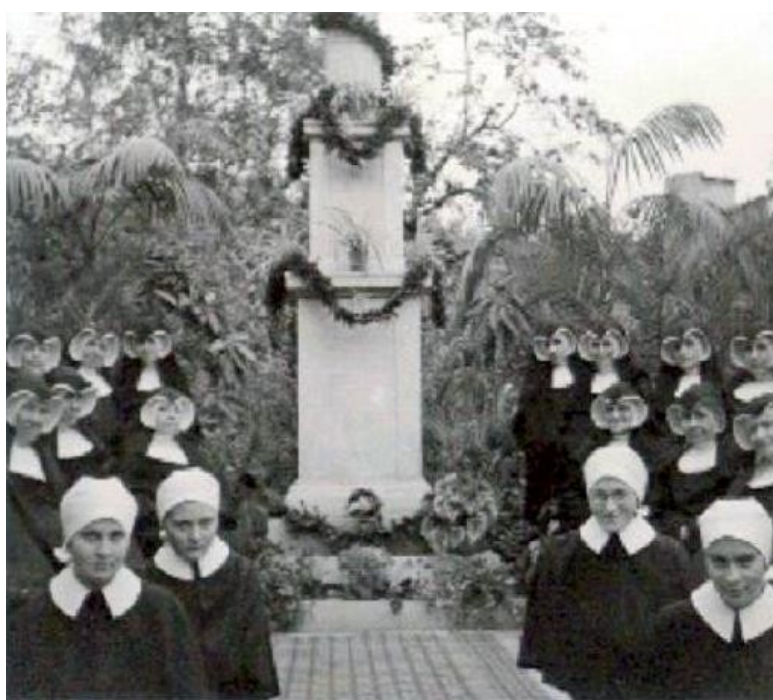
14. Slávnostné posvätenie sochy Kráľovnej Mieru 7. októbra 1952