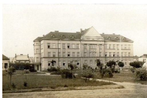
22. Nemocnica Jičín