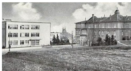
19. Nemocnica Žlutý Kopec