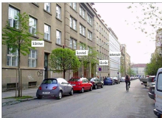
5. Súčasný stav