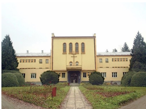
46. Velký Újezd