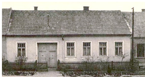
12. Filiálka Pozořice