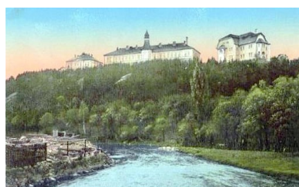
24. Nemocnica Třebíč