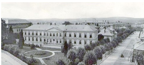
23. Nemocnica Jihlava