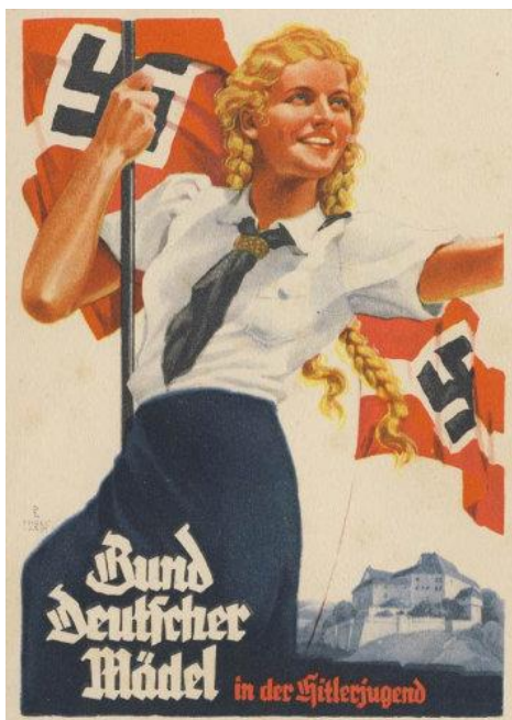
Obrázek č. 9 (str. 40): „Svaz německých dívek v Hitlerjugend“