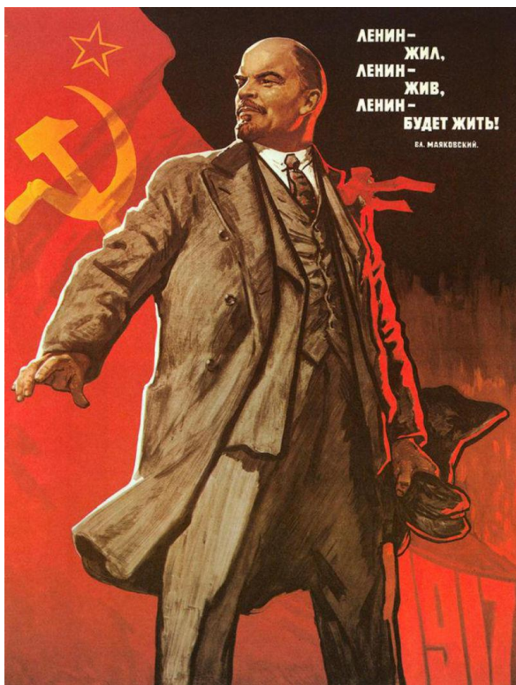
Obrázek č. 12 (str. 45): „ Lenin žil, Lenin žije, Lenin bude žít navždy! “