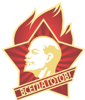
Obrázek č. 17 (str. 53): Emblém Všesvazové pionýrské organizace V. I. Lenina

Dostupné na: http://star-799.ucoz.ru/_tbkp/markelova/giv_pionerija2.gif