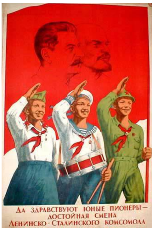
Obrázek č. 20 (str. 56): „Bud'te pozdraveni mladí pionýři - důstojní nástupci Lenisko-Stalinského Komsomolu!“

Dostupné na: https://s-media-cacheak0.pinimg.com/originals/17/03/58/1703585e7e3924ff821df0dd89922461.jpg