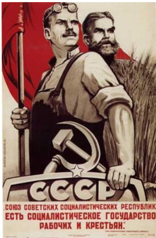
Obrázek č. 13 (str. 45): Plakát z roku 1945 „SSSR je socialistický stát pro tovární dělníky a rolníky.“