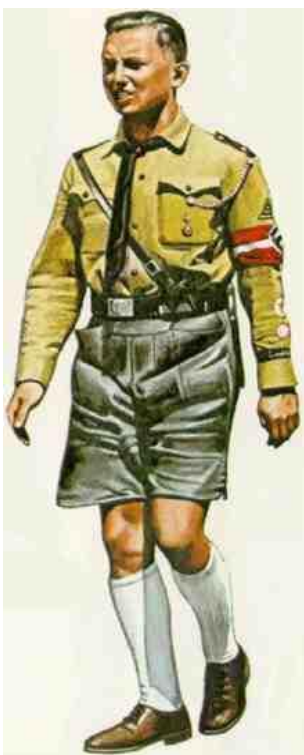
Obrázek č. 6 (str. 37): Člen HJ v uniformě