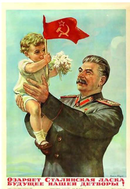
Obrázek č. 22 (str. 56): „Stalinova láska ozařuje naše budoucí děti“

Dostupné na: http://img.cncenter.cz/img/3/full/1430510_.jpg