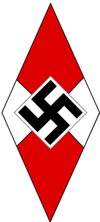
Obrázek č. 4 (str. 37): Emblém Hitlerjugend

https://upload.wikimedia.org/wikipedia/commons/thumb/6/67/Hitlerjugend_Allgemeine_Flagge.svg/220px-Hitlerjugend_Allgemeine_Flagge.svg.png