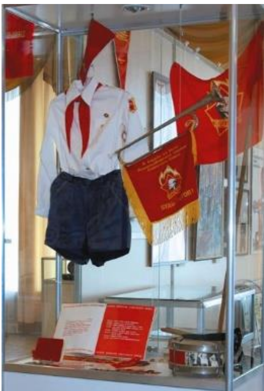
Obrázek č. 15 (str. 53): Slavnostní pionýrský stejnokroj