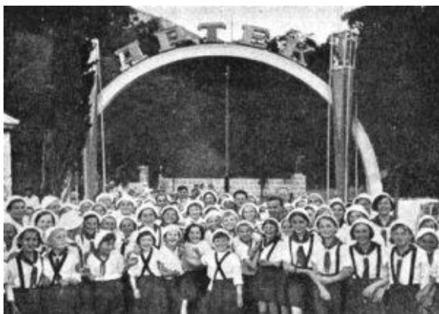
Obrázek č. 19 (str. 54): Pionýrský tábor Artěk