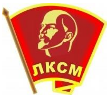
Obrázek č. 18 (str. 53): Emblém Všesvazového leninského komunistického svazu mládeže