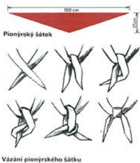
Obrázek č. 14 (str. 53): Návod na správné vázání pionýrského šátku