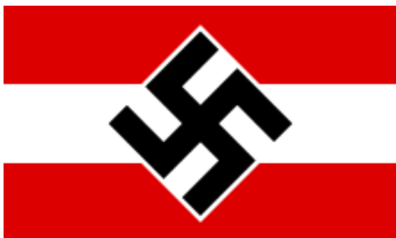
Obrázek č. 3 (str. 37): Vlajka Hitlerjugend