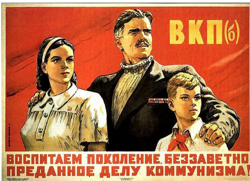
Obrázek č. 21 (str. 56): „Vychováváme pokolení, neochvějně oddané komunismu!“