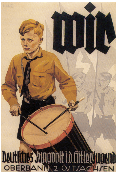
Obrázek č. 10 (str. 40): „My - německý Jungvolk v Hitlerjugend“