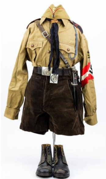
Obrázek č. 5 (str. 37): Uniforma Hitlerjugend