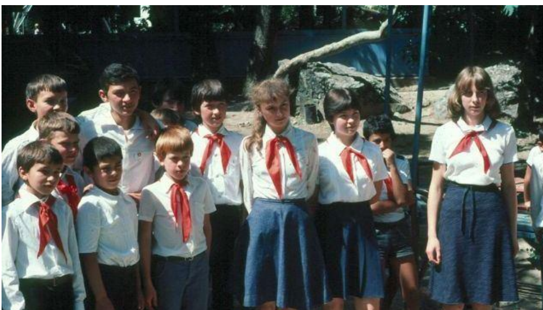
Obrázek č. 16 (str. 53): Pionýrský stejnokroj

Dostupné na: https://cdn.i0.cz/public-data/8a/79/04c771a137eaa6c91cb2283b88b_r16:9_w640_h360_gi:photo:234428.jpg?hash=d8ab549f7f77059d2b7f14d1d6b43593