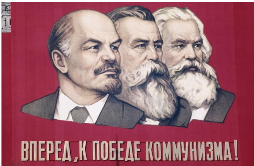
Obrázek č. 11 (str. 45): Lenin, Engels a Marx na plakátu z Lenigradu, rok 1960. “ Vpřed k vítězství komunismu! ”