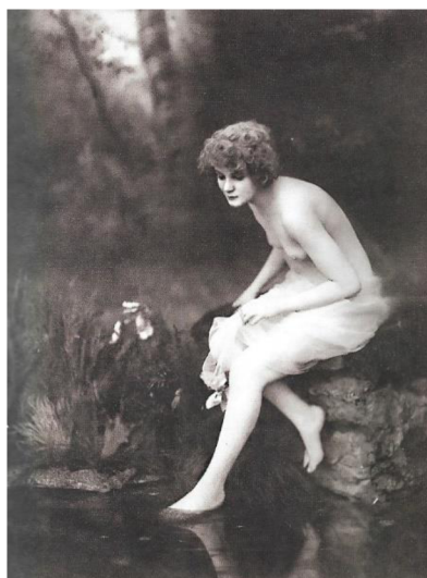
Obrázek 11: 1900, anonymní fotograf 243

Další skupinu tvořily akty pornografické. Většinou se jednalo o pásma fotografií jdoucích chronologicky za sebou. Každá z fotografií zachycovala jednu sexuální polohu, ať už muže se ženou, nebo žen se ženami. Fotografie byly zmenšeny a dohromady vytvořily „příběh“.