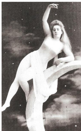
Obrázek 8: 1890, Léopold Reutlinger 240

První skupinou ženských aktů jsou ženská těla zahalena do tělové látky tak, aby z dálky nebylo poznat, že nejsou nahá. Při detailnější zkoumání pozorovatel objeví, že jim nejsou vidět bradavky ani pohlavní orgány. Jedná se spíše o estetičtější fotky a jejich datace spadá do roku 1890.