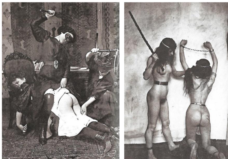
Obrázek 13: 1890, anonymní fotograf 245

Poslední skupinu tvořily akty sadomasochistické, pro společnost přelomu 19. a 20. století tedy akty perverzní. Zachycovaly ženy i muže v nepřijatelných polohách a scénách, modelky na nich byly často skrývány pod různými maskami.