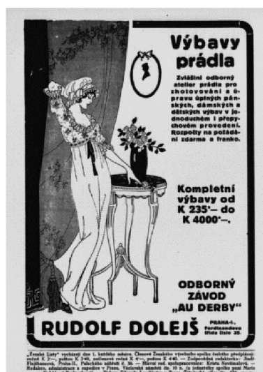
Obrázek 7: 1913, reklama na prádlo 238

K lepšímu pochopení vnímání ženské sexuality jistě slouží i vyobrazování jejího těla. Dobové materiály nabízí nespočet kusů a možností, jakým způsobem se žena dané doby ztvárňovala. V ženských periodikách byla vyobrazována velmi početně a spořádaně, na ženských focených aktech stejným způsobem, i dokonce i tím opačným. Jako ilustrace mohou posloužit dva extrémy, mezi nimiž se zobrazení ženského těla pohybovalo.