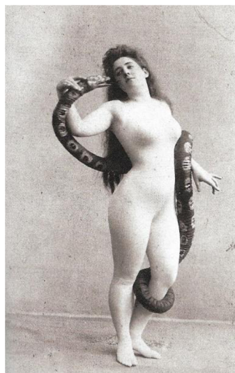
Obrázek 9: 1890, Léopold Reutlinger 241

Ženské akty byly foceny i jako čistě umělecká a estetická záležitost, fotograf si dal záležet na kompozici, prostředí, rekvizitách a přidal aktům určitý příběh a děj. Foceny byly jak v interiéru, tak v přírodě.