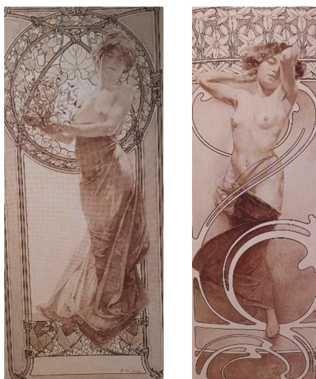
Obrázek 3: Documents décoratifs , Alfons Mucha, 1902 204 Obrázek 4: Documents décoratifs , Alfons Mucha, 1902 205

Na promítání se erotických motivů do literatury měl zajisté vliv i umělecký proud, který přibližně od roku 1890 hýbal celou Evropou. Secese (nebo také Glasgow Style či art nouveau ) dávala „ přiznačný důraz na dekorativnost ženského zjevu “. 201 Žena byla vyobrazována v županu nebo negližé, a tyto motivy byly považovány za maximálně smyslné a erotické. 202 Tento umělecký směr byl typický asymetrií, organickými formami, pastelovými barvami, přírodou a osobitostí. Nejdůležitějším prvkem byla ženská postava či linie jejího těla, rozpuštěné vlasy pak symbolizovaly erotiku, smyslnost a plodnost. 203