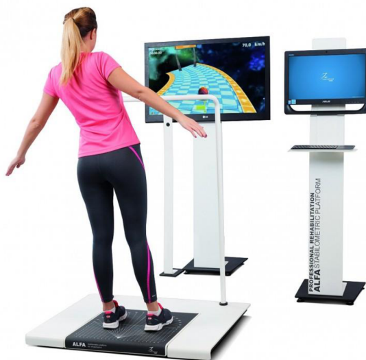
Obrázek 3. Dynamická posturografie.