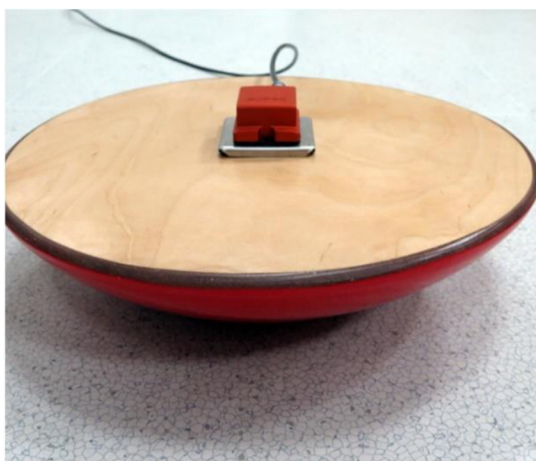
Obrázek 4. Desk balance (Svatoanenské listy, 2016).

Hlavní komponentu představuje staticky instabilní kulová výšeč a inerciální snímač náklonu, který snímá a měří náklon ve dvou nezávislých osách. Tyto osy jsou kolmé k tíhové síle země (Svatoanenské listy, 2016). Pacient má za úkol zaujmout co nejstabilnější stoj na kulové výšeči, přičemž sleduje (na obrazovce umístěné ve výšce jeho očí), jak moc se vychyluje ze středu a snaží se tato vychýlení co nejvíce minimalizovat (Vajčner, 2016). Hodnocena je kvalita stabilizačního systému pacienta. Samozřejmostí je i programové vybavení, které slouží k vyhodnocení a uchování výsledků. Díky tomu může terapeut výsledek vstupního vyšetření zanalyzovat a na závěr srovnat s výstupním vyšetřením, na jehož základě poté zhodnotí efekt terapie. A co se týče využití zařízení v samotné terapii, pacientovu posturální stabilitu je možné trénovat pomocí několika jednoduchých her, které jsou součástí programového vybavení (Svatoanenské listy, 2016).