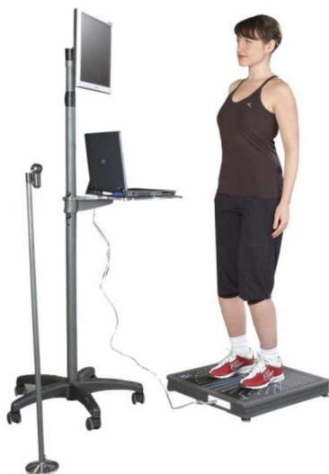
Obrázek 2. Statická posturografie.