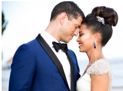
Obrázek 2: Manželství