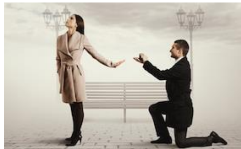
Obrázek 4: Nesezdané soužití