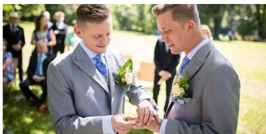
Obrázek 3: Registrované partnerství

Registrované partnerství se řídí primárně zákonem č. 115/2006 Sb., o registrovaném partnerství, ve znění pozdějších předpisů.