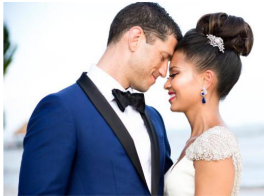
Obrázek 2: Manželství