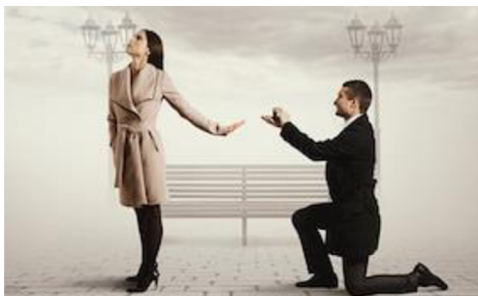
Obrázek 4: Nesezdané soužití