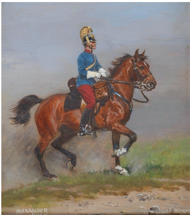
15. Alexander Pock, Poručík dragounského pluku č. 13 na koni, po roce 1900, olej na plátně, soukromá sbírka