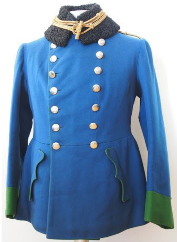
9. Pelzrock důstojníka dragounského pluku č. 9