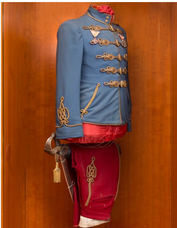
8. Uniforma nadporučíka husarů, včetně krapově červených rajtek a šavle M1869. Na prsou zdobena pěti řadami čamar.