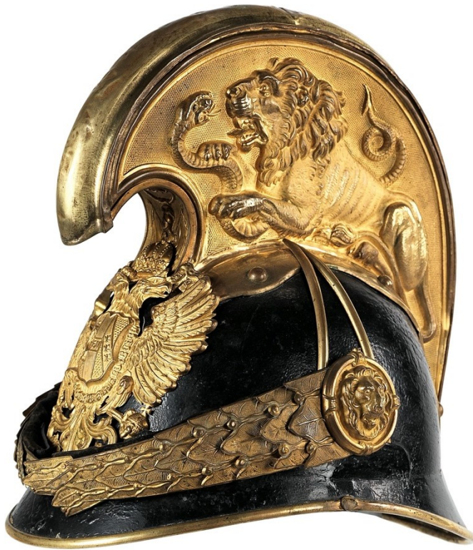
11. Dragounská důstojnická přilbice M1905 s hřebenem opatřeným reliéfem lva bojujícího s hadem (drakem)