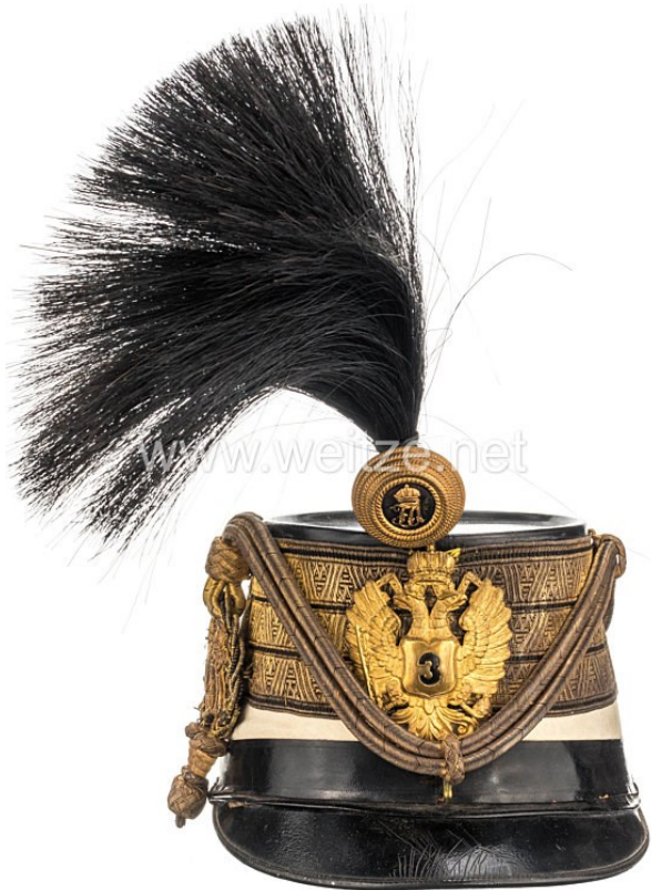
12. Čáko důstojníka husarského pluku č.3 s kompletní dekorací