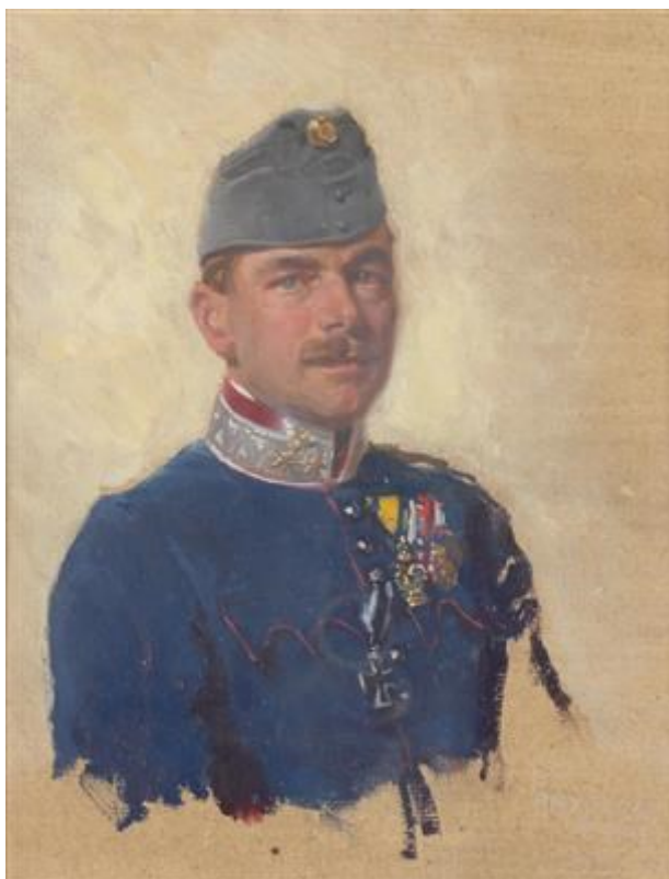
16. Alexander Pock, Portrét důstojníka hulánů, 1915, olej na kartonu, 41x26 cm, soukromá sbírka