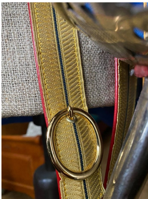
5. Detail zlatem vytkávané repliky služebního závěsníku na šavli pro důstojníky R-U jezdeckva