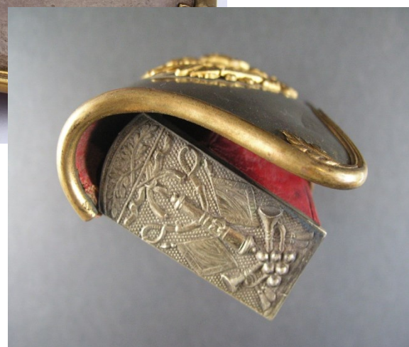
10. Patrontaška pro důstojníky jezdeckva, pohled na víko a postranní plastický reliéf