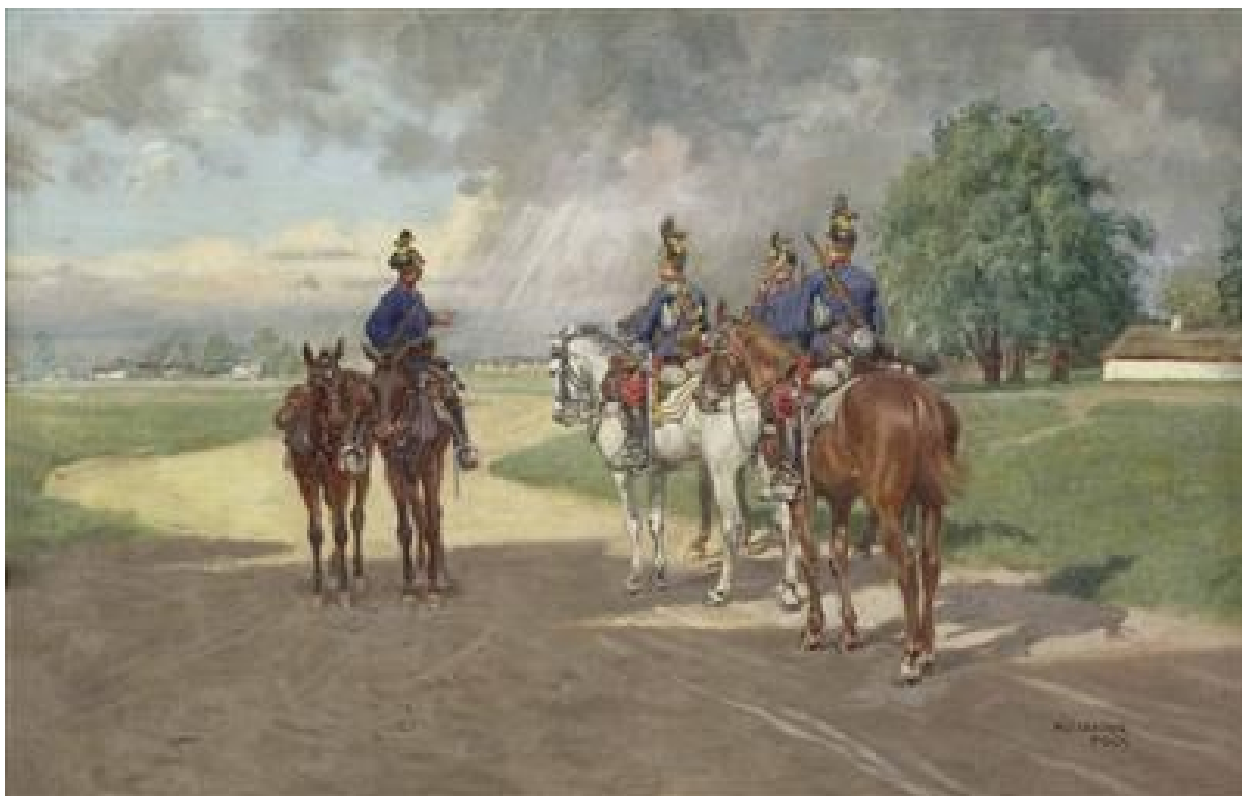
17. Alexander Pock, R-U huláni sledující bouřku, po roce 1900, olej na plátně, 45x70 cm, soukromá sbírka