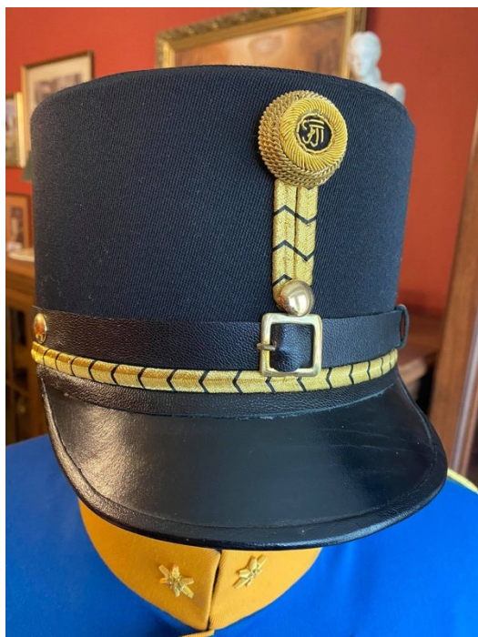
6. Replika důstojnické čepice (képi) ve střihu Belvedere, opatřena dracounovým jablíčkem, zvaným Röschen s iniciály císaře Františka Josefa I. (FJI)