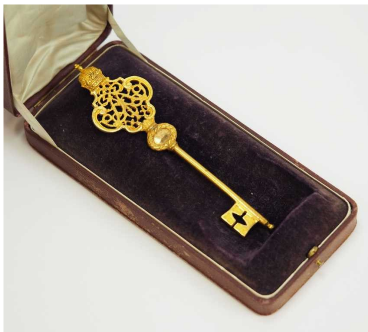
13. Zlatý klíč s dracounovým střapcem, jakožto odznak úřadu c. a k. císařského komořího