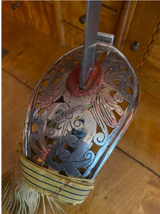
3. Detail florálně prořezávaného a rytého koše originálu šavle M1869 pro důstojníky R-U jezdecktva