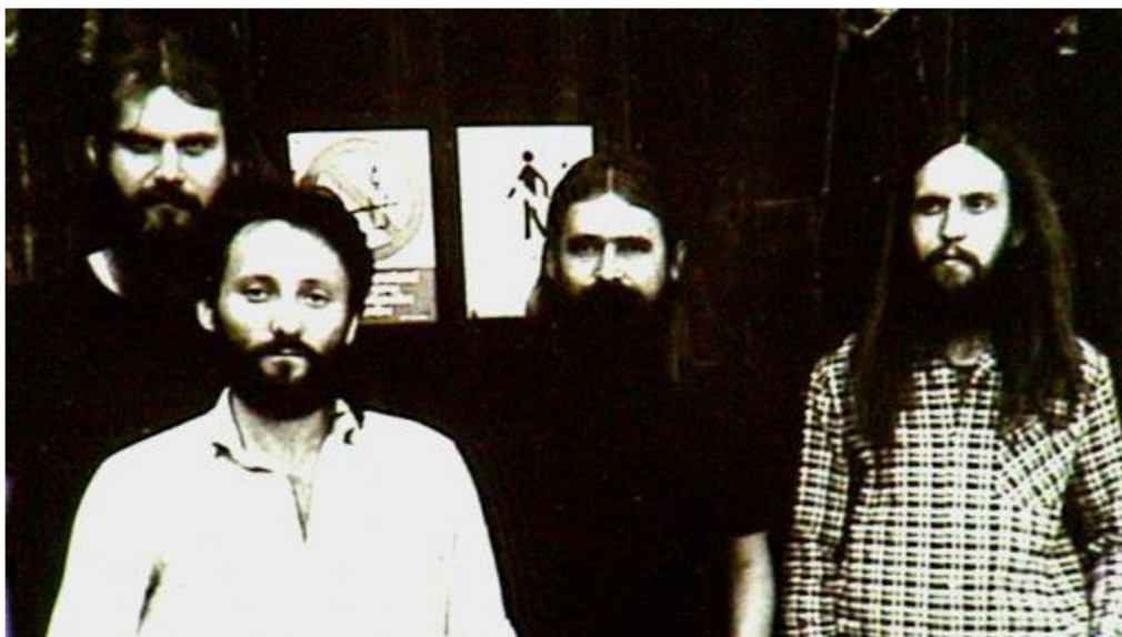
Příloha č. 25, 26: Hudební skupina Posádková Hudba Marného Slávy 150