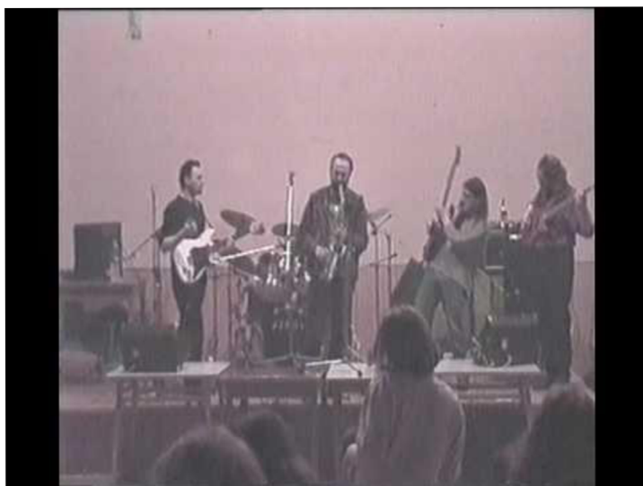
Příloha č. 26: Hudební skupina STRAM 151