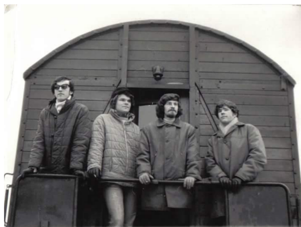
Příloha č. 7, 8: Hudební skupina Tango