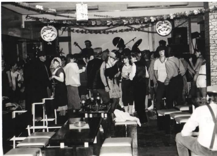
Příloha č. 35, 36, 37: Sraz muzikantů v Klubu mladých na Ohradě 157