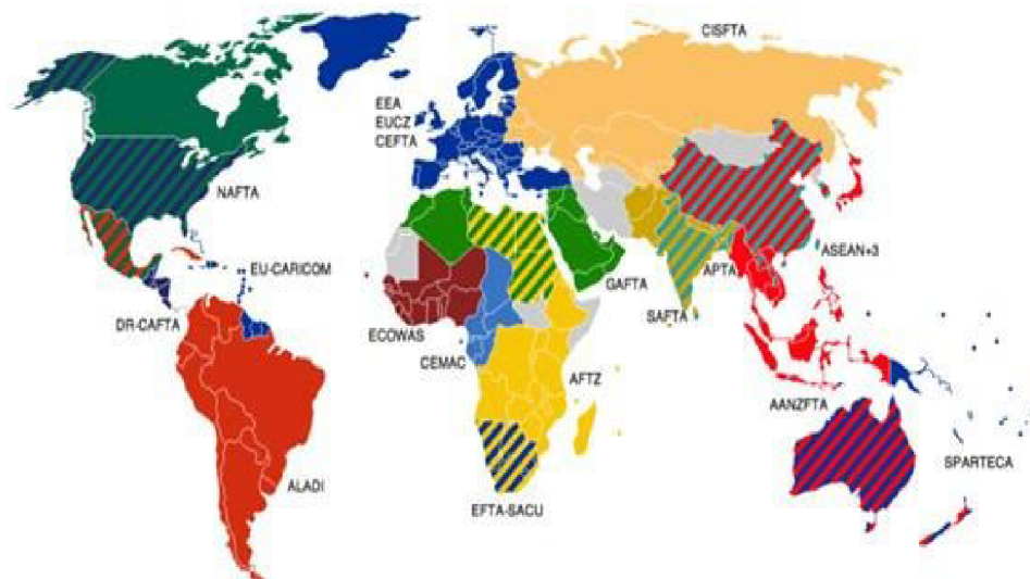
Obrázek 1 - Zóny volného obchodu